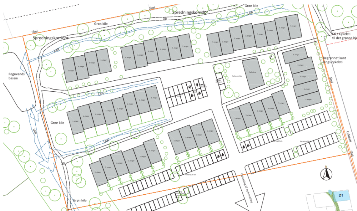
Skitse af delområde 1 i projektet. Grafik: Kuben Management.

Den 11. februar bliver der holdt et online informationsmøde om den kommende boligudvikling i Vinge på arealerne sydvest for Fællesmagasinet.