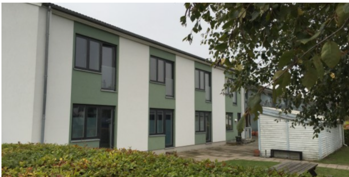
Ungdomsboligerne på Birkevænget.