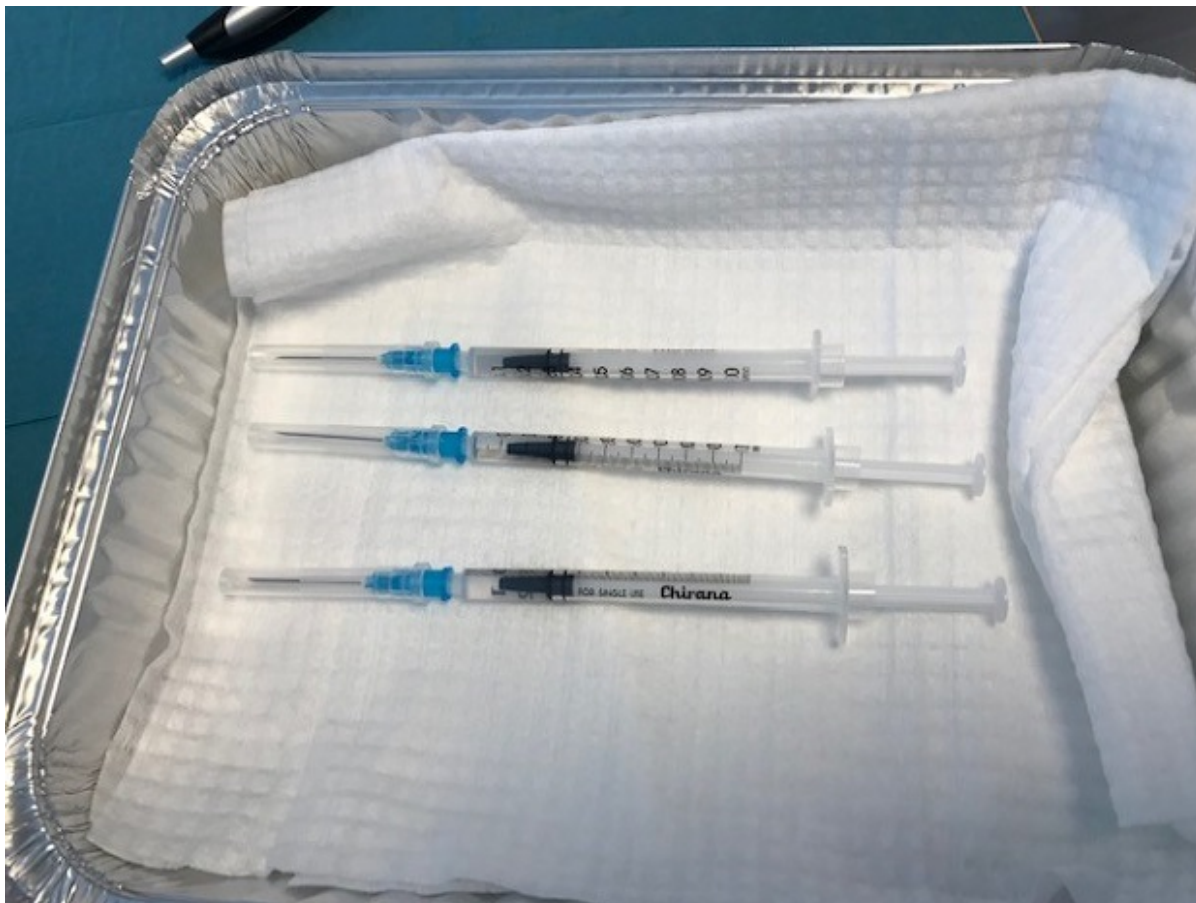
Tre vacciner i en foliebakke.

Alle borgere på 93 år og derover i Frederikssund Kommune, modtager nu vaccinationsbrev fra Statens Seruminstitut i deres e-boks eller med A-post. Hjælp derfor gerne disse borgere med at bestille tid til vaccination, der foregår mandag den 8. og tirsdag den 9. februar.