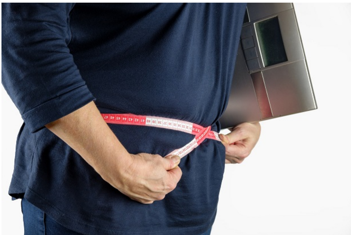
Person måler sin mave med et målebånd og har en badevægt under armen.