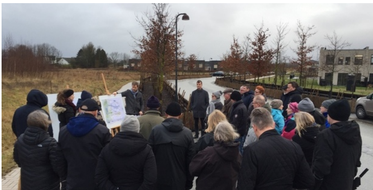
Omkring 25 borgere fra lokalområdet var samlet for at høre om lokalplanen.

Tirsdag den 1. februar havde Frederikssund Kommune inviteret til dialogmøde i grøftekanten om den kommende lokalplan for området mellem Mekongvej og Deltavej i Vinge. Omkring 25 borgere dukkede op for at få en snak om planen.