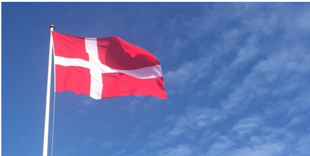
Dannebrog vajer mod en blå himmel.