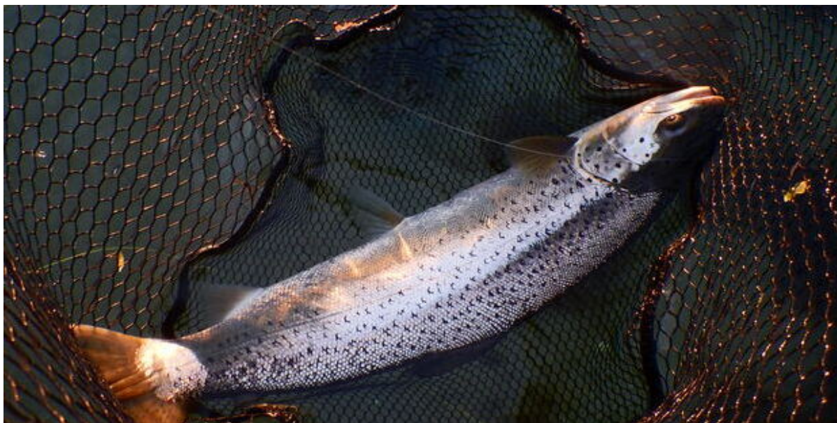
Havørred i et net.