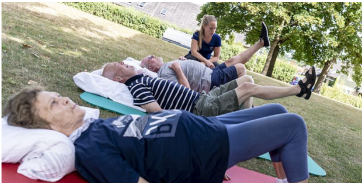
Et hold ældre får genoptræning udendørs.