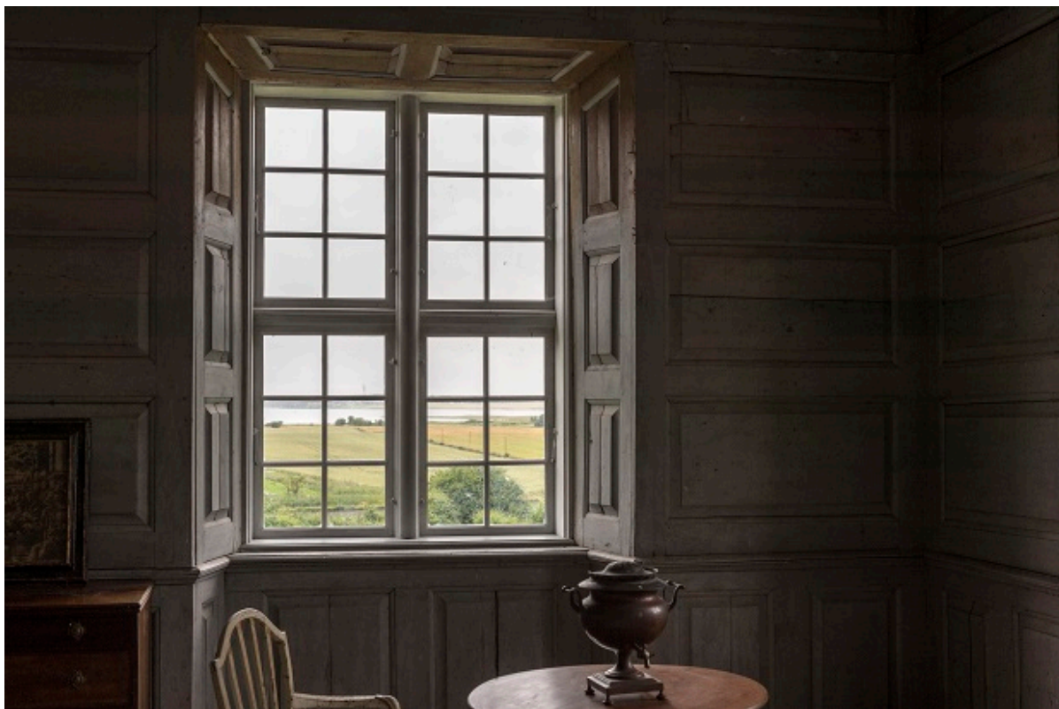
Vindue på Selsø Slot.