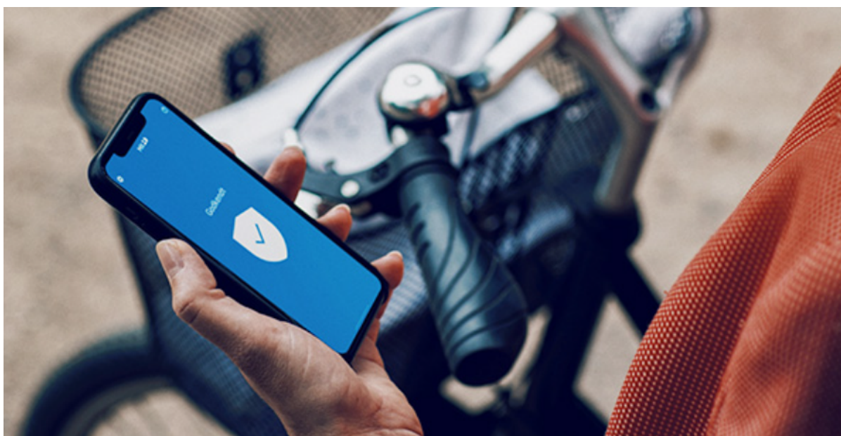
Hånd holder mobiltelefon med MitID app åben.

MitID oplever tekniske problemer, som betyder, at der i øjeblikket ikke kan oprettes nye MitID-brugere.