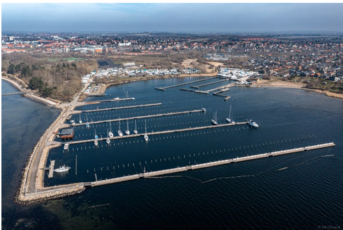
Frederikssund Lystbådehavn.

Interessen for at blive en del af arkitektkonkurrencen for Maritimt Center Frederikssund har været stor. Og ikke alene har der været mange ansøgere, men kvaliteten af ansøgerfeltet har været højt.