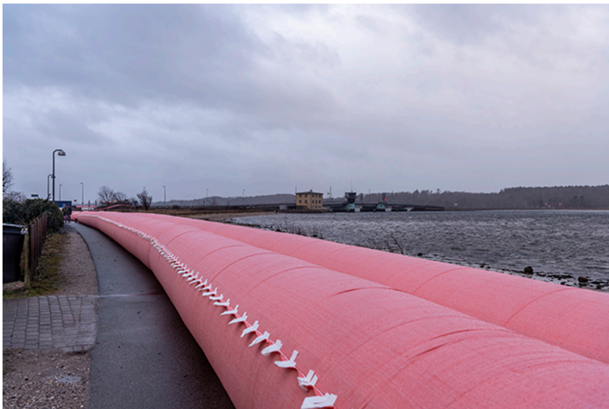
Watertube på strandvej.