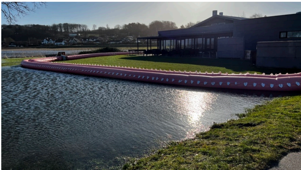
Watertuben ved Kignæshallen har holdt vandet væk fra hallen.