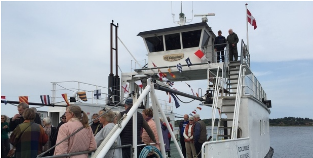
M/F Columbus.

Flere hundrede mennesker var mødt frem på havnen i Kulhuse fredag den 23. september for at fejre færgeren Columbus 75-års fødselsdag.