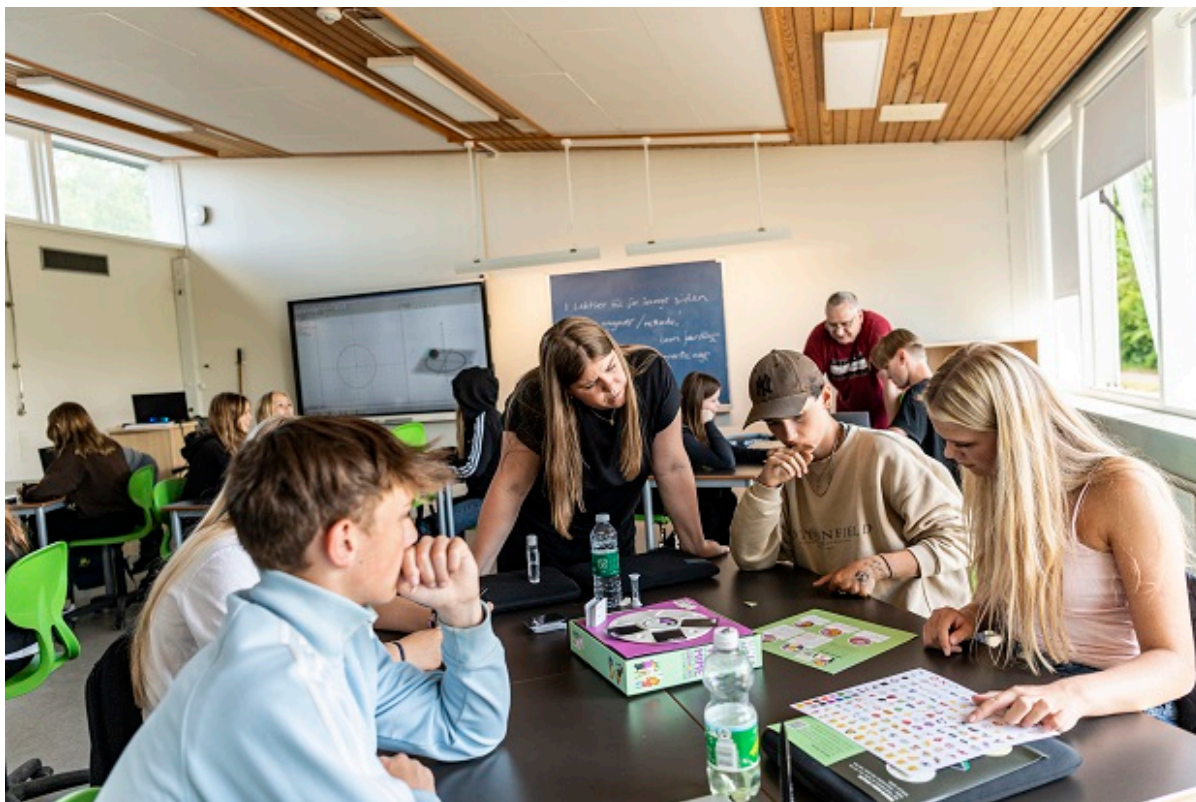
Elever til undervisning.

Alle kommuner i Danmark kan søge om frisættelse for lovgivningen på et af tre velfærdsområder. Byrådet i Frederikssund Kommune har besluttet at søge om frisættelse på folkeskoleområdet som første prioritet, og på ældreområdet som anden prioritet.