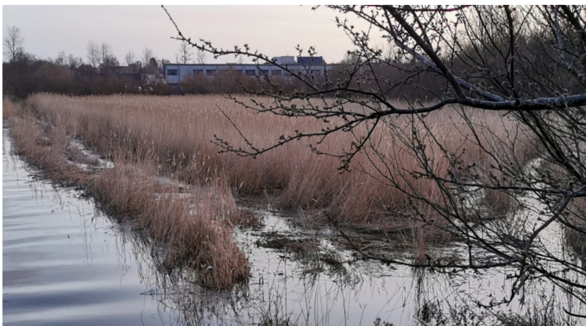
Oversvømmet rørskov ved vintertid.

På Byrådets seneste møde blev det besluttet at sende forslaget til klimatilpasningsplan i fire ugers offentlig høring. Planen er en del af forarbejdet til den kommende DK2020-Klimaplan.