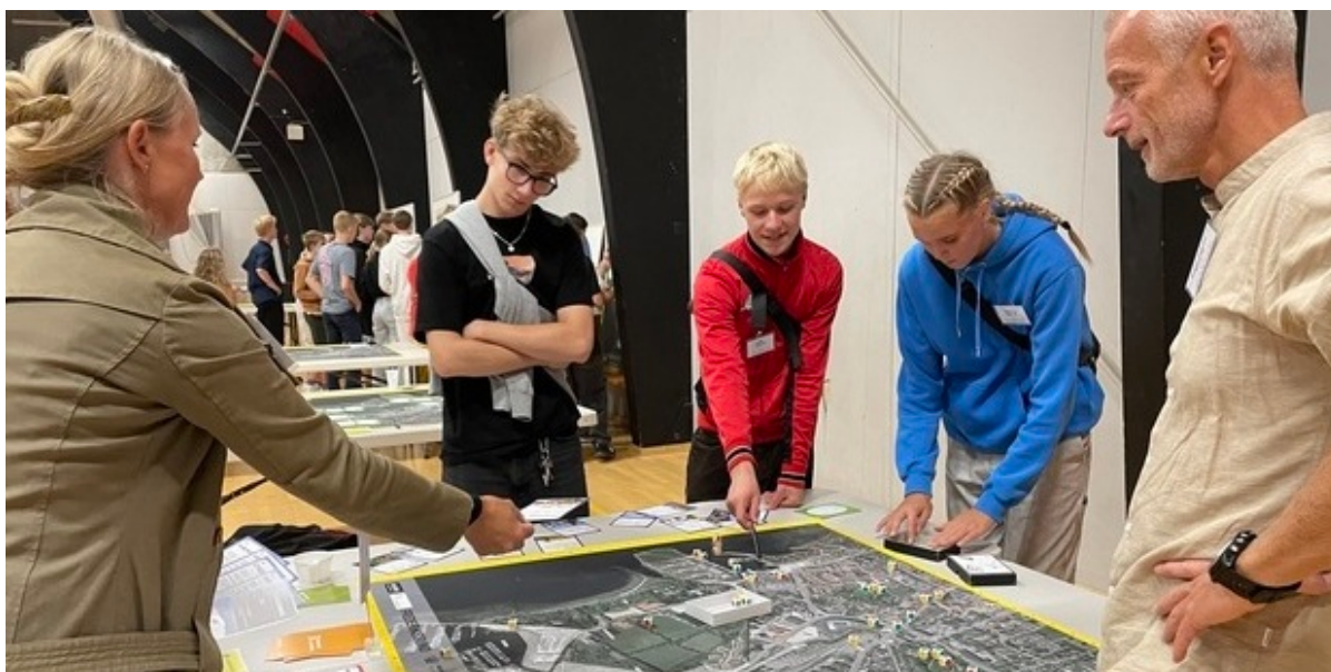
Fire personer står om et bord og kigger på et kort over Frederikssund midtby.