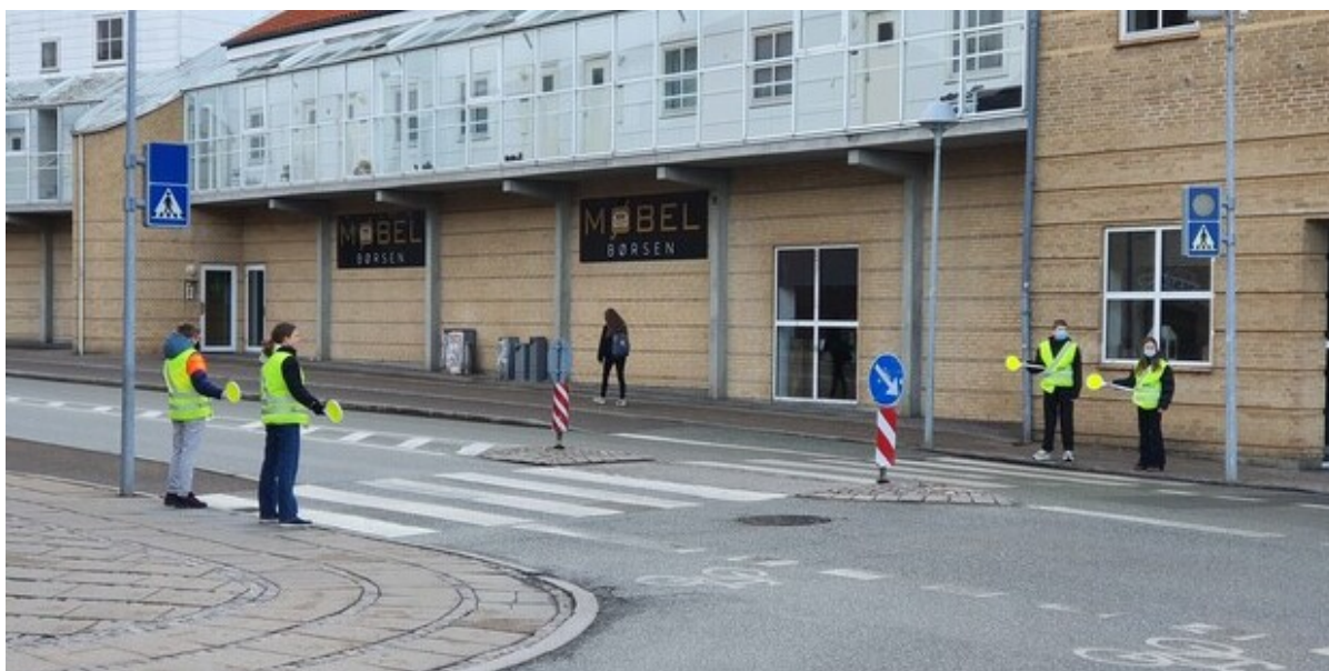
Skolepatruljer på arbejde ved Frederikssund Private Realskole.