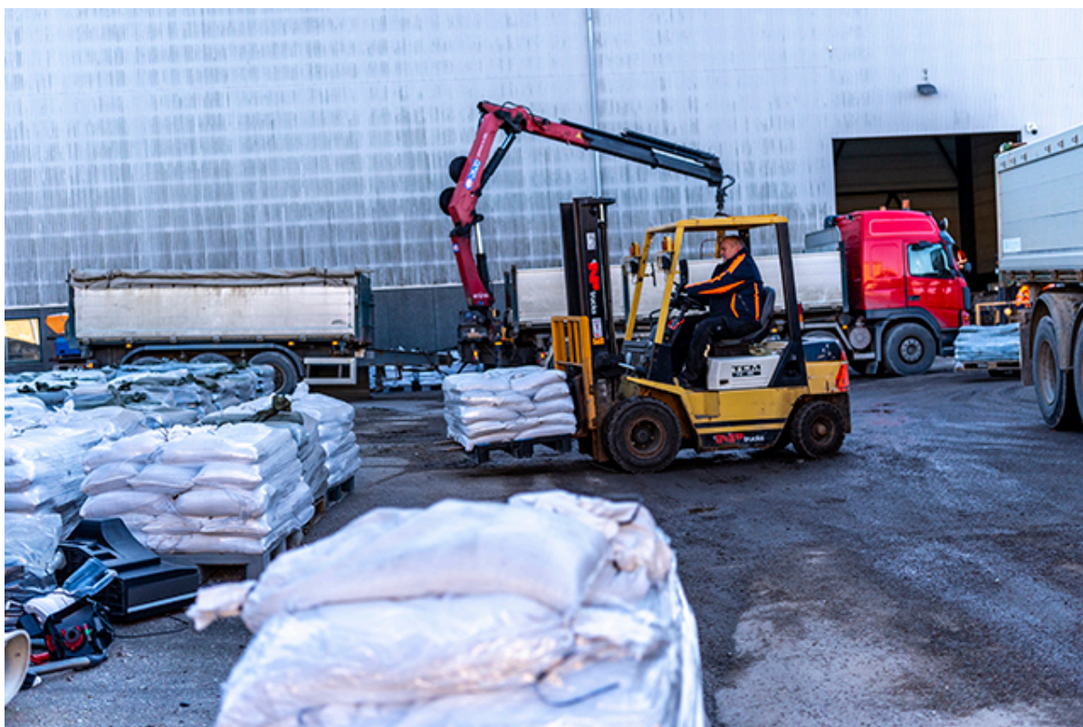
Sandsække gøres klar til distribution. De skal ikke retur til kommunen.

Hvis du har hentet sandsække fra et af kommunens depoter, så skal de ikke returneres.