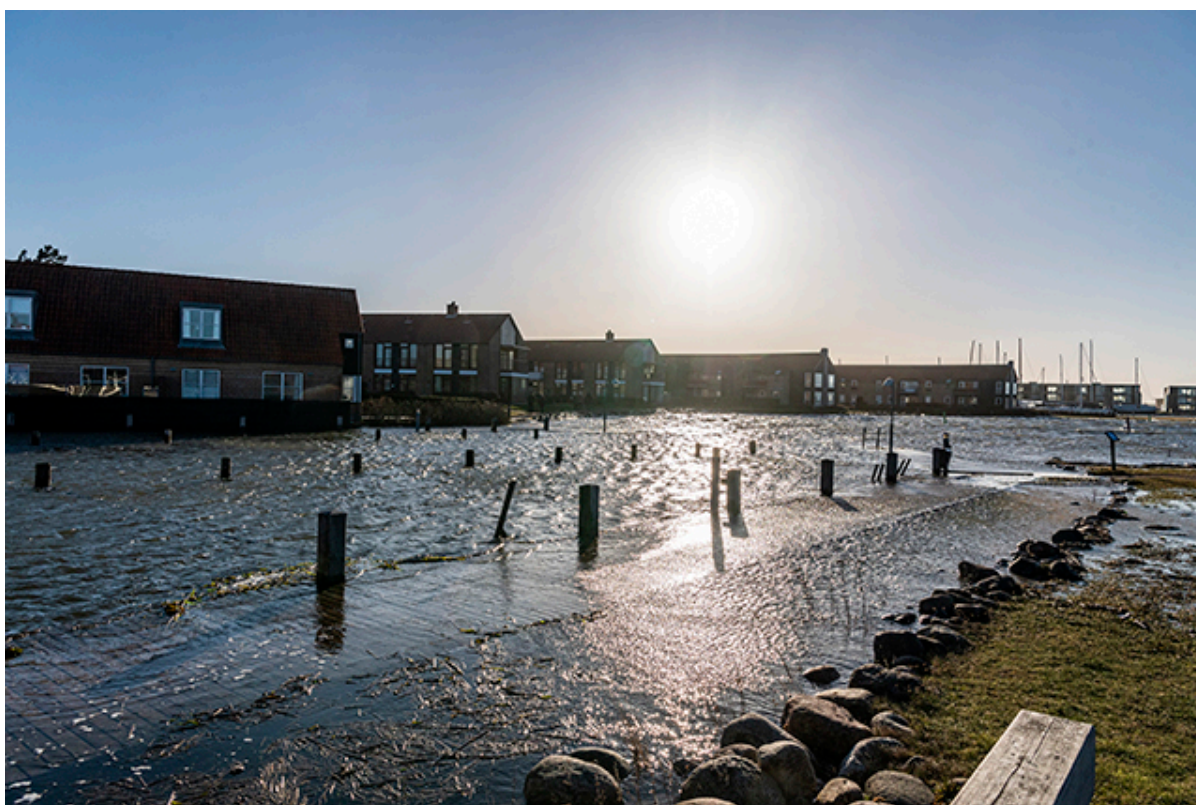
Højvande ved Skillebakke Havn.

Siden søndag aften og nat har beredskabet arbejdet på at rydde op efter storm og højvande. De sidste watertubes bliver fjernet i løbet af tirsdagen.