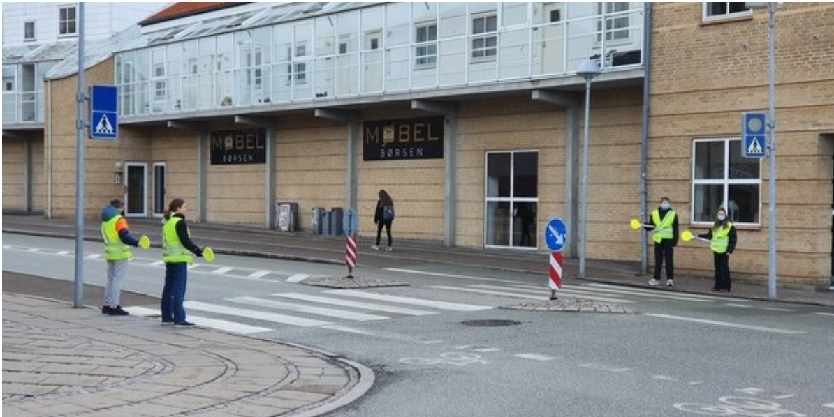
Skolepatruljer på arbejde ved Frederikssund Private Realskole.

I uge 5 er vejret altid lidt surt. Derfor overrasker Nordsjællands Politi og de nordsjællandske kommuner i de kommende dage skolepatruljerne for at anerkende deres store indsats.