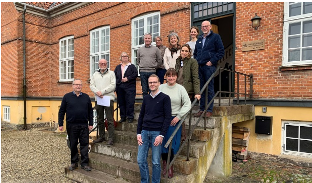
Bestyrelsen for Selsø Slot, januar 2022.