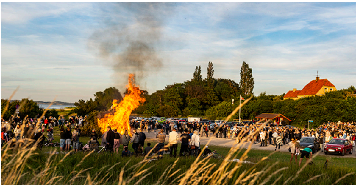
Sankhansbål på Kulhuse Havn i 2019.