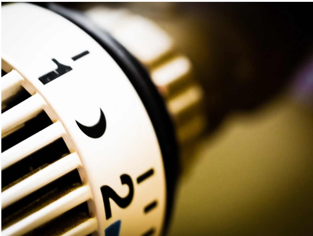
Termostat på radiator.