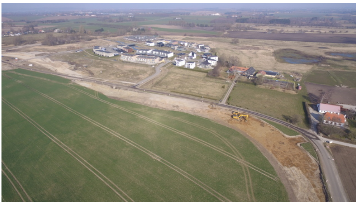
Vejarbejde på Dalvejen.