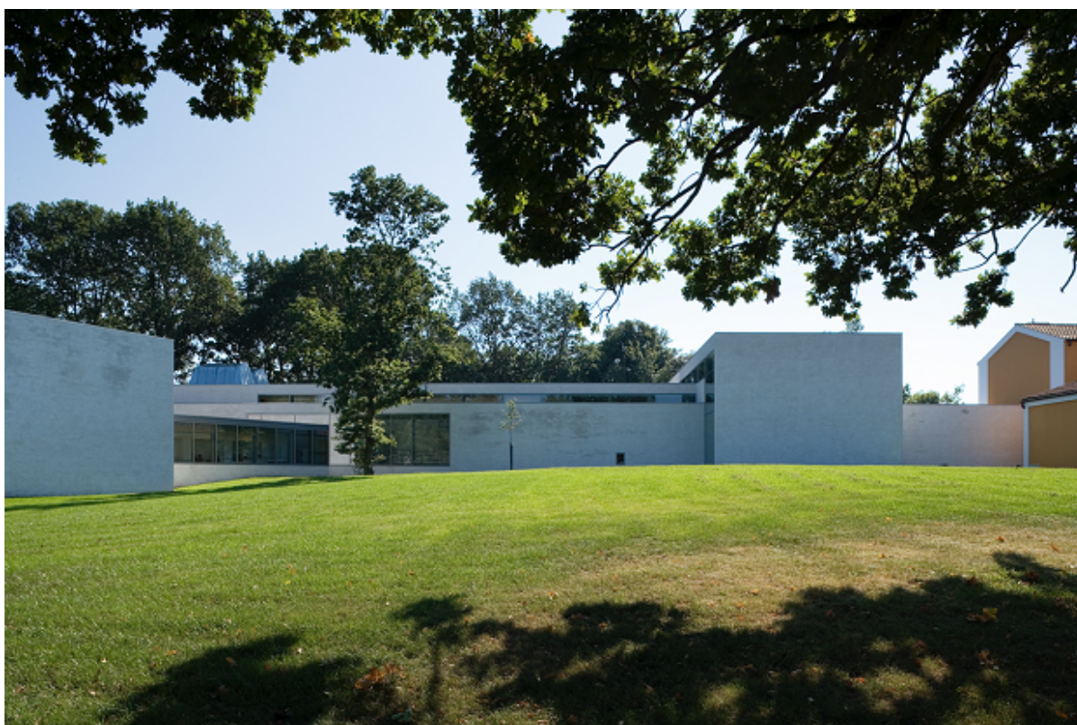
Willumsens Museum set fra J.F. Willumsensvej.

Willumsens Museum står over for en større renovering, der vil sikre, at museet fremover har de helt rigtige rammer til både at vise værker af J.F. Willumsen og internationale kunstnere.