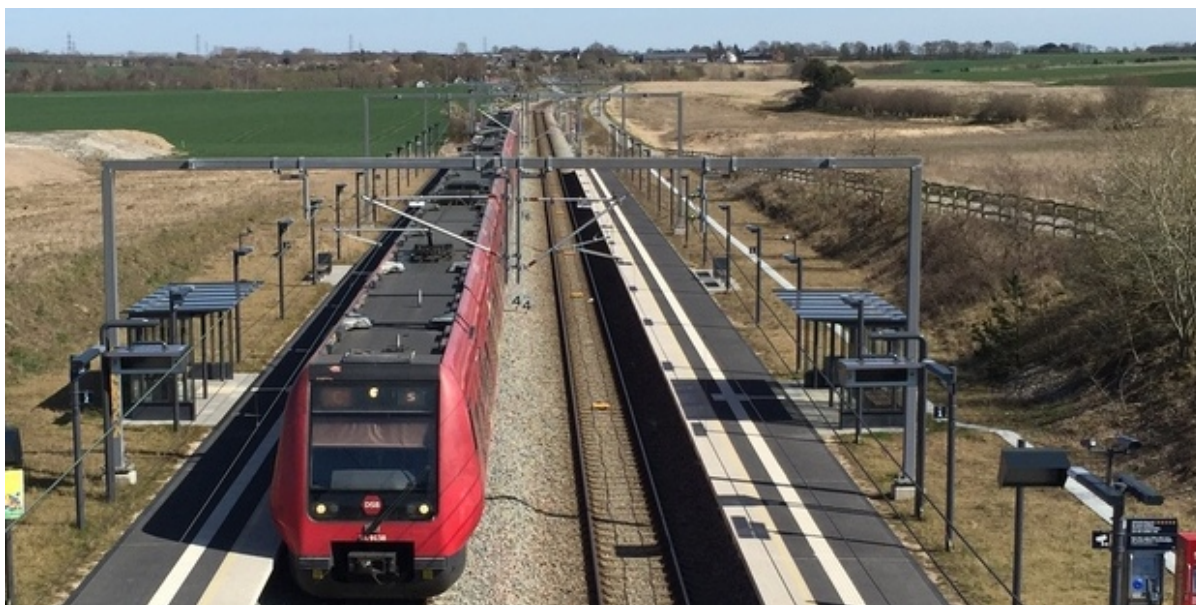
S-tog holder på Vinge Station.

Banedanmark skal foretage blandt andet sporjusteringer og reparationer på strækningen fra Frederikssund til Ølstykke. Arbejdet vil foregå om natten og kan være støjende.