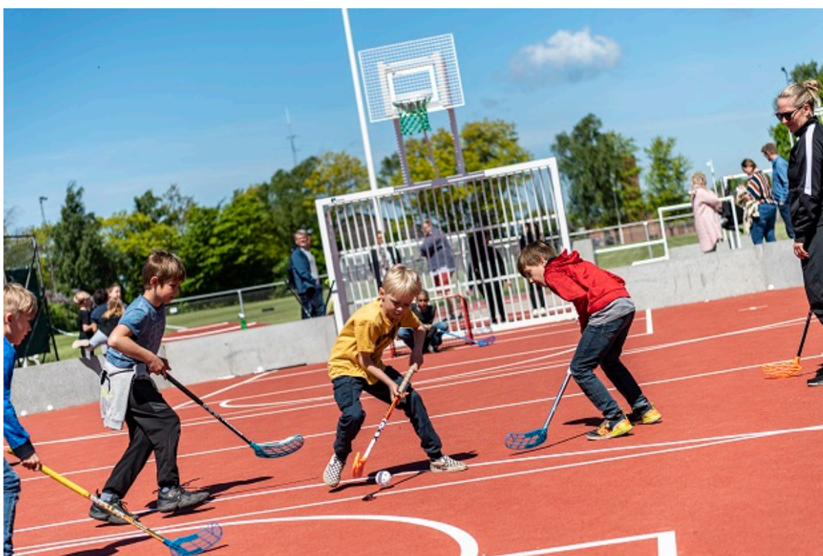
Børn spiller hockey.

Byrådet har godkendt en ny børne- og ungepolitik gældende for 2021 til 2024. Børne- og Ungepolitikken skal være med til at sætte retningen for arbejdet med området i de næste år og sikre, at Frederikssund Kommune er et godt sted at vokse op.