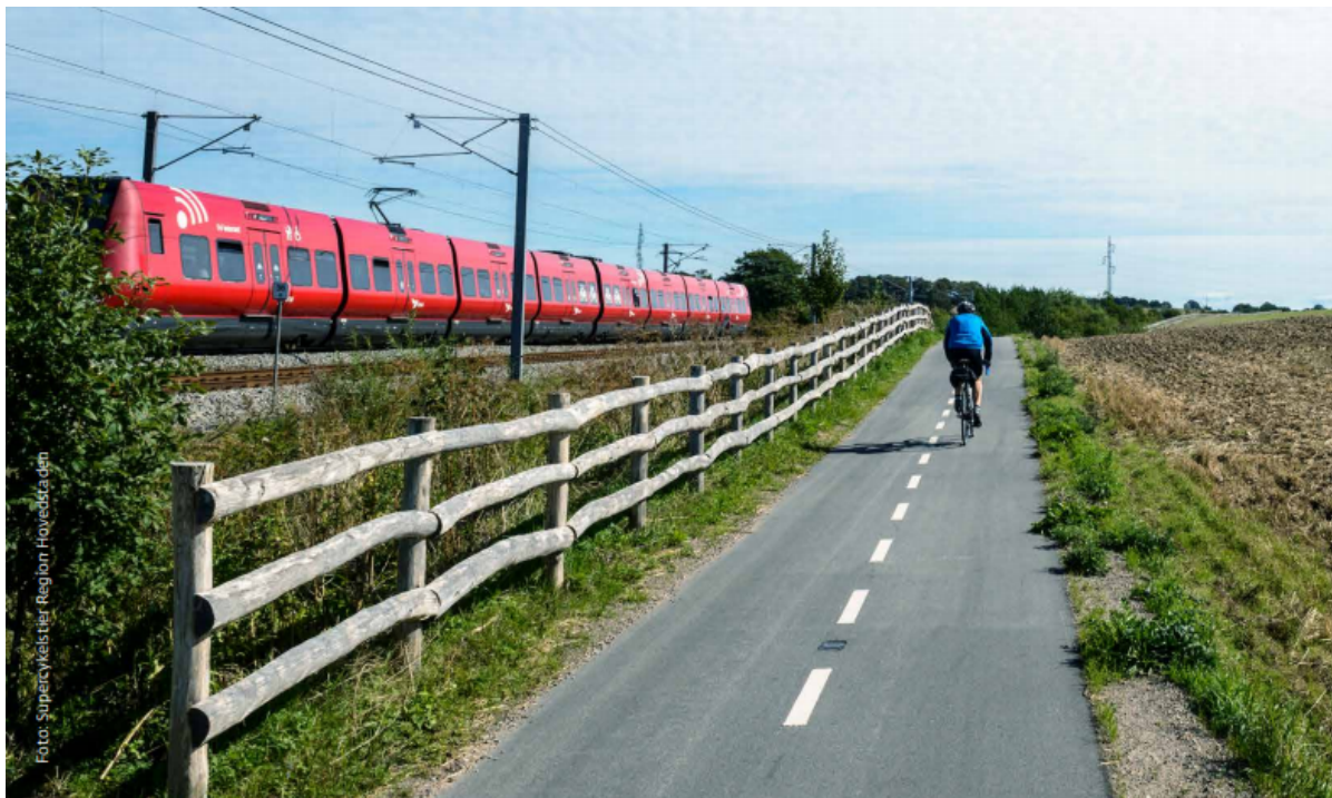
Cyklister på cykelsti langs S-banen.

Frederikssund Kommune skal være uafhængig af fossile brændsler i år 2030. En ny klimahandleplan, der netop er vedtaget af Byrådet beskriver de indsatser, der skal til for at nå målet.