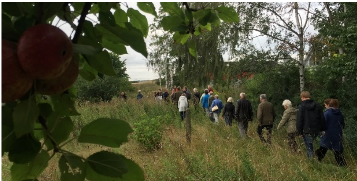
Deltagerne går over et engområde med frugttræer.