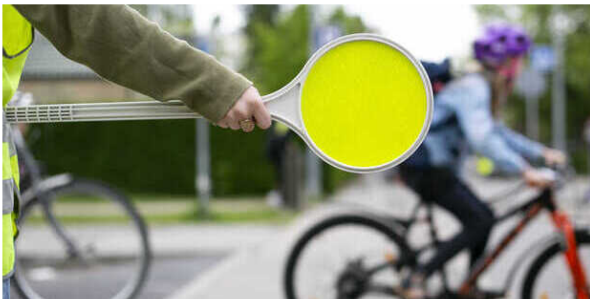
Skolepatrulje hjælper cyklist over vejen.

I september deltager Frederikssund Kommune i kampagnen "Pas på skolepatruljen" sammen med blandt andre Rådet for Sikker Trafik. Kampagnens formål er, at trafikanterne skal vise mere hensyn til skolepatruljerne og respektere deres vigtige arbejde.