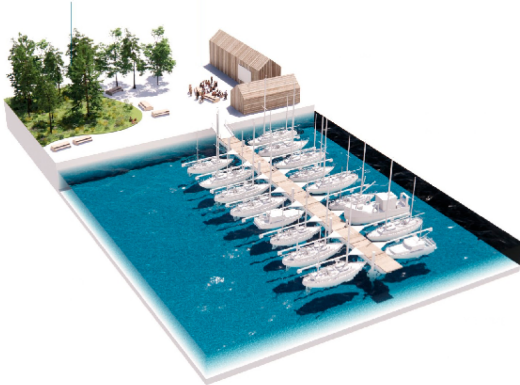
Illustration af havn med bådene i vandet og havneplads med grønt område, siddepladser og plads til ophold. Illustration: JAJA architects ApS.