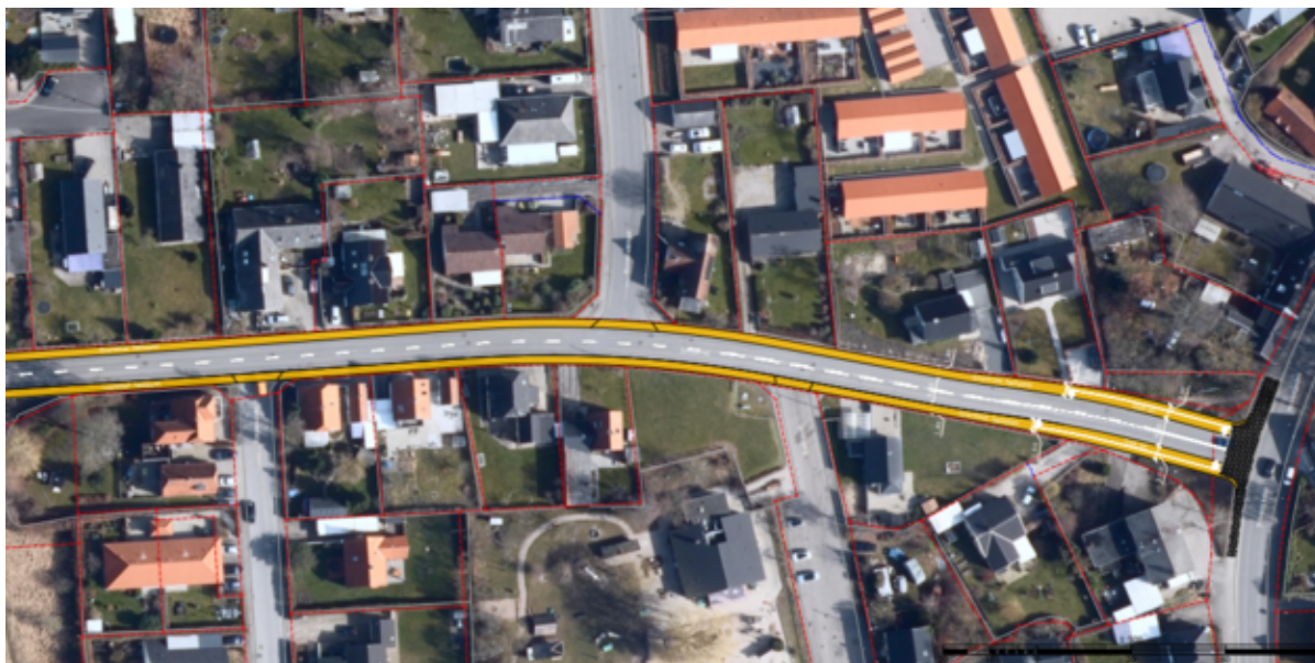
Visualisering af de nye fællesstier på Saltsøvej i Skibby.

Frederikssund Kommune begynder i uge 37 arbejdet med at anlægge fællesstier på begge sider af Saltsøvej i Skibby. Projektet ventes færdigt inden jul.