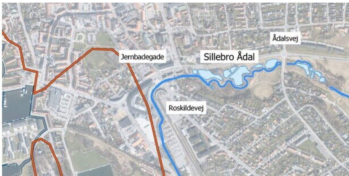
Kort over Sillebro Ådal.