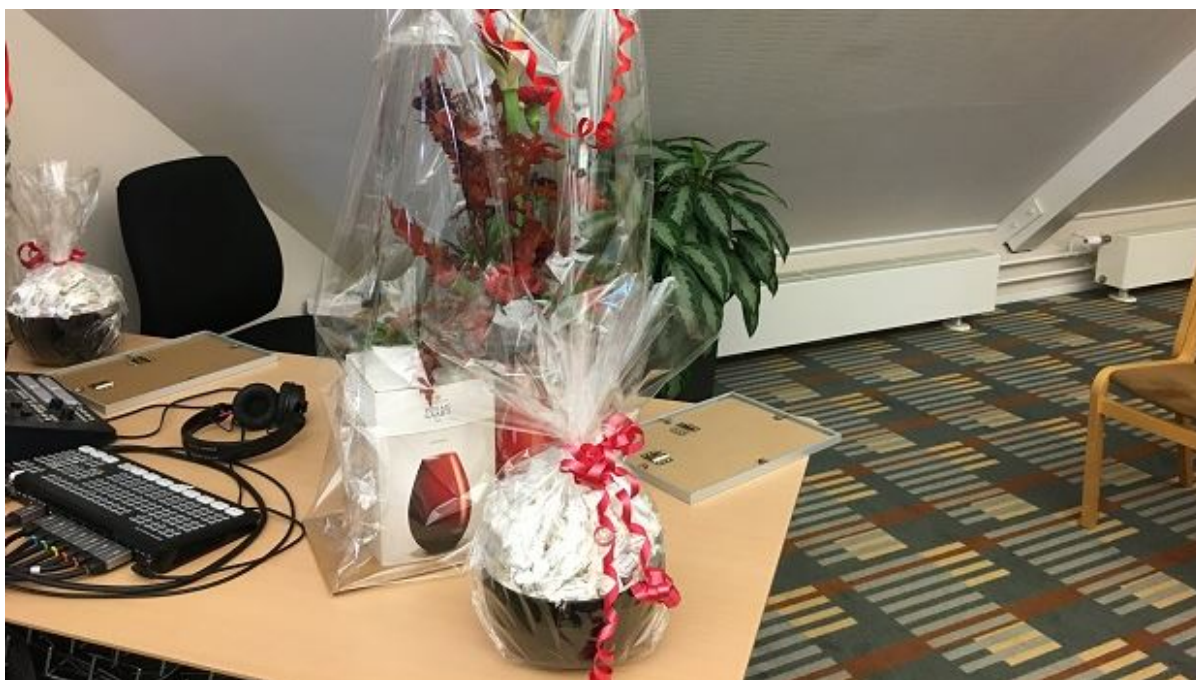
Blomster i vase og en skål fyldt med bolsjer, var noget af det, vinderne af Handicapprisen 2020 og 2021 fik overrakt. Derudover fik de et diplom.

Fredag den 3. december blev der uddelt handicappriser for både 2020 og 2021. Priserne gik til henholdsvis initiativtagerne til "Sammen om Kultur" og specialskolen Kærholm afdeling Kølholm.