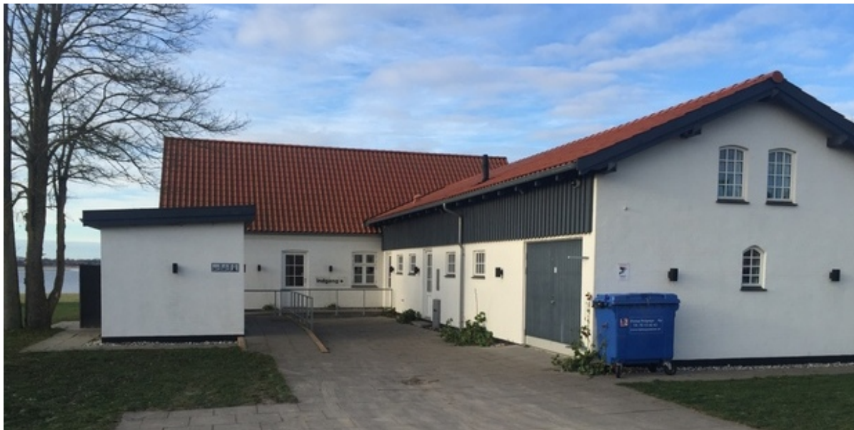
Østersvej 4.

Fra den 10. december vil PCR testcentret flytte fra Lundevej til Østersvej i en midlertidig periode, indtil der findes et mere centralt sted.