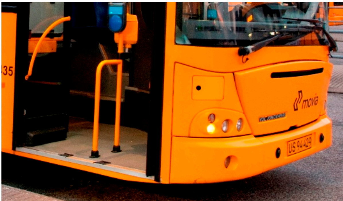
Bus med åben dør.

Frederikssund Kommune beder nu alle borgere over 18 år om hjælp og input til en ny mobilitetsplan. Mobilitetsplanen skal sætte rammerne for, hvordan vi kan opretholde mobiliteten samtidig med, at vi reducerer klimabelastningen.