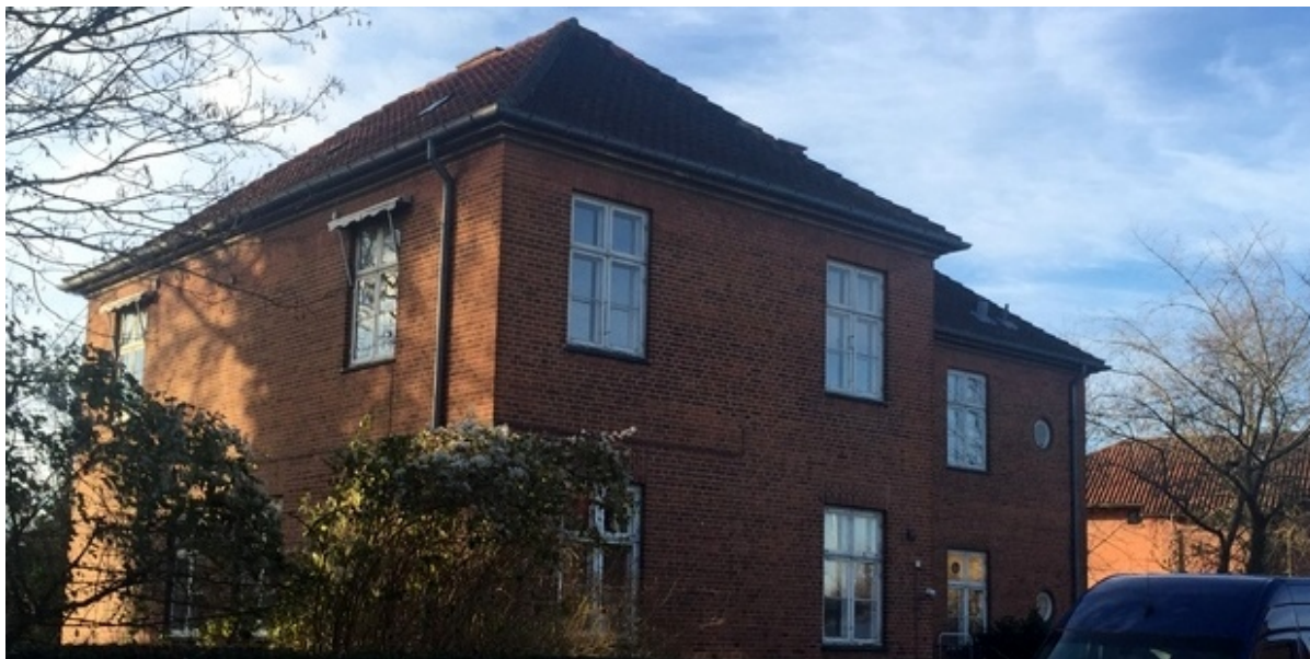
Huset på Lundevej 13.

Rådgivningshuset er nødt til at lukke et par dage for personlig henvendelse på grund af flytning. Der vil stadig være åbent på telefonerne.