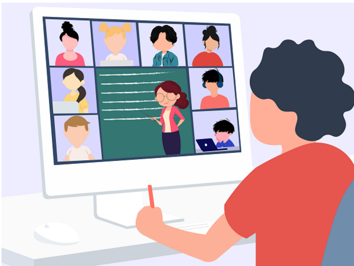
Online undervisning.