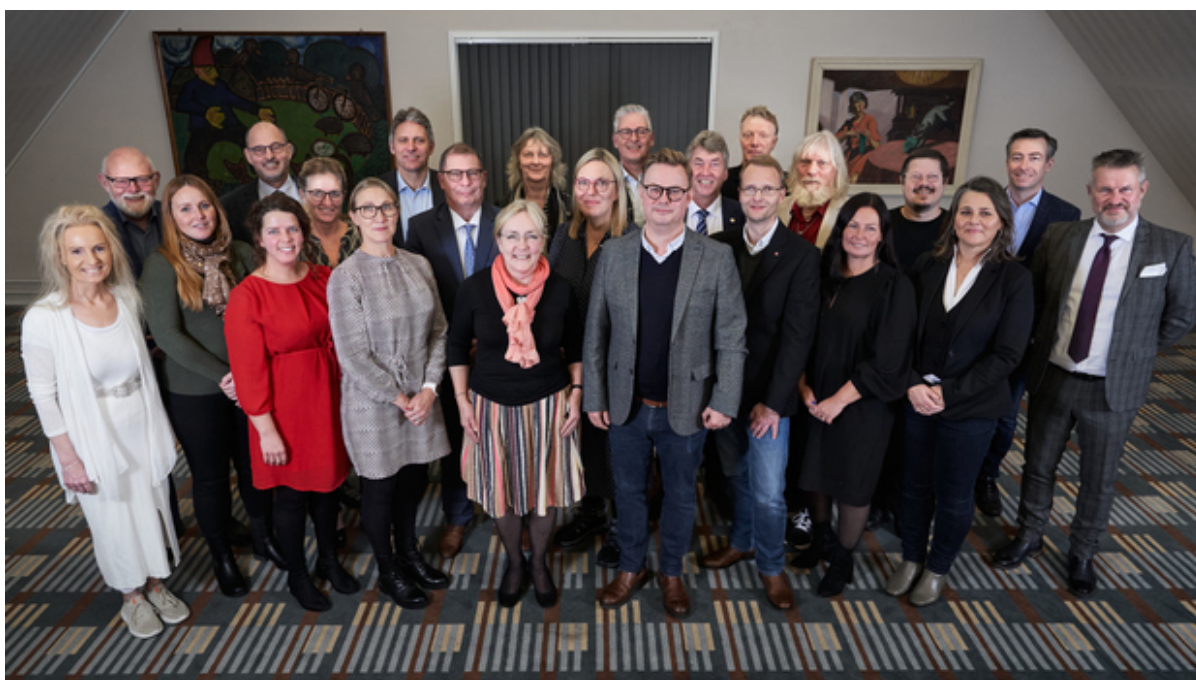
Frederikssund Byråd 2022 - 2025.

Se dagsordnerne til de konstituerende møder i de nye fagudvalg den torsdag den 16. december 2021.