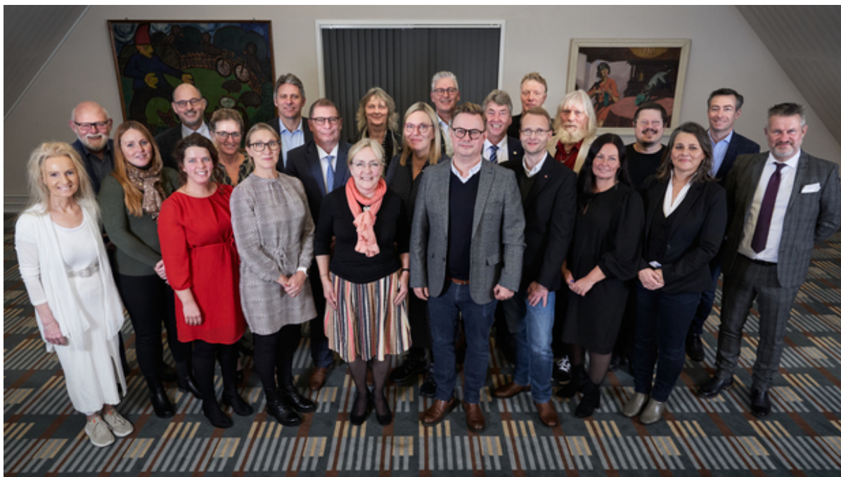
Frederikssund Byråd 2022 - 2025.