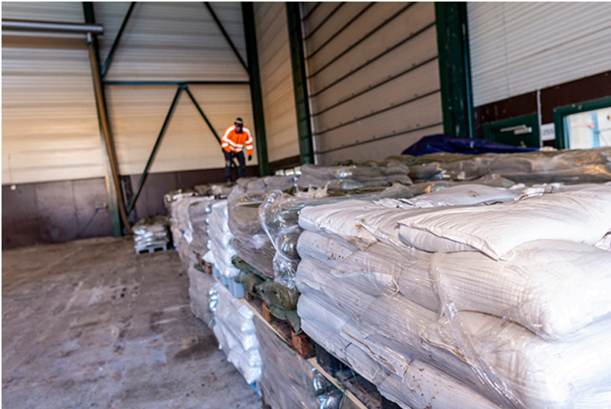
Depot af Sandsække hos Vej og Park.

Godt hjulpet af mange lokale vognmænd er depoterne med sandsække rundt omkring i kommunen klar i løbet af fredag aften.