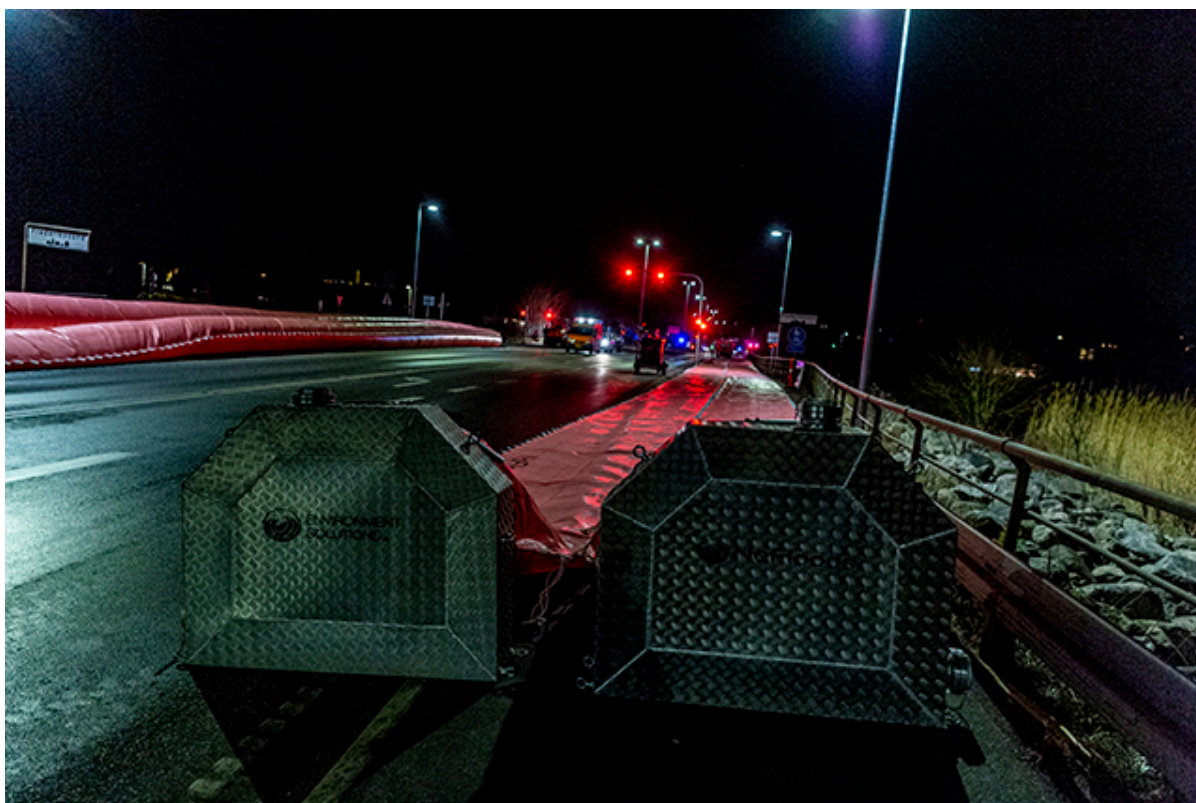
Watertubes er klar til fyldning med vand.