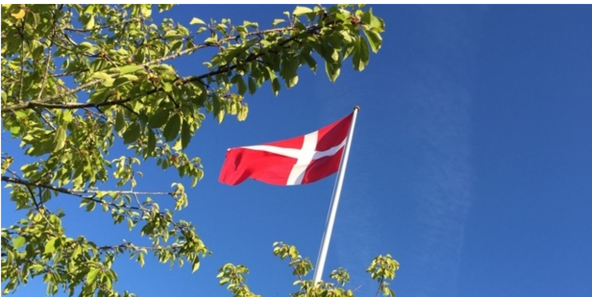
Dannebrog vajer mod en blå himmel.

Mandag den 5. september er den nationale flagdag for Danmarks udsendte og veteraner. Det blev traditionen tro markeret på Torvet i Frederikssund med flaghejsning kl. 8 og efterfølgende taler. Senere bød dagen også på indvielse af en ny veterancafé.