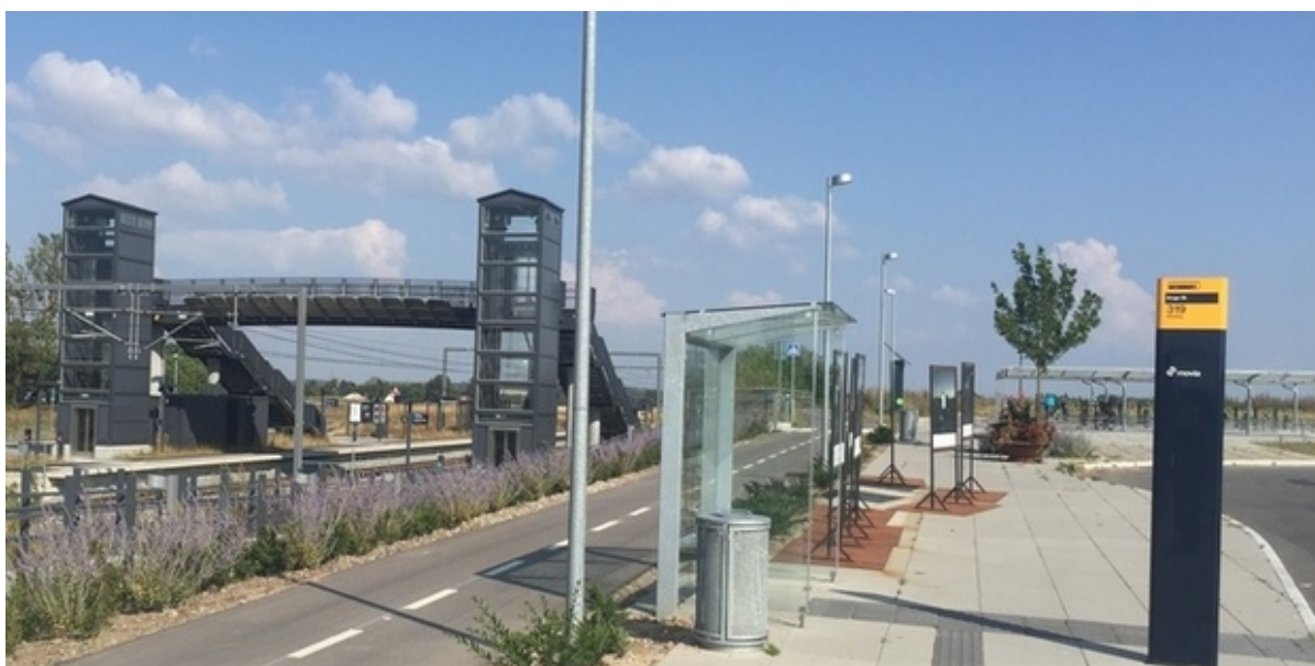
Vinge Station.

Nu inviterer Frederikssund Kommune igen til Vingevandring. Det sker mandag den 26. september med mødested ved Vinge Station.