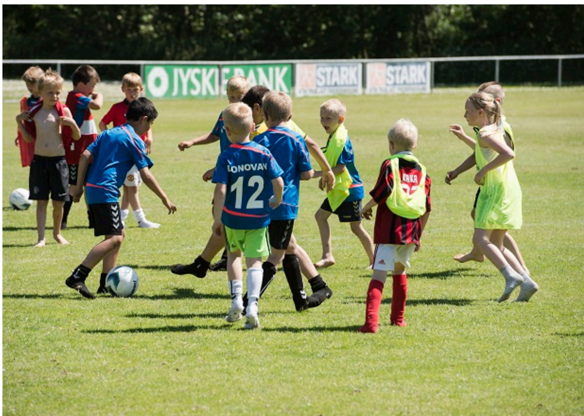
Børn spiller fodbold.