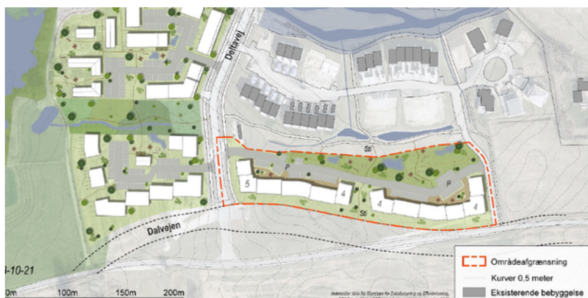
Kortudsnit, der viser den kommende lokalplans afgrænsning. Grafik: Frederikssund Kommune.

Frederikssund Kommune inviterer nu interesserede borgere til et udendørs "åbent hus"-dialogmøde om en ny lokalplan for området mellem Mekongvej og Deltavej i Vinge.