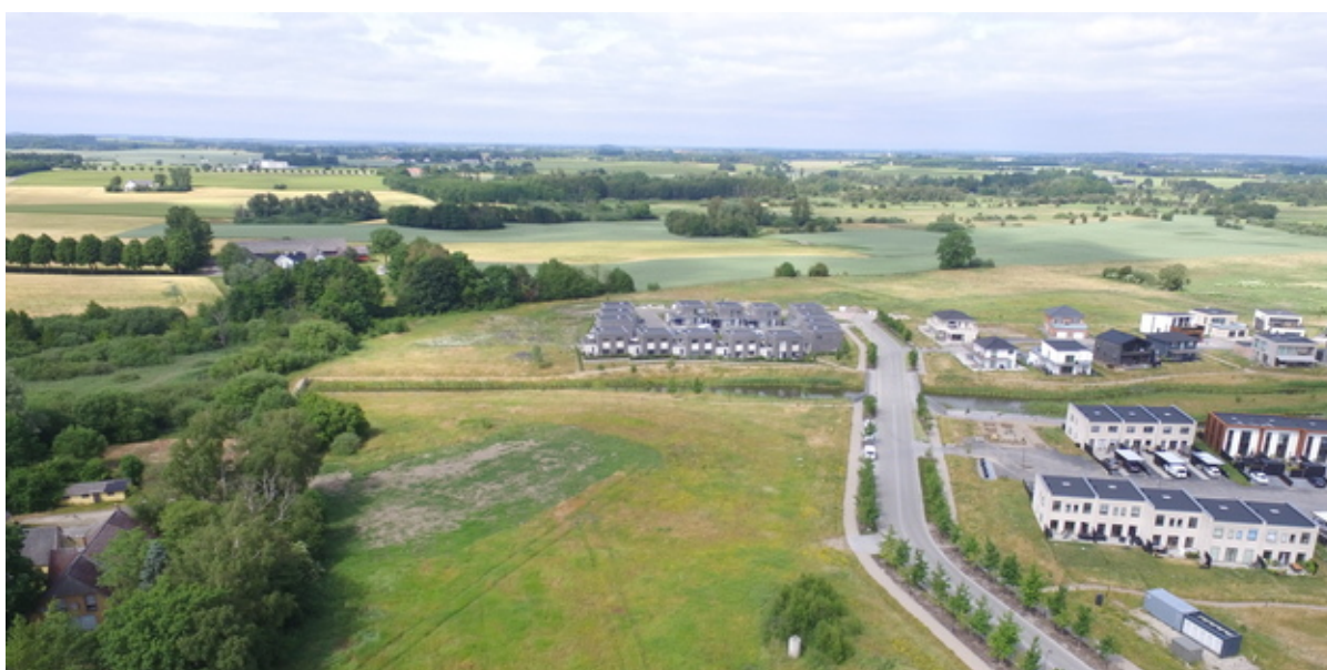
Arealerne, som Ikano Bolig skal udvikle, ligger nord for det eksisterende Deltakvarter i Vinge.

Ikano Bolig A/S har sikret sig muligheden for at boligudvikle et større privat areal i Vinge. Selskabet har store ambitioner, der skal udfoldes over en længere årrække.