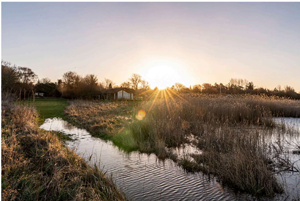
Over Dra by Strand var stedet hvor vandet kom tættest på.