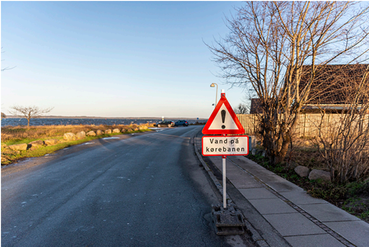
Skiltning om vand på kørebanen.

Som ventet allerede først på ugen, så varsler DMI igen torsdag forhøjet vandstand i både Roskilde Fjord og Isefjord. Heller ikke denne gang forventes en kritisk vandstand.