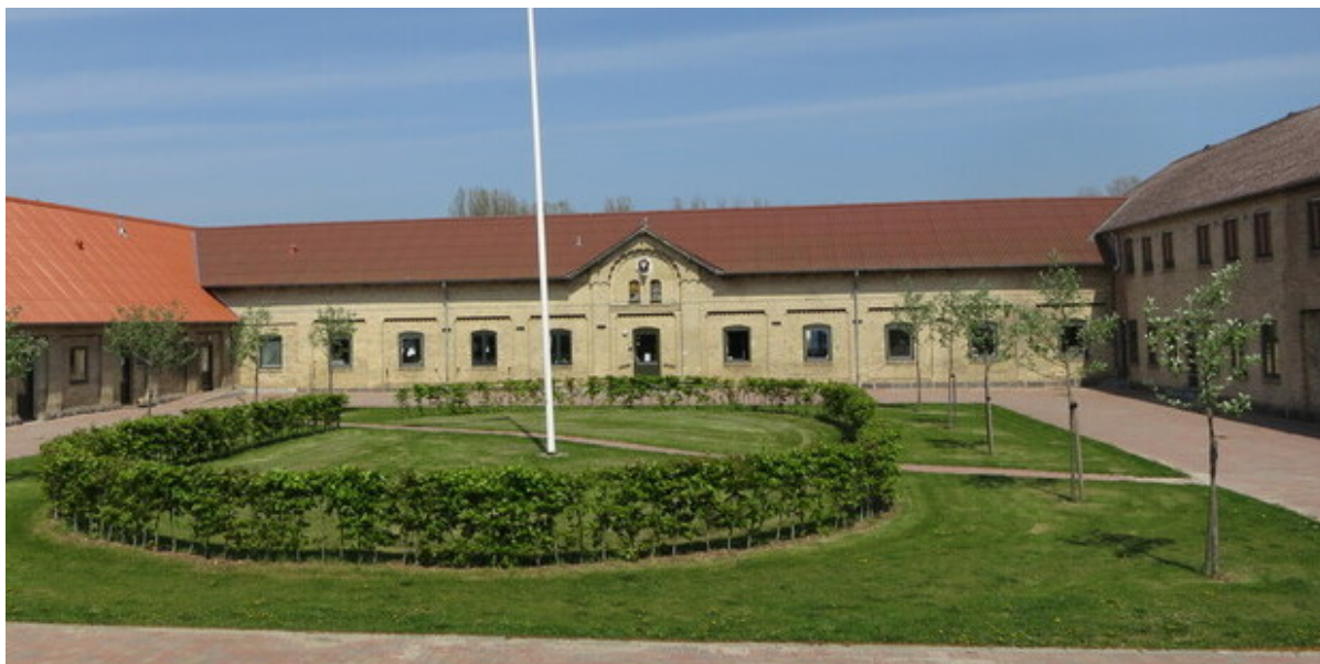
Gårdspladsen på højjergaard.