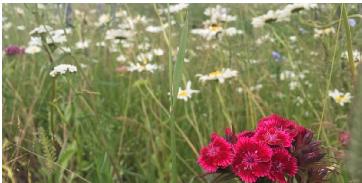
Vilde blomster i vejgrøft i Vinge.