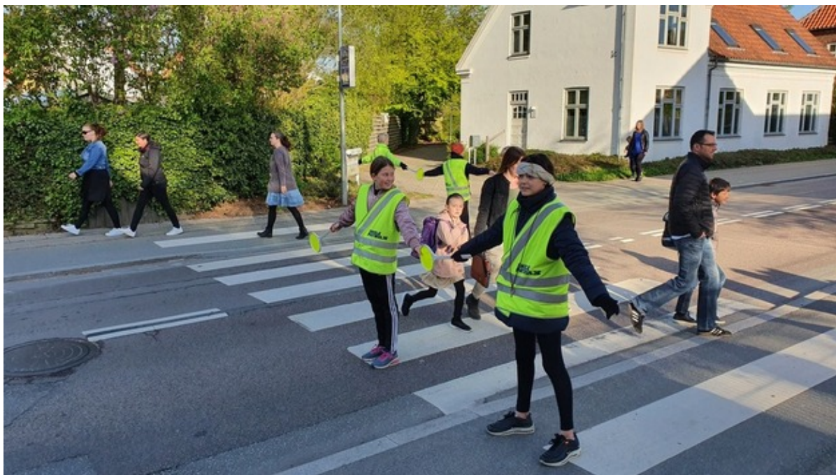
Skolepatruljen sikrer fodgængernes sikkerhed, når de krydser vejen.