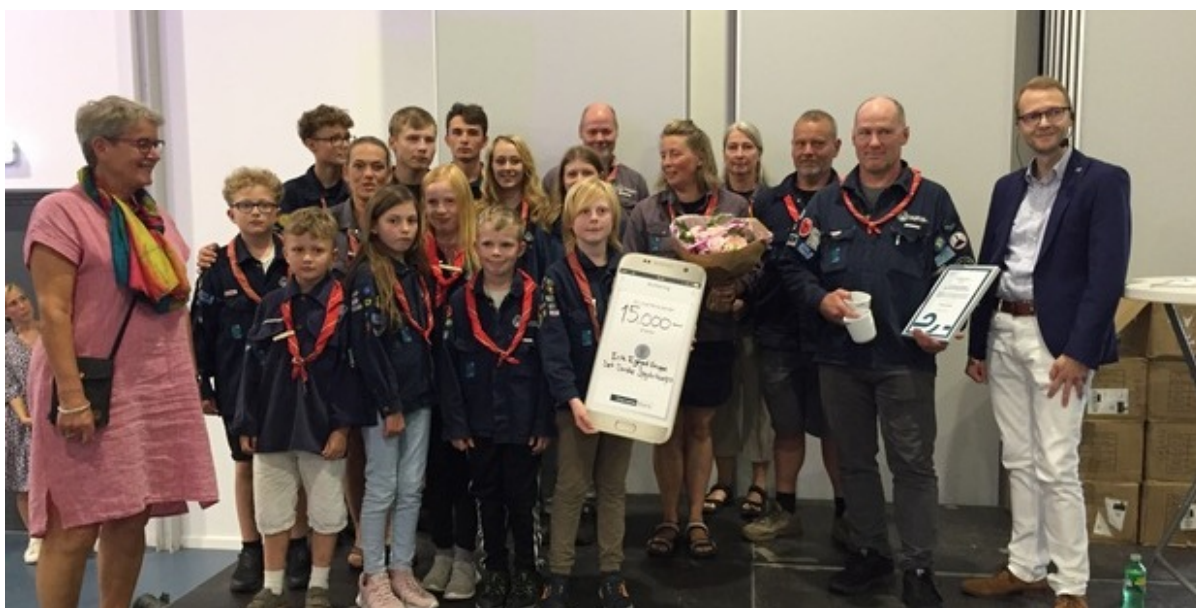
Erik Ejegod gruppe, det danske spejderkorps modtog årets Fritidspris.

Slangerup Idræts- og Kulturcenter dannede søndag den 28. august rammen om prisfesten for idrætten og foreningslivet. Som noget nyt kunne man i år – foruden at overvære prisuddelingen – prøve kræfter med en række forskellige sportsgrene.