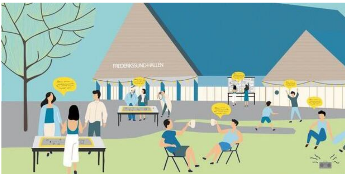
Illustration af borgere, der deltager i workshop, Frederikssund Kommune.