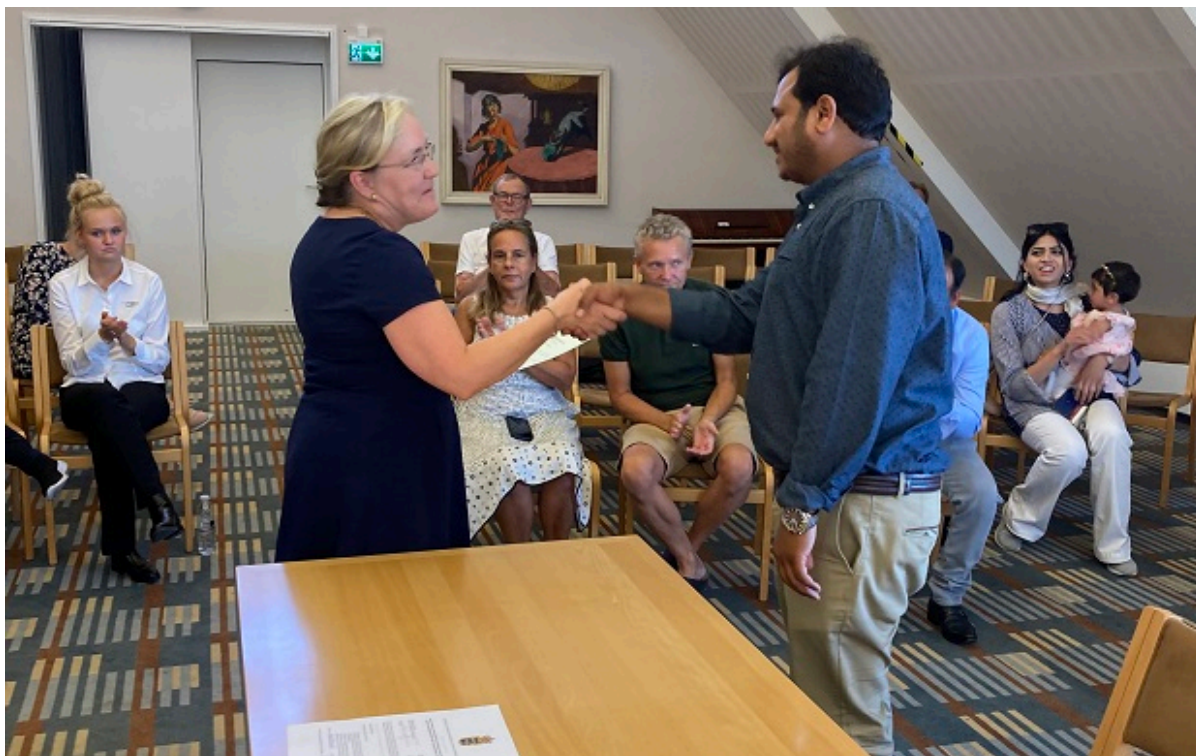
Mand trykker borgmesteren i hånden ved grundlovsceremoni.