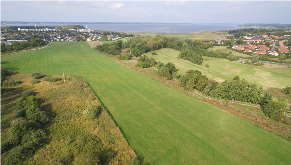
Græse Ådal med fjorden i baggrunden.