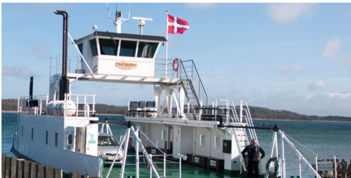
Færgen Columbus i Kulhuse Havn.

Færgen M/F Columbus, der sejler mellem Kulhuse og Sølager, kan i år fejre 75-års fødselsdag. Det bliver markeret med en fejring på havnen i Kulhuse fredag den 23. september.