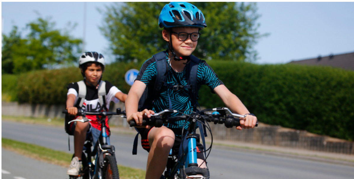
Drenge på cykel.

Frederikssund Kommune vil gerne have så mange børn som muligt til at cykle til skole. Derfor er vi med i Cyklistforbundets kampagne Alle Børn Cykler, og i år er der også lokale præmier på højkant til dem, der har flest cykeldage.