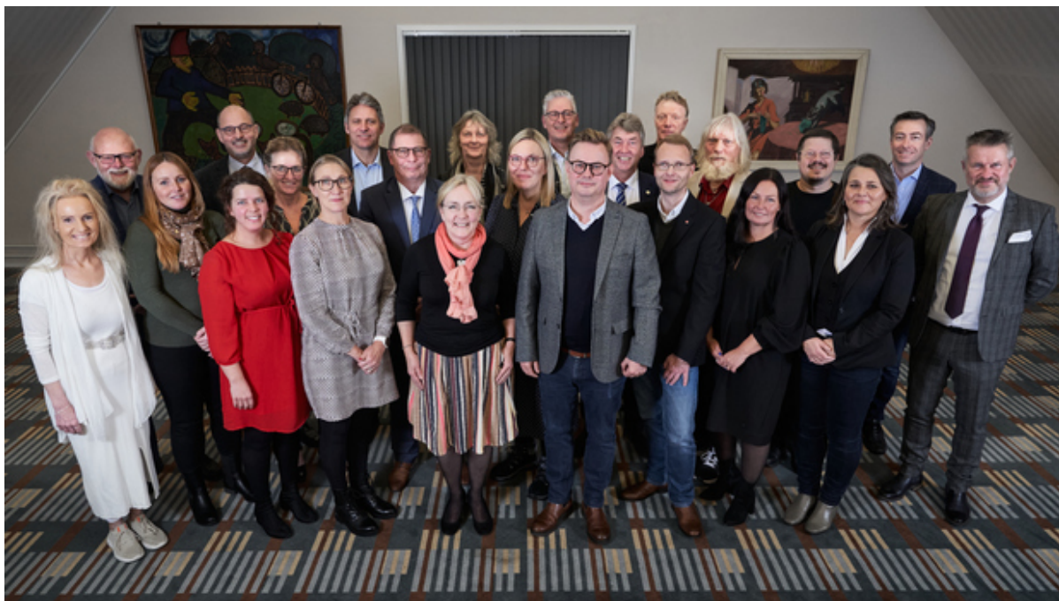
Gruppefoto af de 23 medlemmer af Frederikssund Byråd 2022 - 2025.

Efter de konstituerende møder i de stående fagudvalg under Byrådet er der nu sat navne på udvalgenes nye formænd og næstformænd.