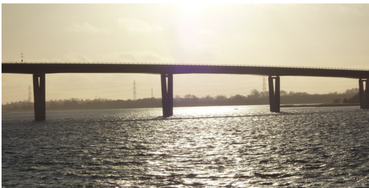
Kronprinsesse Marys Bro.

Efter at Kronprinsesse Marys Bro blev gratis at benytte ved årsskiftet, skal Vejdirektoratet nedtage skiltningen om betalingsvej, som er opsat over Fjordlandsvej. Det betyder delvise spærringer af broen fra den 17. – 21. januar.