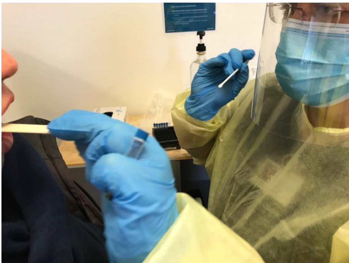
Hænder iført handsker holder coronatest og pødepind.