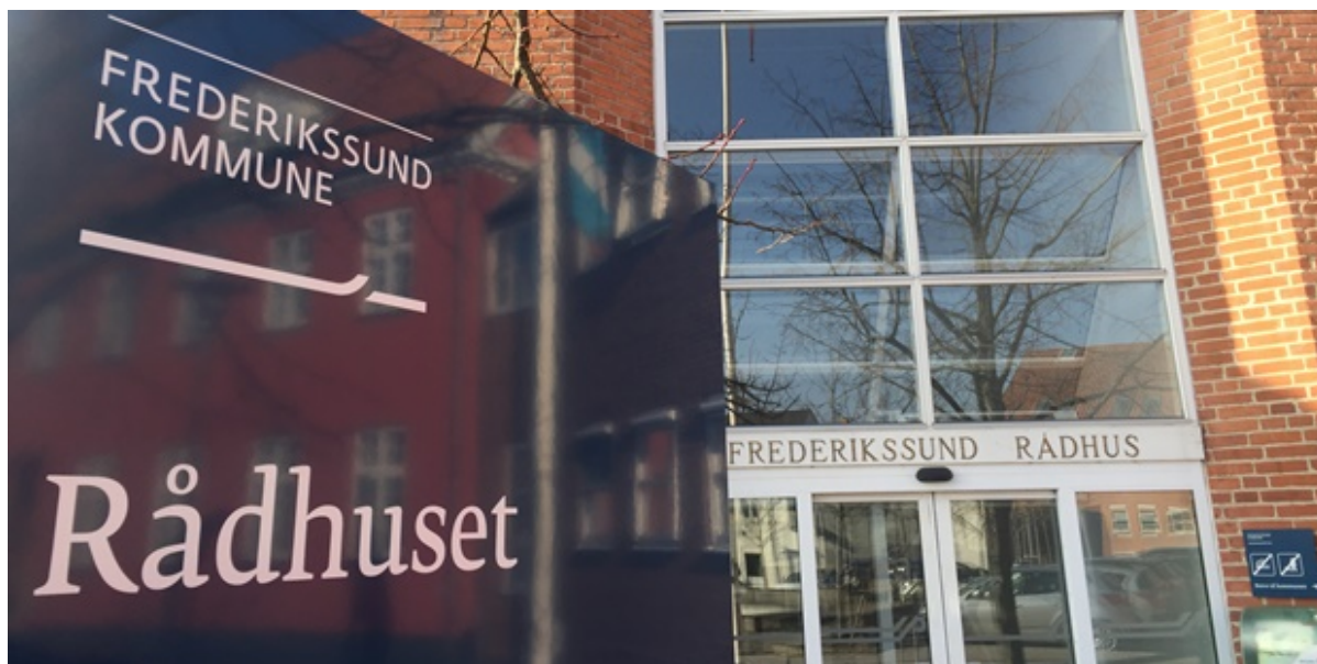
Rådhusets hovedindgang.