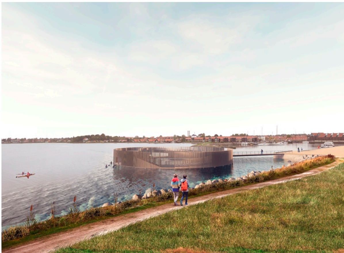
Illustration af hvordan Kultur- og Havnebadet kommer til at se ud. Illustration: Christensen og Co.

Byrådet har godkendt Per Aarsleff A/S som totalentreprenør til Kultur- og Havnebadet. Det forventes, at Kultur- og Havnebadet vil stå færdigt i forsommeren 2023.