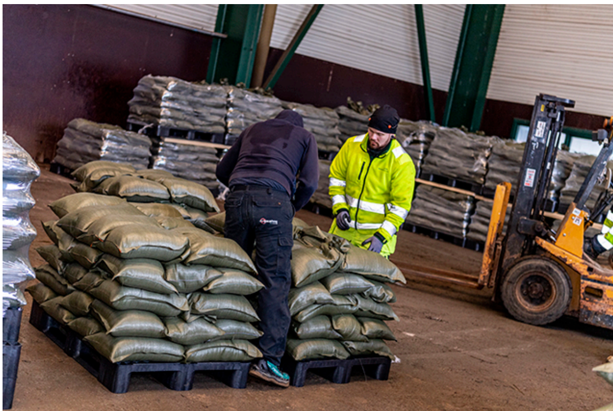
Lageret af sandsække vokser dag for dag.

Stormen Malik drænede Frederikssund Kommunes lager af sandsække. Derfor er vi nu i gang med at fylde lageret med endnu flere sandsække end før.