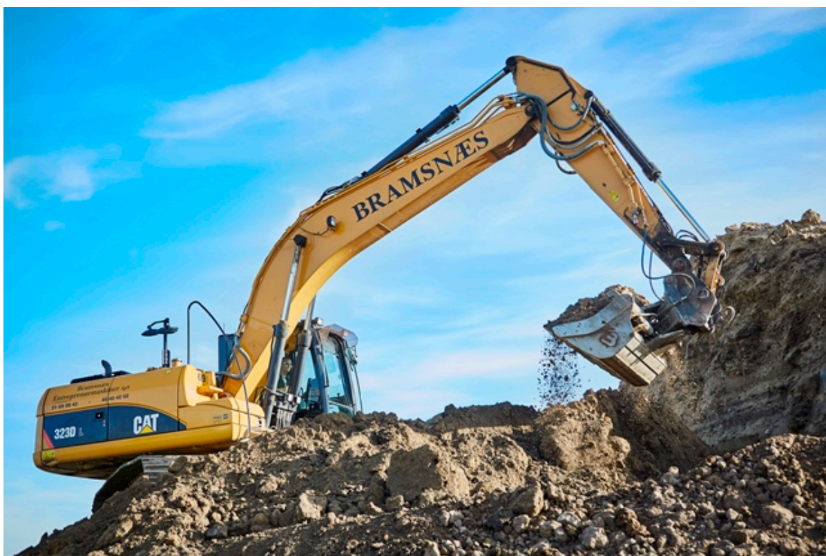
Gravemaskine graver i jorden.

Dansk Industris måling af Frederikssund Kommunes erhvervsvenlighed er ikke tilfredsstillende læsning. Der er plads til forbedring, selv om undersøgelsen også rummer gode takter.