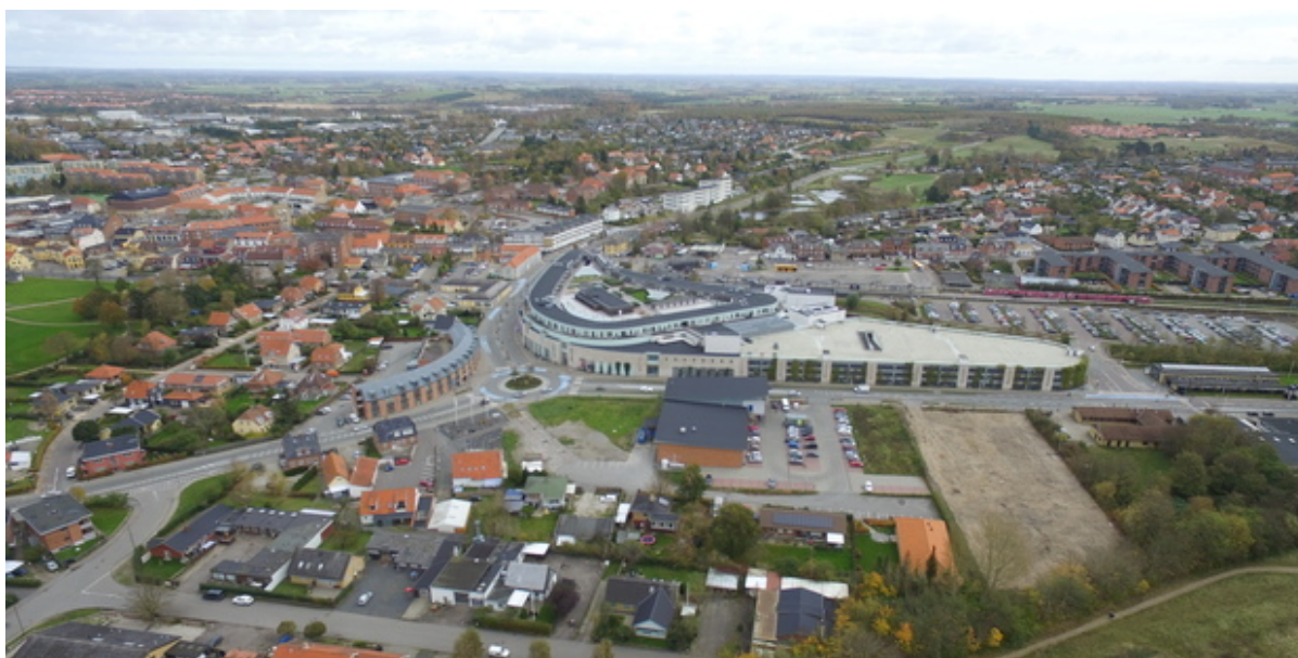
Frederikssund bymidte set fra luften.

En gruppe studerende i landskabsarkitektur ved Københavns Universitet har i længere tid arbejdet med nye byrum for Frederikssund bymidte. Resultatet af deres anstrengelser skal nu vises frem ved en udstilling i Jernbanegade i Frederikssund den 19. januar.