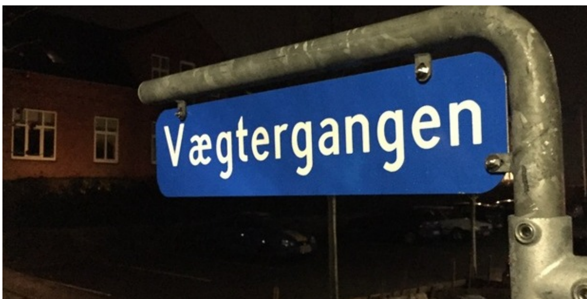
Det nye skilt med vejnavnet Vægtergangen.

Onsdag den 4. januar fik Slangerup Vægterkorps et længe næret ønske opfyldt. Et vejstykke ved Slangerup Administrationscenter blev navngivet Vægtergangen.