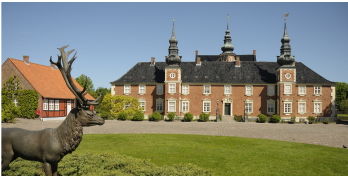
Jægerspris Slot. Foto: Frederikssund Kommune, Kenneth Jensen.