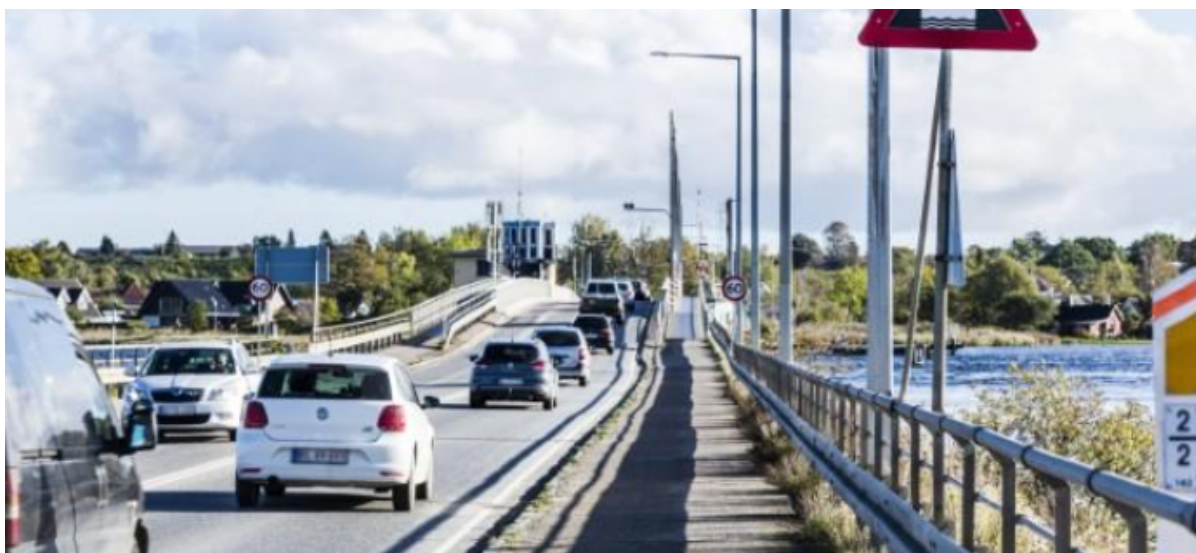
Biltrafik på Kronprins Frederiks Bro.