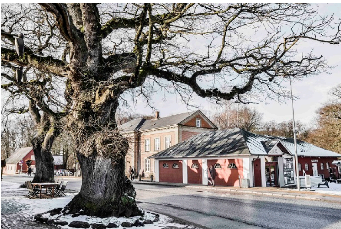
Rejsestalden i vinterlandskab.

Fra 1. januar har Frederikssund Bibliotekerne overtaget drifts- og personaleansvaret for Rejsestalden, der fortsætter som et selvstændigt kulturhus med en ny tovholder.