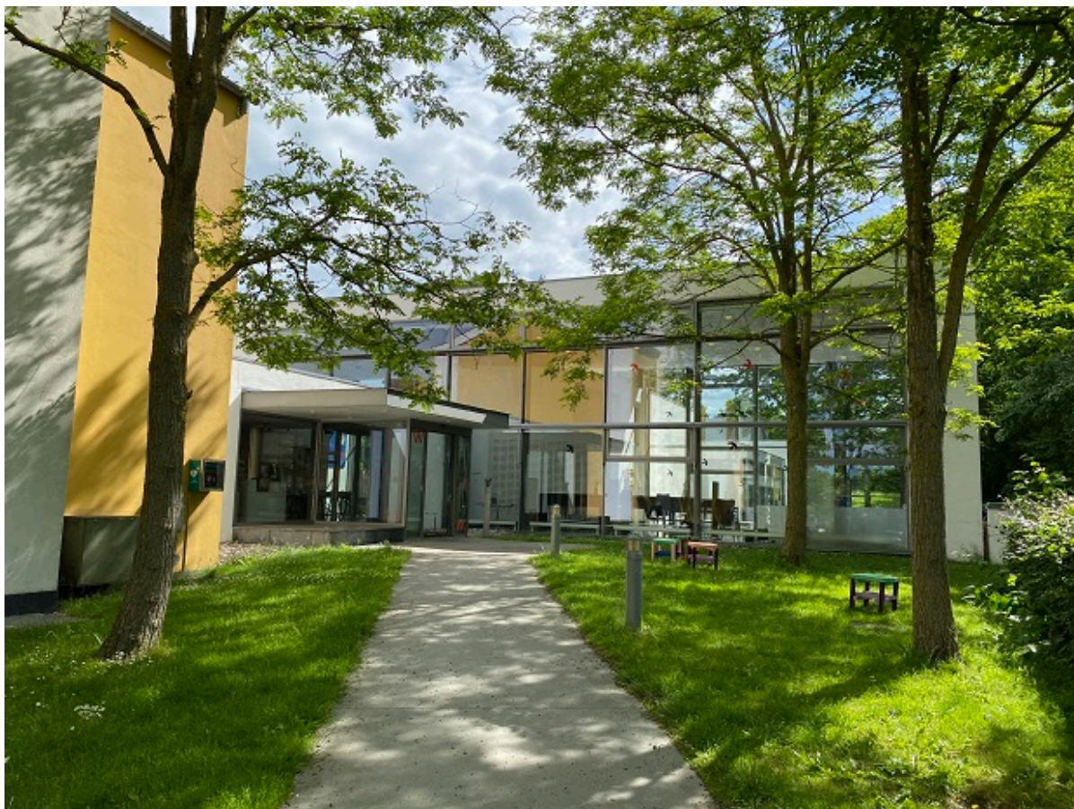
Det nuværende indgangsparti bliver lukket af og området bliver gjort til udendørsservering for den nye café.