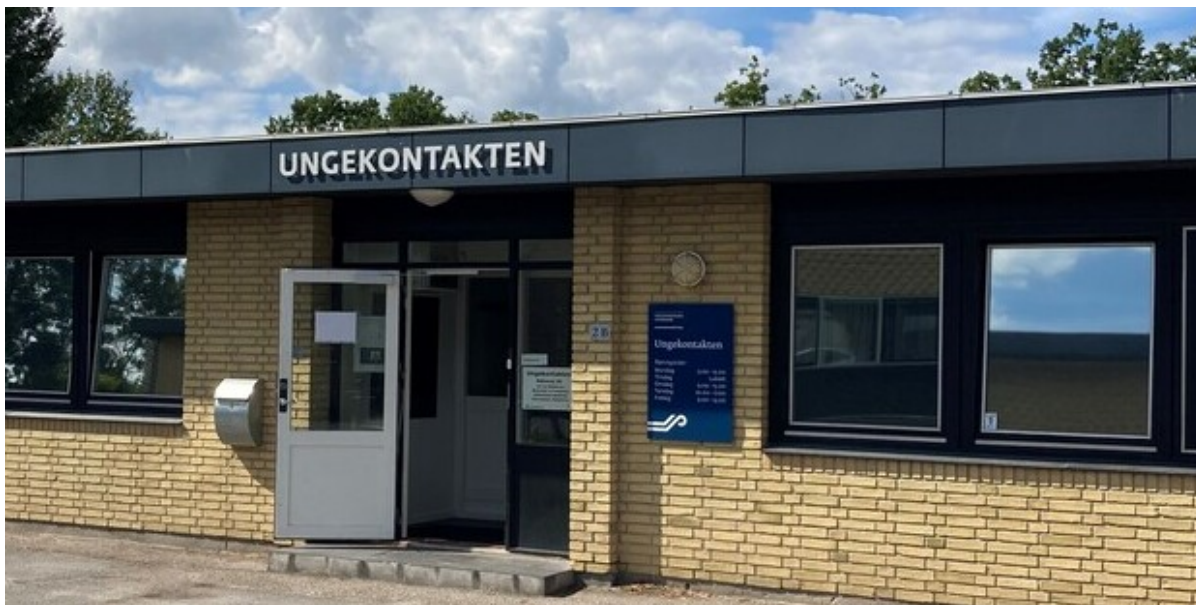
Ungekontaktens indgang.