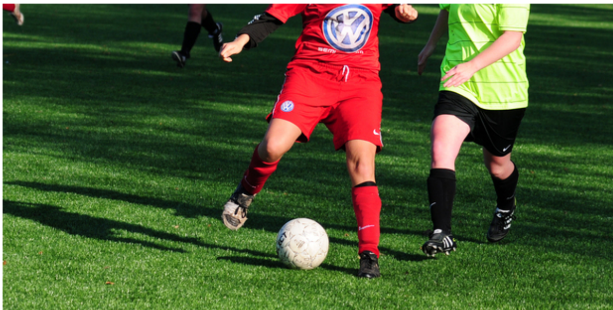
Fodboldspillere dribler med bold.