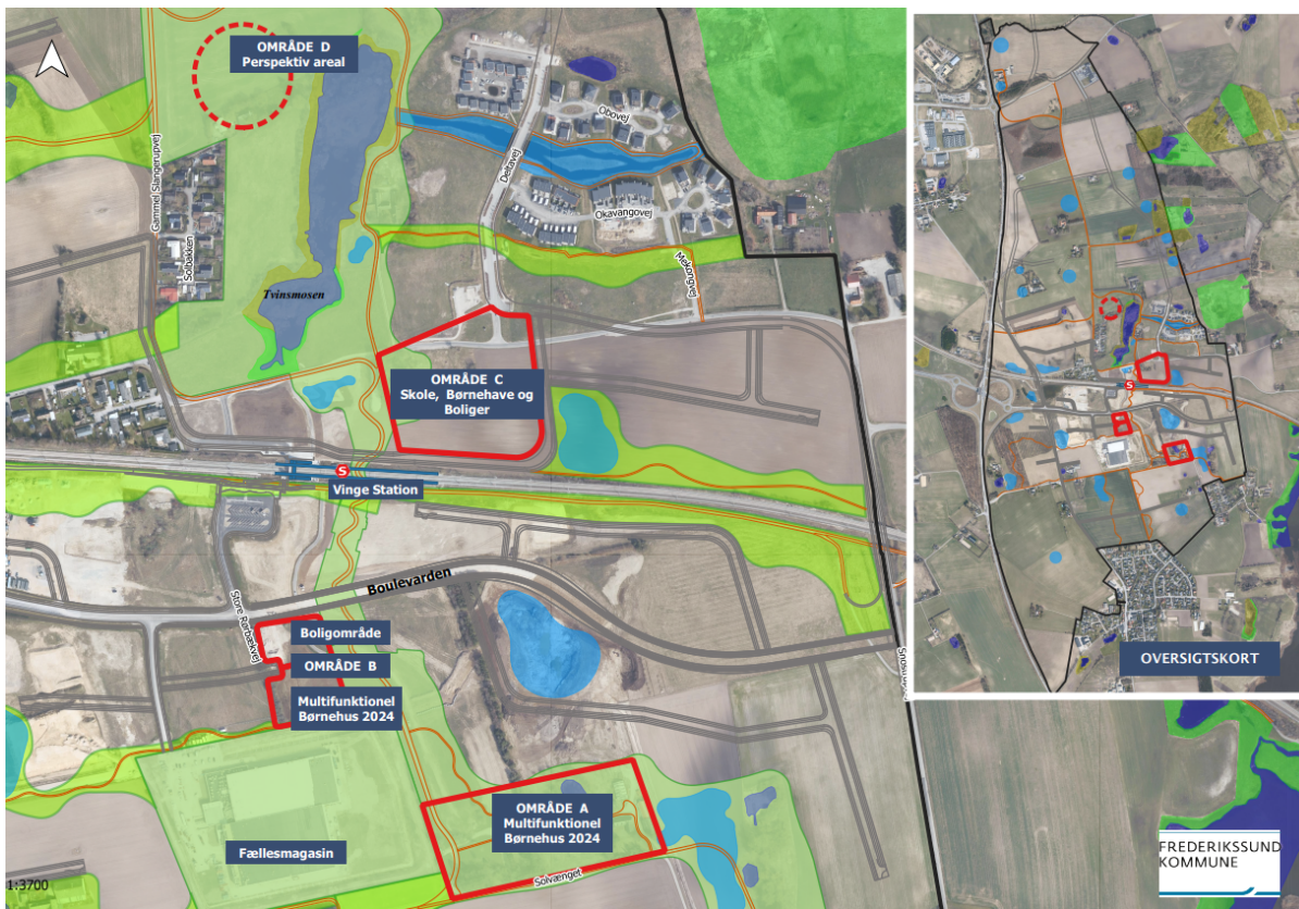
Illustration med mulige placeringer af et børnehus i Vinge. Grafik: Frederikssund Kommune.