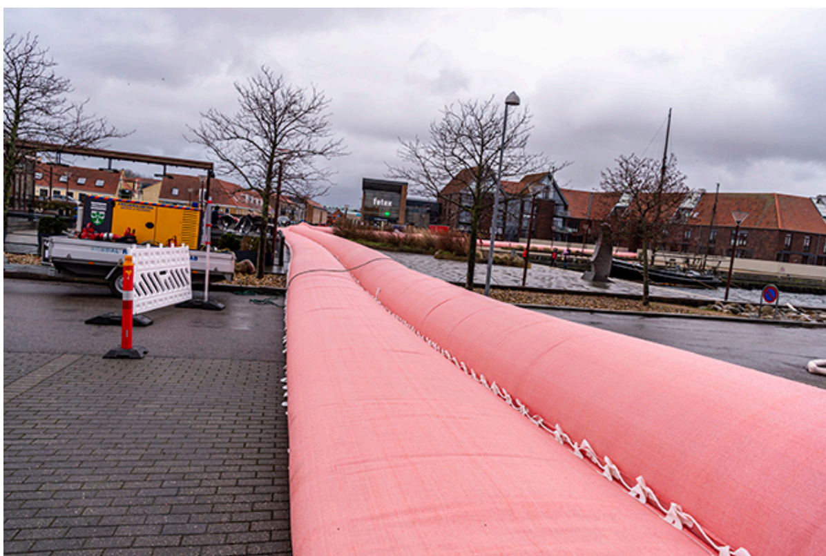
Watertubes på havnen i Frederikssund.

Både på havnen i Frederikssund og på Strandvej oplever vi udfordringer med utætheder i et par watertubes. Beredskabet er på opgaven.