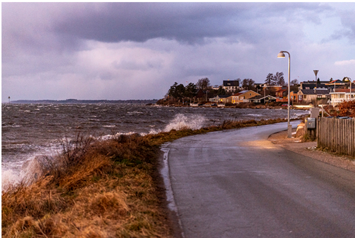
Strandvej med vandet piskende ind over.