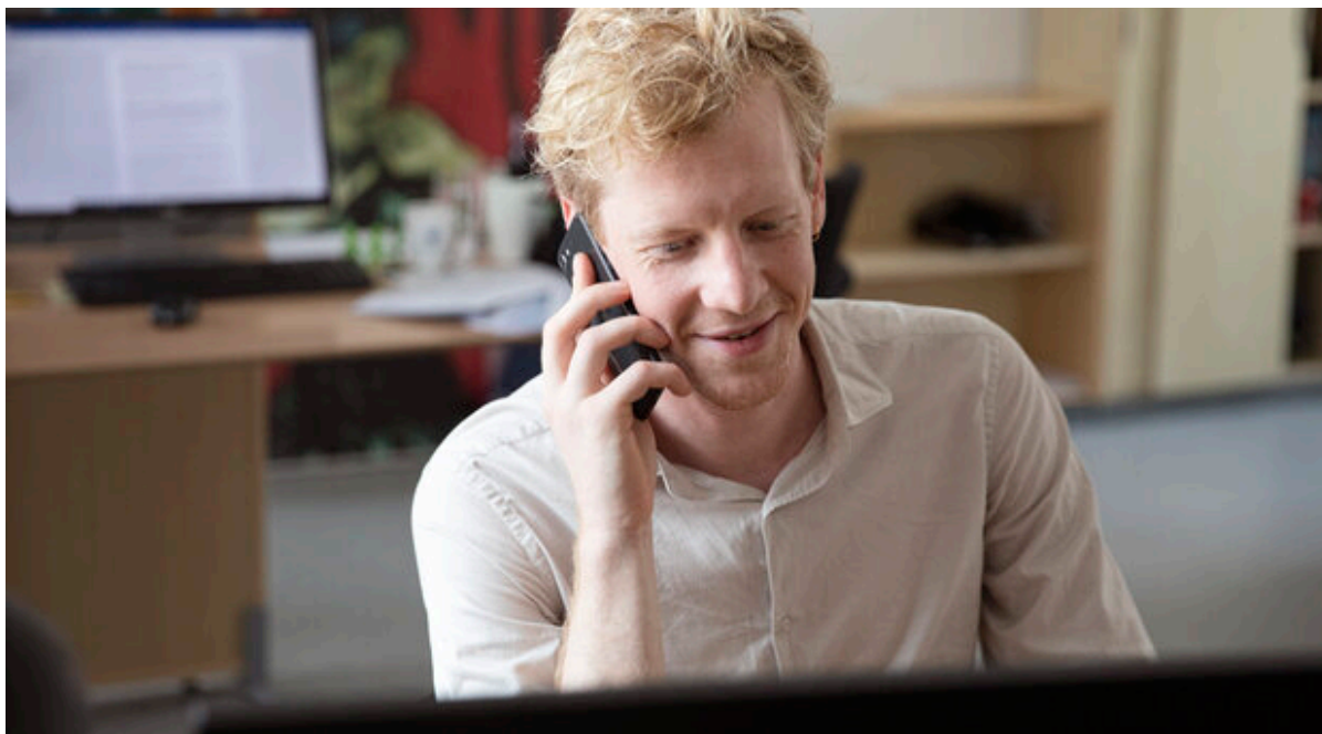
Medarbejder på kontor taler i telefon.