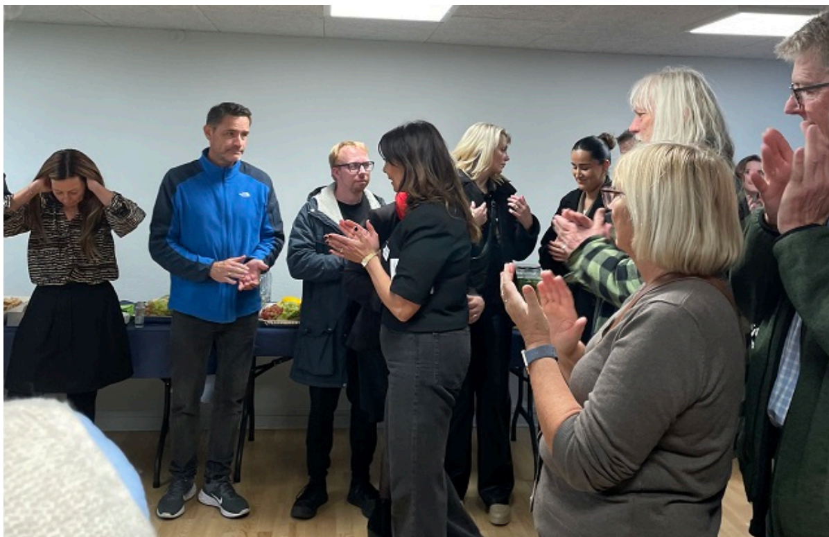
Mennesker klapper efter en tale ved åbningen af YoungMind.

Den 1. november blev Frederikssund Kommunes nye rådgivnings- og behandlingstilbud, YoungMind, officielt åbnet med en velbesøgt reception i lokalerne på Odinsvej 4B i Frederikssund.