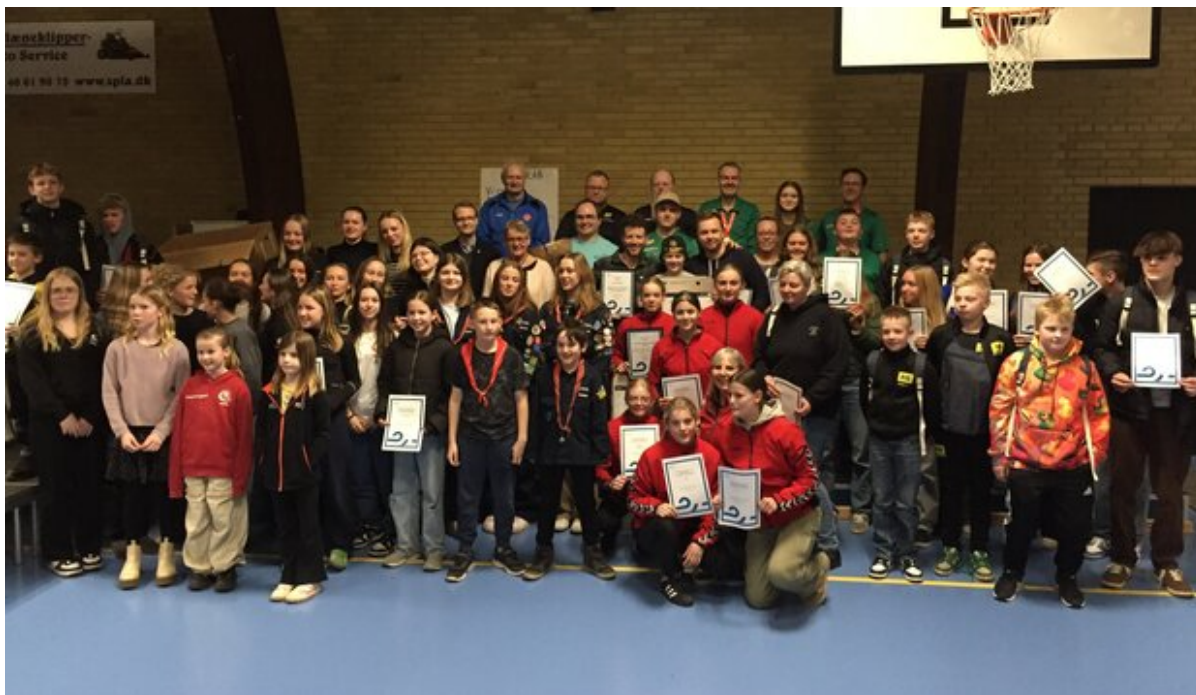
Modtagere af anerkendelser i 2024.