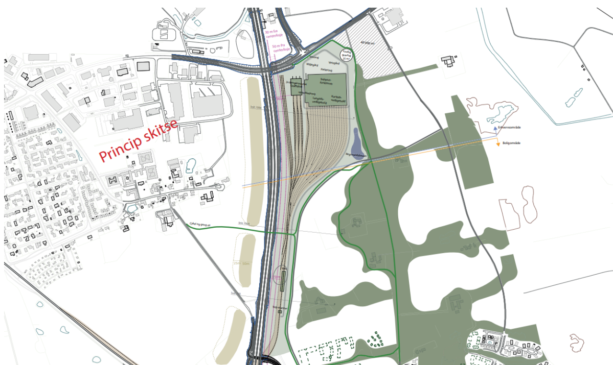
Skitse over et muligt kommende DSB-værksted i Vinges erhvervsområde.

Frederikssund Kommune er i gang med at udarbejde ny lokalplan og kommuneplantillæg, der skal muliggøre et S-togsværksted i Vinge. I den forbindelse holdes der et infomøde tirsdag 10. december kl. 19.00-21.00 i Kantinen på Ådalens Skole.