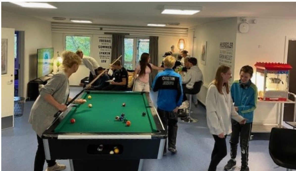
Unge i gang med aktiviteter ved genåbningen den 4. november.