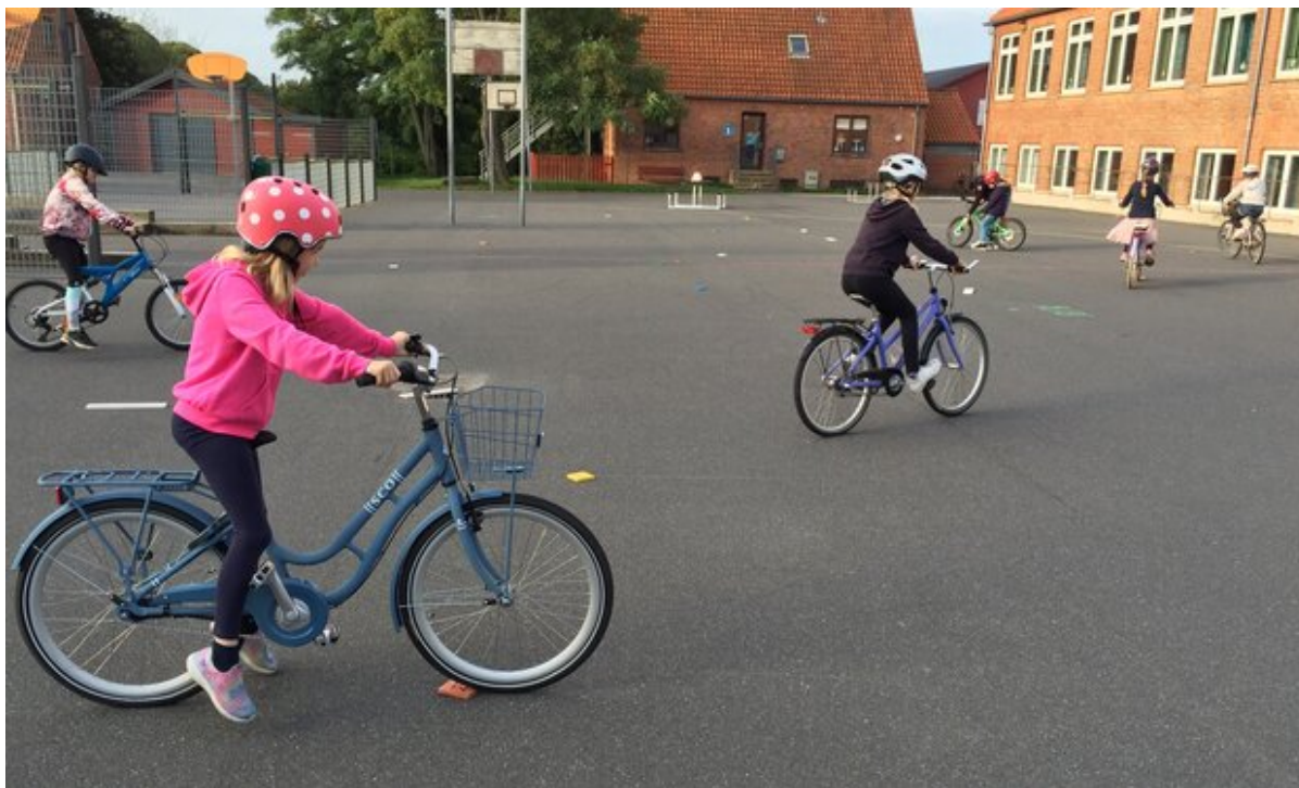
Cyklistprøve på Fjordlandsskolen afd. Dalby i 2021.

Rådet for Sikker Trafik har netop afsluttet årets skoletrafikttest. Resultatet viser, at Frederikssund Kommune er den fjerde bedste i landet, når det gælder arbejdet med trafikundervisning og trafiksikkerhed blandt børn og unge.