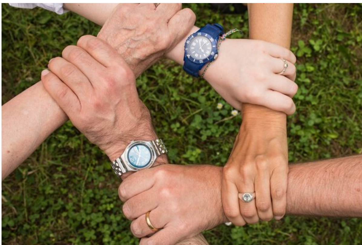
Fem hænder holder om hinandens håndled

Nu kan foreninger og institutioner søge Frederikssund Kommunes venskabsbypulje til international udveksling. Der er ansøgningsfrist den 10. januar.