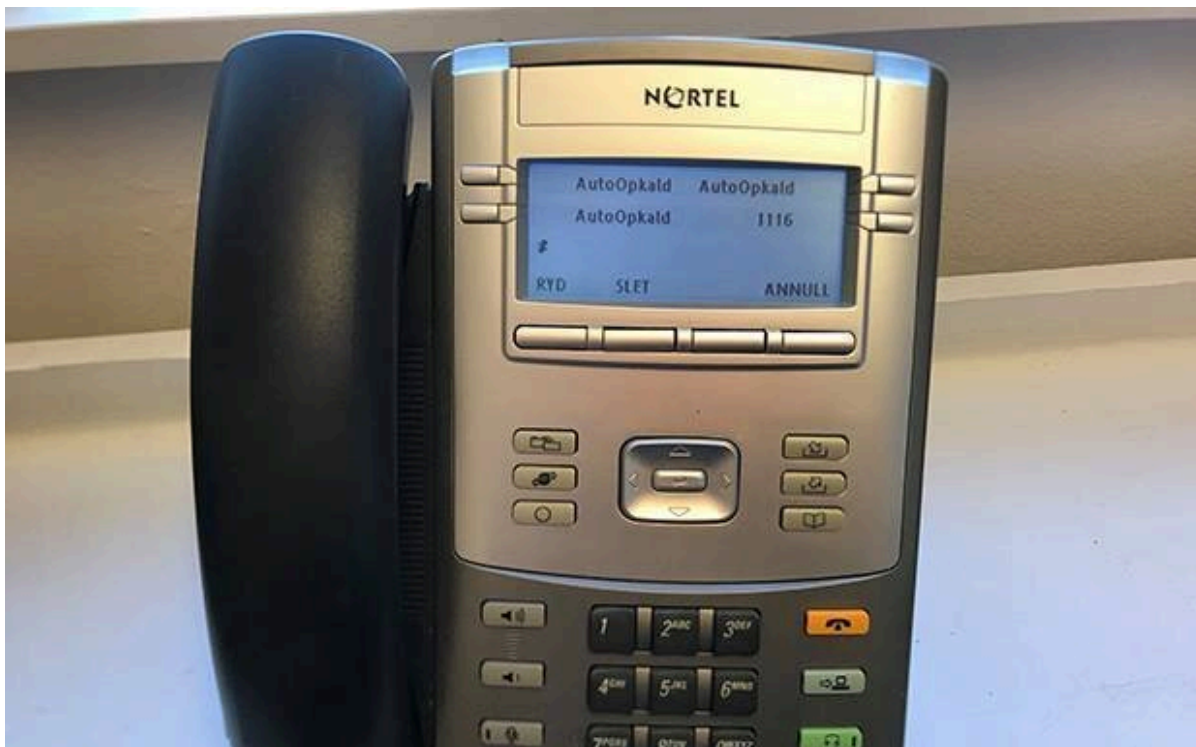
Telefon.