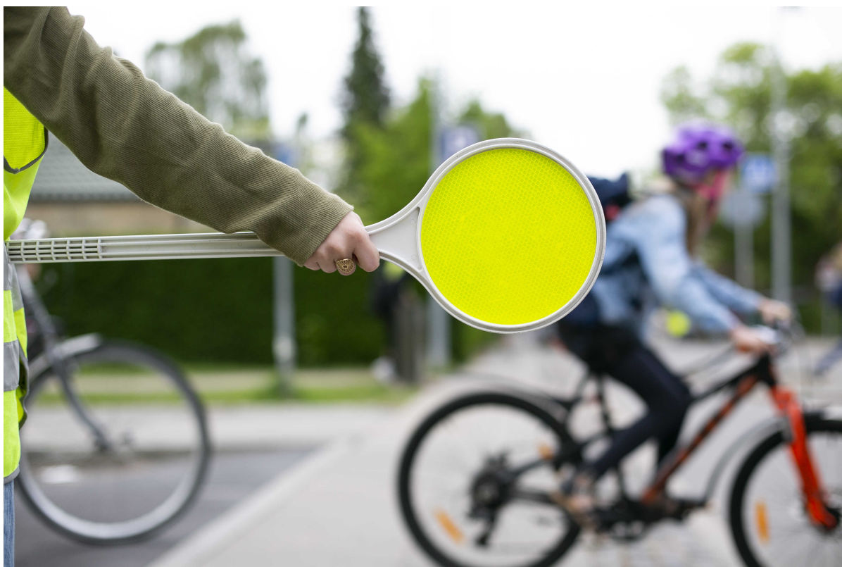
Skolepatrulje dirigerer trafikken.