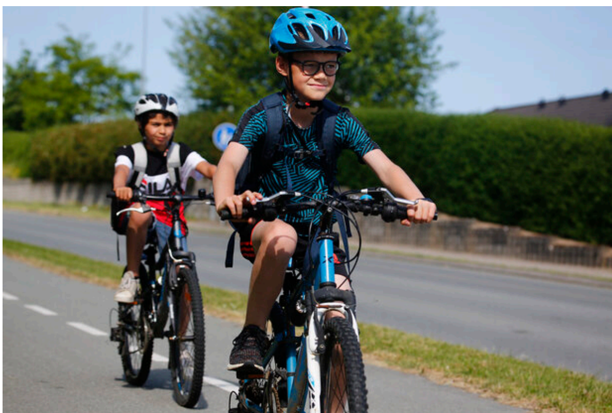
To drenge cykler på en cykelsti.

Frederikssund Kommune vil gerne have flest muligt børn til at cykle til skole. Derfor er kommunen med i Cyklistforbundets kampagne Alle Børn Cykler, og i år er der også lokale præmier på højkant til dem, der har flest cykeldage.