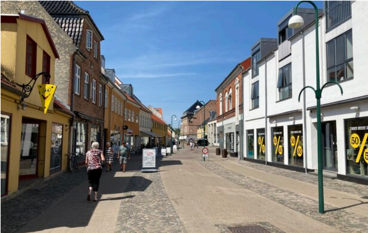
Jernbanegade i Frederikssund med butikker, gadeskilte og mennesker i gaden.

Fra den 2. september og året ud vil det være tilladt at cykle i Jernbanegade i Frederikssund hele døgnet. Forsøgsordningen skal vise, om der skal anlægges en permanent cykelrute gennem gågaden.