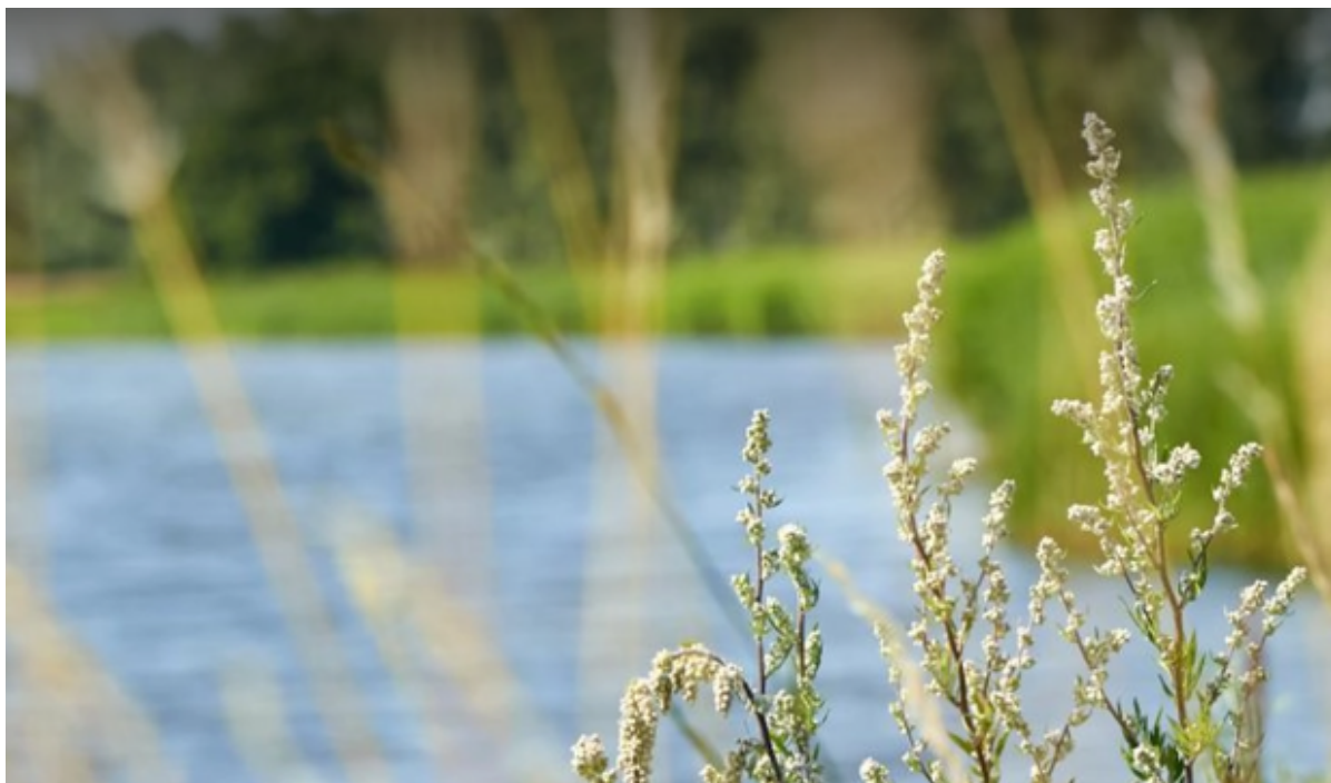
En fjord med siv i forgrunden.