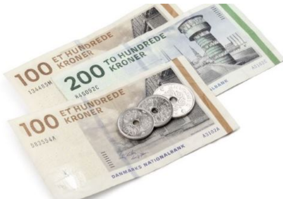
Danske sedler og mønter.

Kom til borgermøde om budget 2025 torsdag 5. september kl. 19.00 - 21.30. Her kan du høre om det kommende budget og indgå i dialog med politikerne.