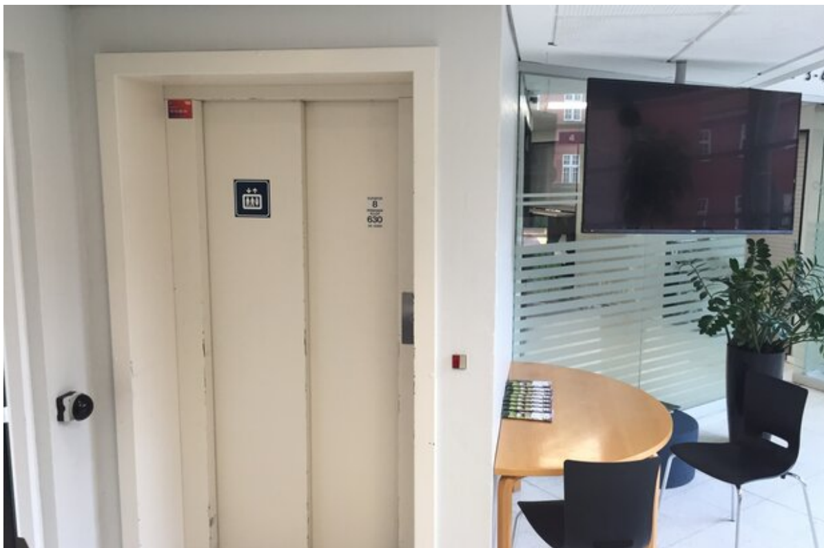
Rådhusets elevator i forhallen.

Elevatoren på rådhuset i Frederikssund skal renoveres. Derfor vil det ikke være muligt at benytte elevatoren fra den 2. september og fire uger frem.