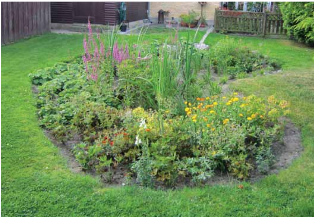
Fra et regnbed siver vandet langsomt ned i jorden.

vand på en lidt sjovere måde. Du kan anlægge et regnbed, hvor regnvandet kan samles og langsomt sive ned i jorden. I bedet kan du plante anderledes prydgæsser, stauder eller små buske, der både kan tåle at stå i vand og i perioder tørre ud.