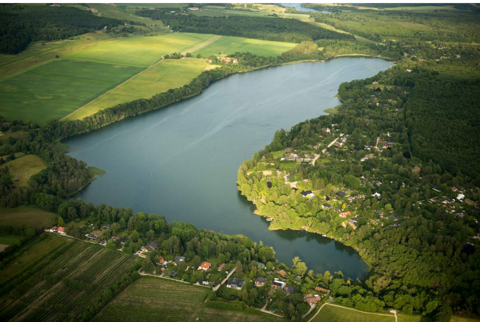
Foto: Buresø med Bastrup Sø i baggrunden (set fra vest mod øst), juni 2012.

Denne afgørelse, i form af en screening, er meddelt samtidig med offentliggørelse af udkastet til handleplanen, d. 18. oktober 2016.