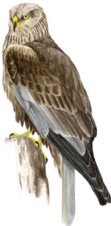
Rørhøg (han). Udpegningsart for Natura 2000-området.