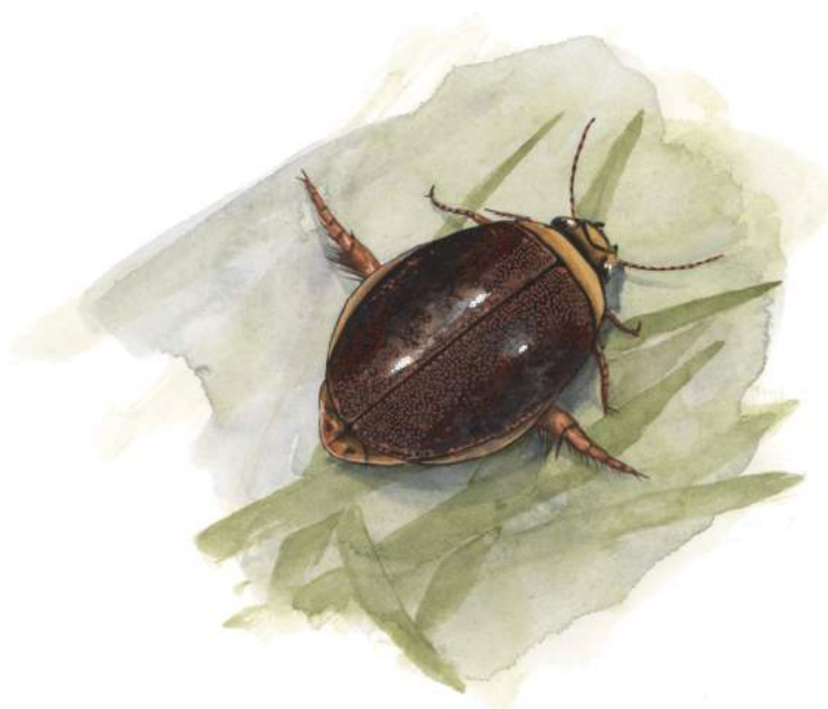
Lys skivevandkalv. Udpegningsart for Natura 2000-området.