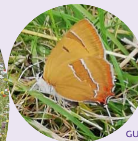
GULDBALE I GRÆSPLENE