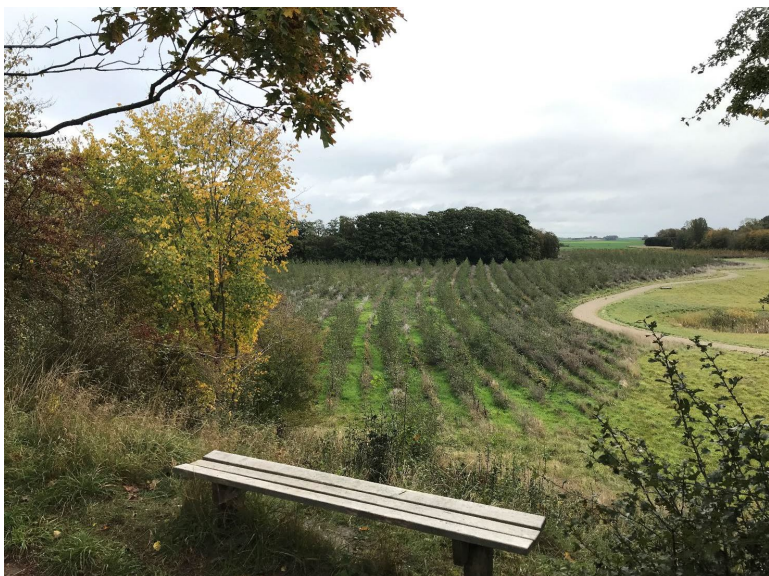
Nordmandsskoven ved Skibby blev plantet i 2018. I 2023 udvides skoven, så den bliver dobbelt så stor. Hørup Skov ved Slangerup udvides også løbende med nye arealer.