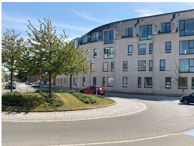
Nye lejligheder på Lærkevej 1 overfor Sillebrocenteret

Der bygges mange nye, moderne lejligheder i midten af Frederikssund. I 2023 og 2024 flytter nye beboere ind i store boligprojekter på Kirkegade, Kocksvej og Græse Strandvej. I 2022 blev der blandt andet flyttet ind i nye lejligheder på Lærkevej, Lundbjergvej, Kocksvej og A.C. Hansens Vej.