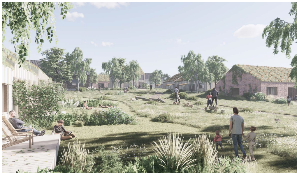
Illustration af klimarigtige boliger i Vinge udarbejdet af ADEPT for Ikano Bolig

Det er besluttet at bygge boliger i Vinge, der skal reducere klimabelastningen til en fjerdedel af det nuværende.