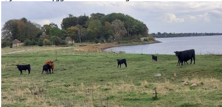
Kommunal naturpleje med kvæg ved Lille Rørbæk Enge i samarbejde med lodsejer og dyreholder.

Mange naturområders biodiversitet er afhængige af afgræsning f.eks. med kvæg. Lave lyskrævende planter og de insekter, der lever sammen med dem forsvinder, hvis græsset får lov at blive højt eller de skygges væk af træer og buske.