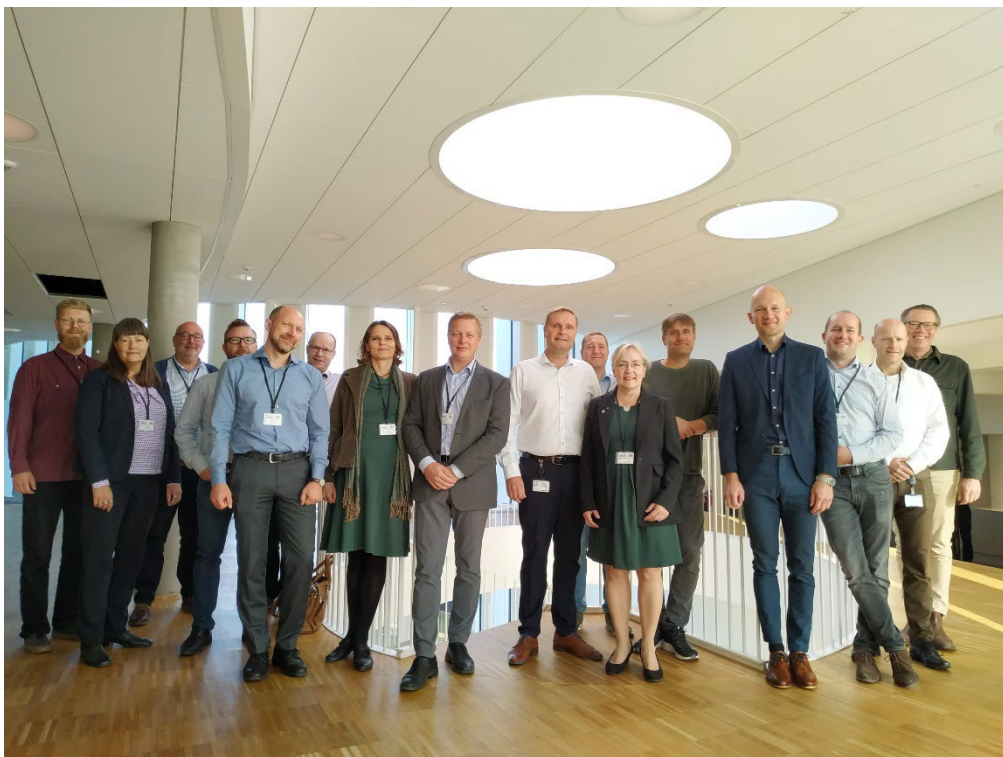
Energipartnerskabet er et samarbejde mellem virksomheder, forsyninger og kommunen. Foto fra møde på CO-RO i 2022.