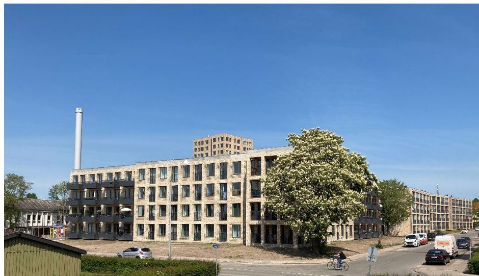
Det store kastanjetræ på hjørnet ved Kocksvej 28 er bevaret