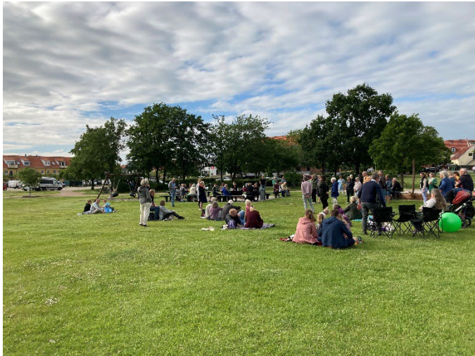
Kick-off-borgermøde om klimasikring af Frederikssund Bymidte