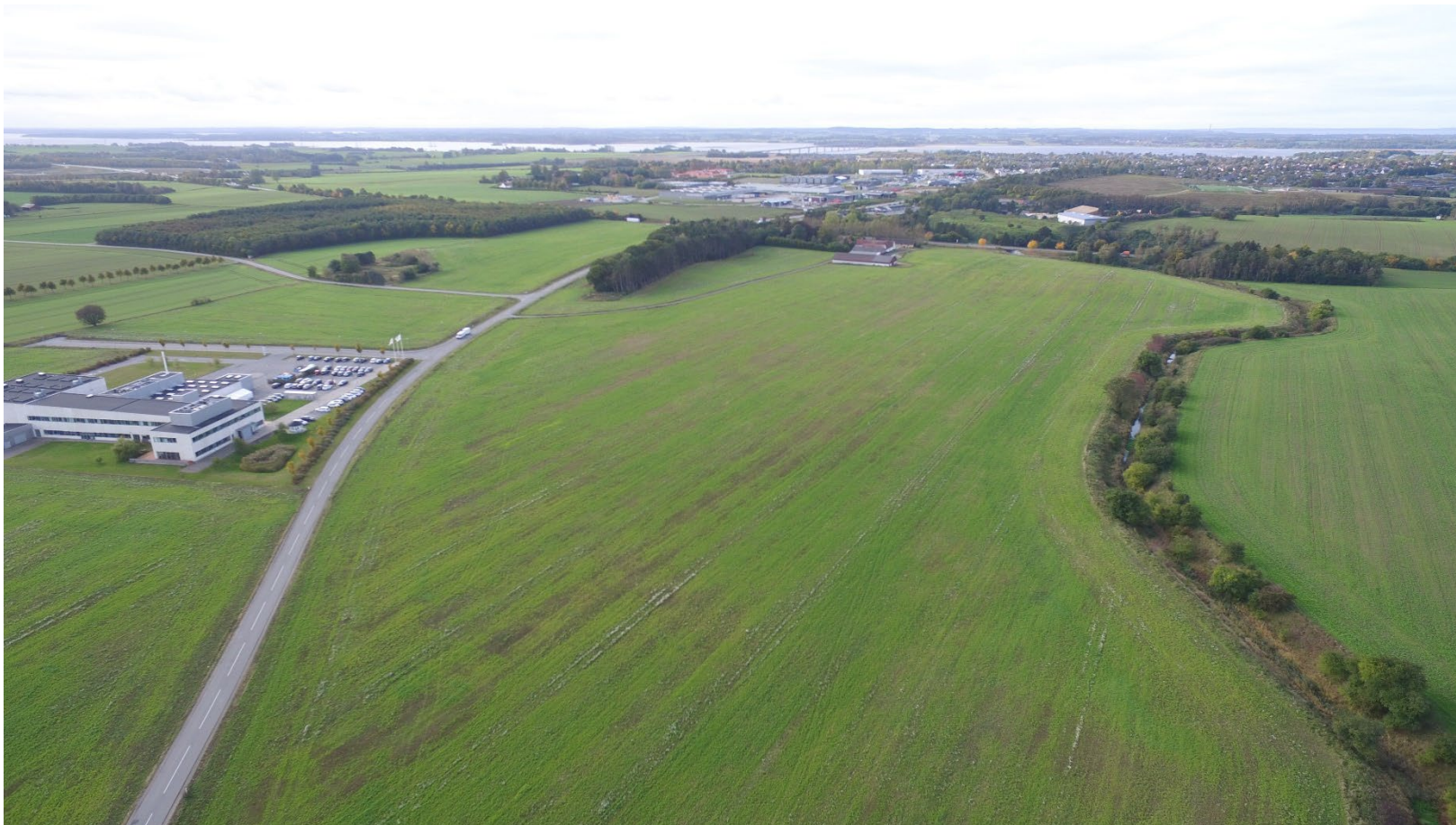
FOSS' byggegrund i midten af billedet er nabo til Topsil GlobalWafers A/S, som ses til venstre i billedet