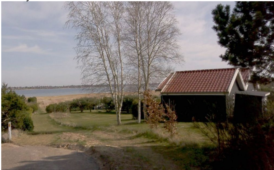
Sommerhusområdet Hyllingeriis beskyttes mod oversvømmelse fra Roskilde Fjord.

Sommerhusområdet Hyllingeriis har i samarbejde med kommunen udarbejdet et forslag til beskyttelse af området mod stormflod, som er sendt i høring i 2023. Flere lignende projekter, hvor kommunen hjælper borgerne i gang med at kystbeskytte deres ejendomme er under udarbejdelse.