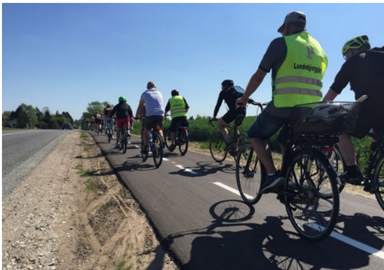
Kulhuscykelstien – her et billede af nogle af de mange cyklister, der deltog i indvielsen

I 2023 blev en ny cykelsti på 7 km mellem Kulhuse og Jægerspris indviet.