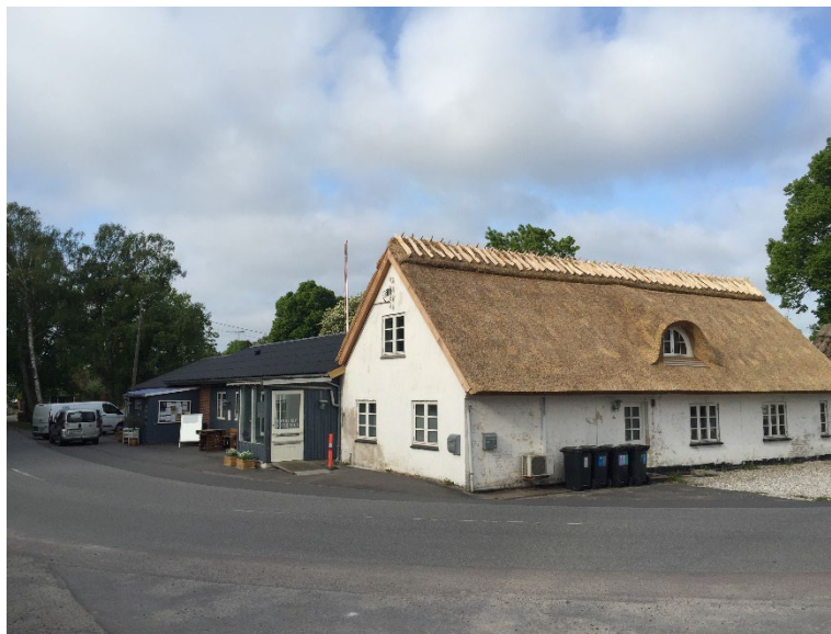
Sønderby Kultur- og bryghus

Borgere i Sønderby har sammen skabt et nyt kultur- og bryghus i en nedlagt butik. Der er skabt et nyt fællesskab i byen og samtidig er beboelsesdelen ført tilbage til sit originale udseende med stråtag.