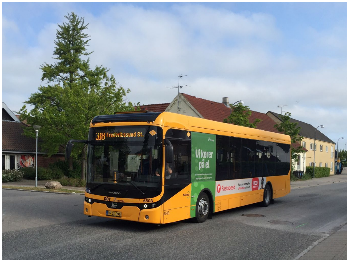
En af de nye elbusser kører på linje 318 fra Skibby gennem det østlige Hornsherred til Frederikssund

Frederikssund Kommune har indsat elbusser på 5 buslinjer. De nye elbusser er et vigtigt skridt i den grønne omstilling og giver samtidig bedre køreoplevelser for kunder, chauffør og omgivelserne, da de støjer mindre.