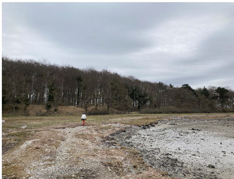
Havørnen yngler i skovområder ud til Roskilde Fjord og kan ofte ses svæve over fjorden

Roskilde Fjord er internationalt naturbeskyttelsesområde. Her skal tages vidtgående hensyn til naturen. Vi skal undgå at forstyrre fuglelivet på fjorden, på holmene og på kysterne, men det betyder også, at der er muligheder for store naturoplevelser. Fjorden er yngleområde for blandt andet klyde, fjordterne, havterne, sortspætte, hvepsevåge og havørn.