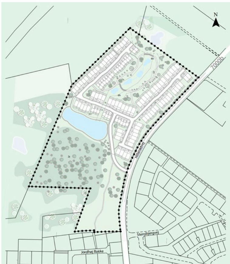
Visualisering af boligområdet ved Hillerødvej

I det kommende boligområde ved Hillerødvej i Slangerup ligger rækkehuse med små haver tæt omgivet af store fællesarealer med mødesteder for området beboere, stiforbindelser og beskyttet natur.