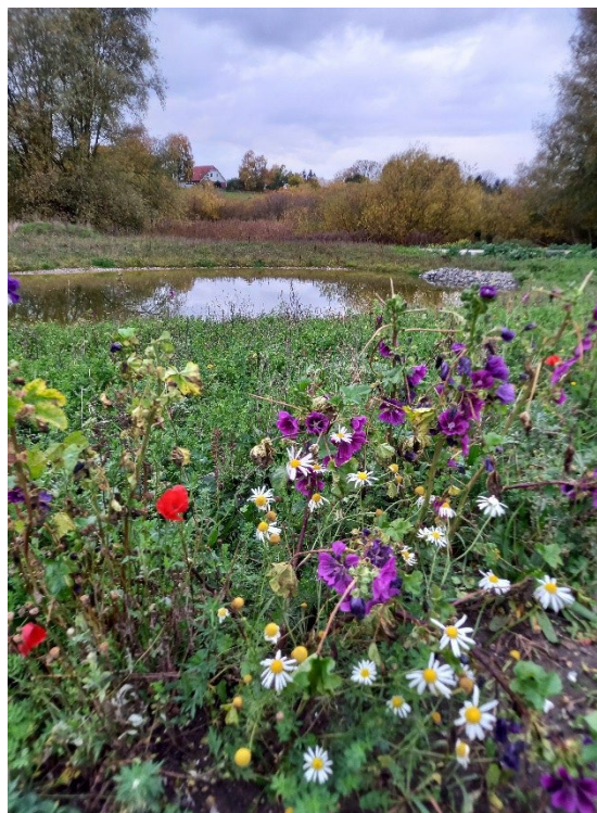
Nyt regnvandsbassin i Vinge.

Et regnvandsbassin er et teknisk anlæg, der skal rense og forsinke regnvand. Det kan godt se ud som en sø, så vandet og omgivelserne bliver en attraktion.