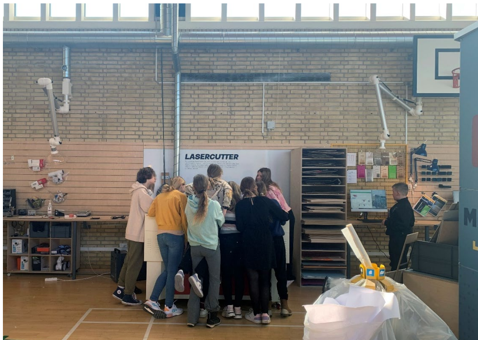
Makerværket råder blandt andet over laserskærer, 3D-printer og CNC-fræser.

I Frederikssund har vi succes med at tiltrække unge til erhvervsuddannelser. Én grund er Makerværket, som er et samarbejde mellem erhvervsliv, kommune og lokale erhvervsuddannelser. Makerværket er et eksperimentarium hvor vores børn og unge arbejder sammen med vores erhvervsliv om at skabe værdi på moderne teknologiske vilkår. Andre tiltag er virksomhedssafari, hvor de unge lærer lokale virksomheder at kende samt lokale arrangementer i kampagnen "Kloge hænder".