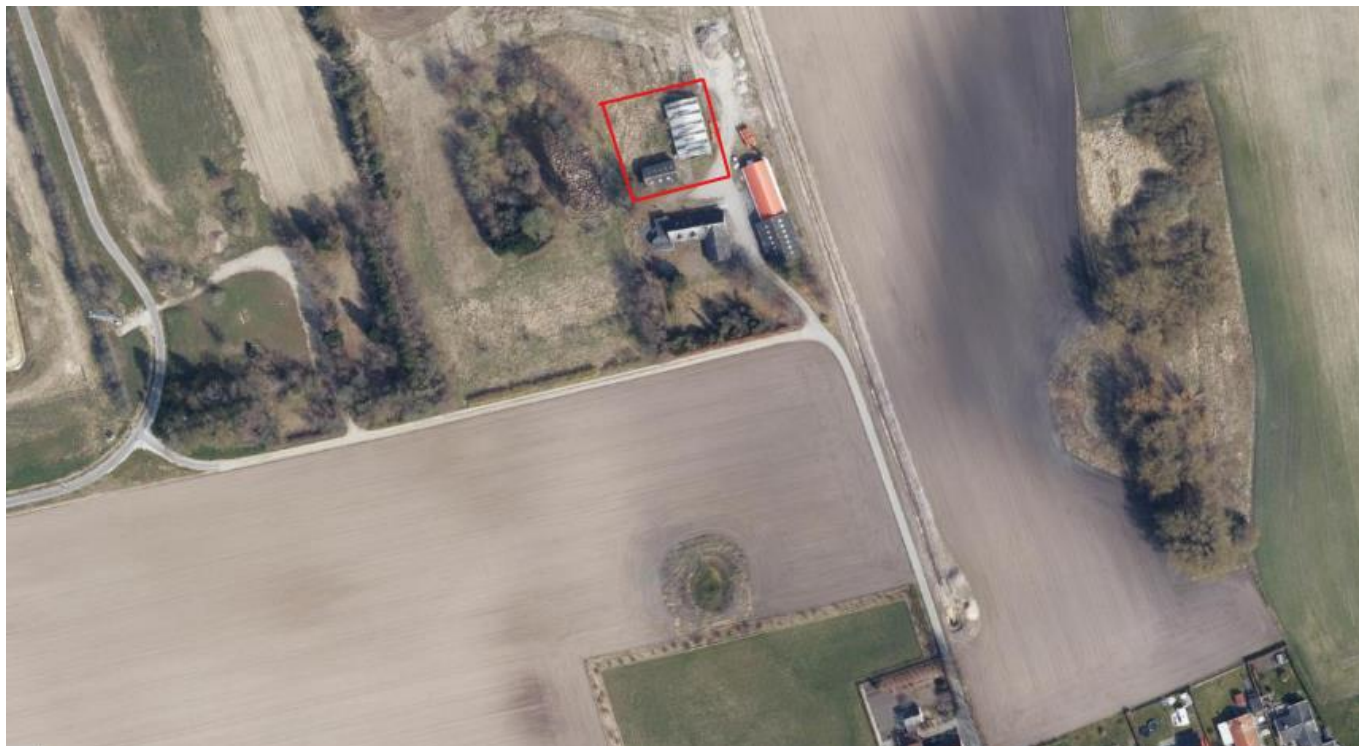
Figur 2 – Viser arealet som ønskes leje på Solvænget 29

Ejendommen er kommunalt ejet og har begrænset bygningsmæssig værdi. Hovedhuset er vandaliseret og der er ingen forsyningsledninger til ejendommen. Drivhuset er fra det tidligere gartneri og kan renoveres til et fællesskabende rum. De overflødiggjorte driftsbygninger kan fungere midlertidigt som supplerende funktion til projektet. Samlet set undersøges muligheden for en lejeaftale for drivhus, driftsbygning og et mindre areal omkring gårdsplads og haveanlæg som samlet er ca. 2.000 m 2 .