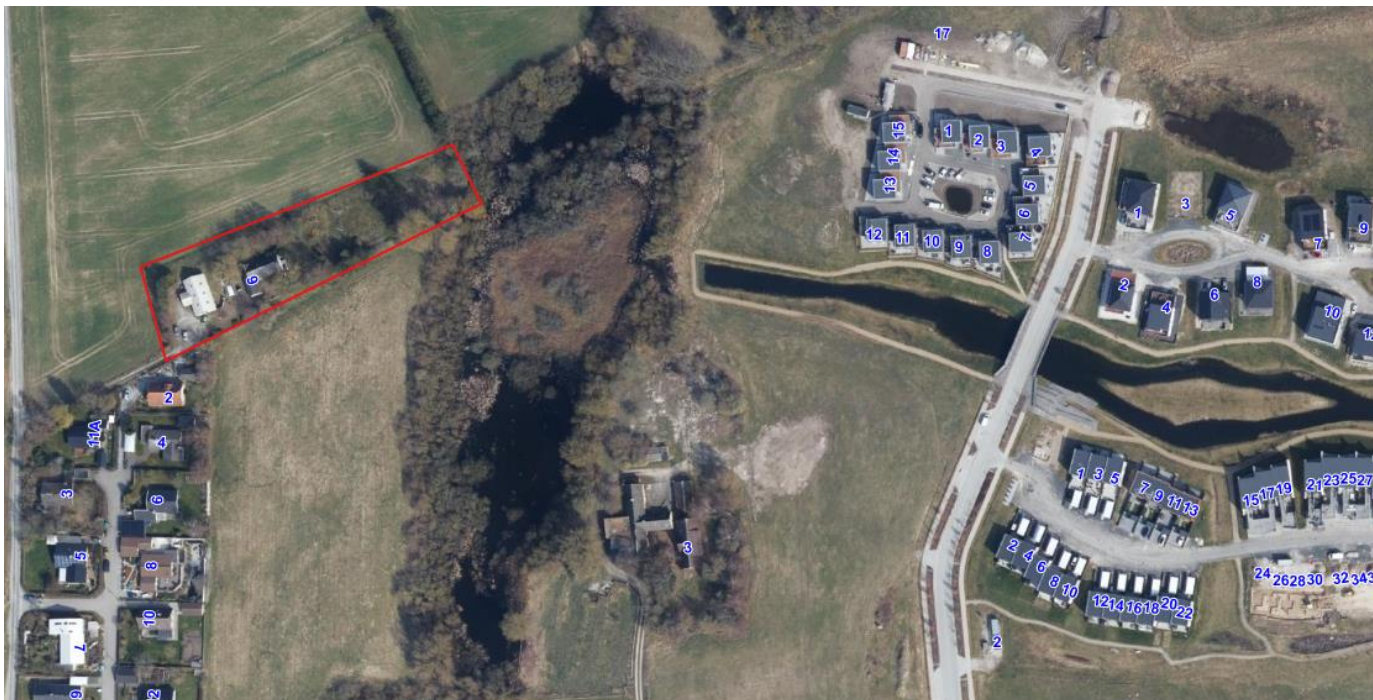
Figur 1 – viser arealet som ønskes lejet på Gl. Slangerupvej 9

Der ønskes en lejeaftale hvor hovedhuset og staldbygningen istandsættes og anvendes som fælleshus for området. Ligeledes ønskes haveanlægget aktiveret som "park" for byen og et mindre areal (ca. 500 m 2 ) aktiveres til små nyttehaver, for de kommende tilflyttere. Samlet set ønskes en midlertidig lejeaftale omhandlende bygningerne, haveanlægget + tilhørende jordstykke som samlet udgør ca. 5.000 m 2 . Der vil fortsat være forpagtning af jordarealerne mod nord til landbrugsdrift, indtil det Grønne Hjerte er yderligere aktiveret.