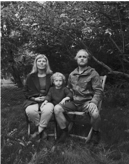
Familie, Samsø, Danmark (2021)