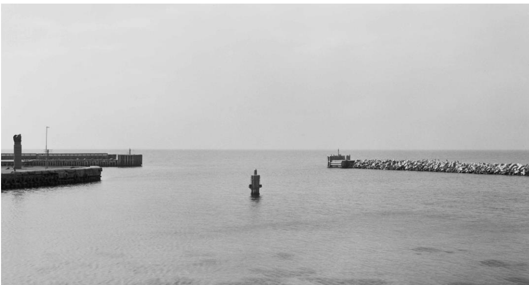
Samsø, Danmark (2021)