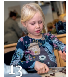
Layout og produktion: Bording Danmark A/S