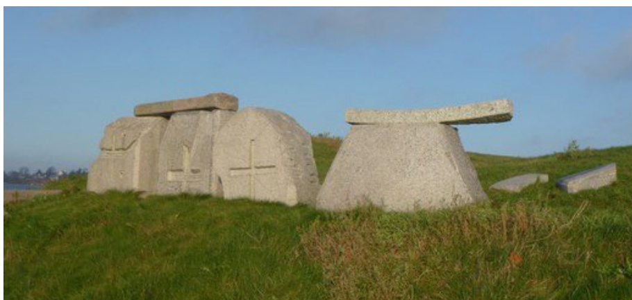
Joseph Salamons granitstensværk Et Fjordlandskab består af flere dele og er skabt i 1995-96 af de granitblokke, der blev reddet fra bropillerne.