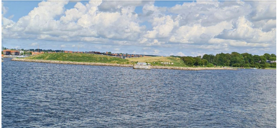
Tippen set fra dæmningen på Hornsherredssiden. I forgrunden ses den sidste bevarede bropille, Tandstumpen.

Med udgangspunkt i ovenstående opmærksomhedspunkter er det LYTT's anbefaling, at projekt kulturhus på Tippen sættes i bero. Dette med baggrund i risikoen for en ufremkommelig proces med Kystdirektoratet, risikoen for borgerprotester og det faktum, at det er tvivlsomt om et kulturhus giver stedet tilstrækkelig merværdi til at berettige en så markant placering i landskabet.