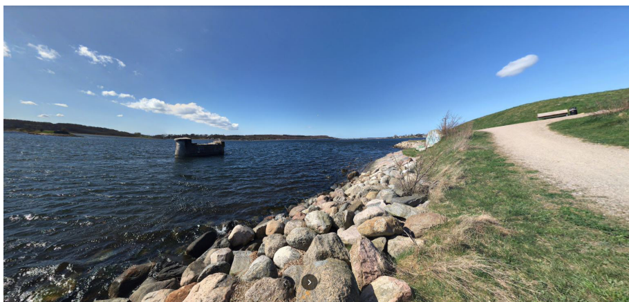
Den sidste bropille ligger som en monolit i vandet og den kaldes Tandstumpen.