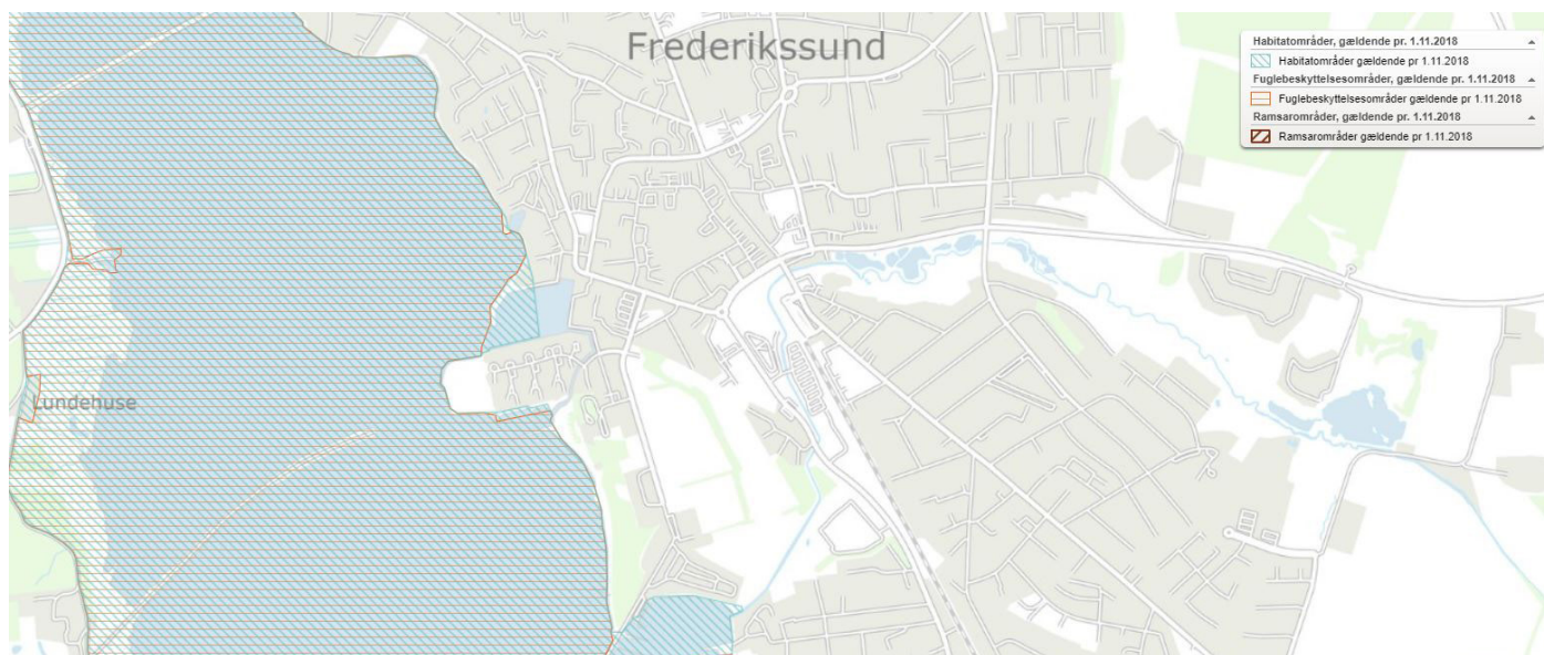
Kortet viser Natura2000 områdets udbredelse i Roskilde Fjord.

Kystnærhedszonen uden for udviklingsområder er af national interesse, og skal så vidt muligt friholdes for bebyggelse og anlæg, som ikke er afhængige af nærhed til kysten. Hovedsigtet er, at de åbne kyster fortsat kan udgøre en væsentlig naturværdi og landskabelig værdi. Tippen ligger indenfor kystnærhedszonen, hvilket indebærer, at projektets indvirkning på kystlinjen skal afklares – ikke mindst fra Hornsherred siden.