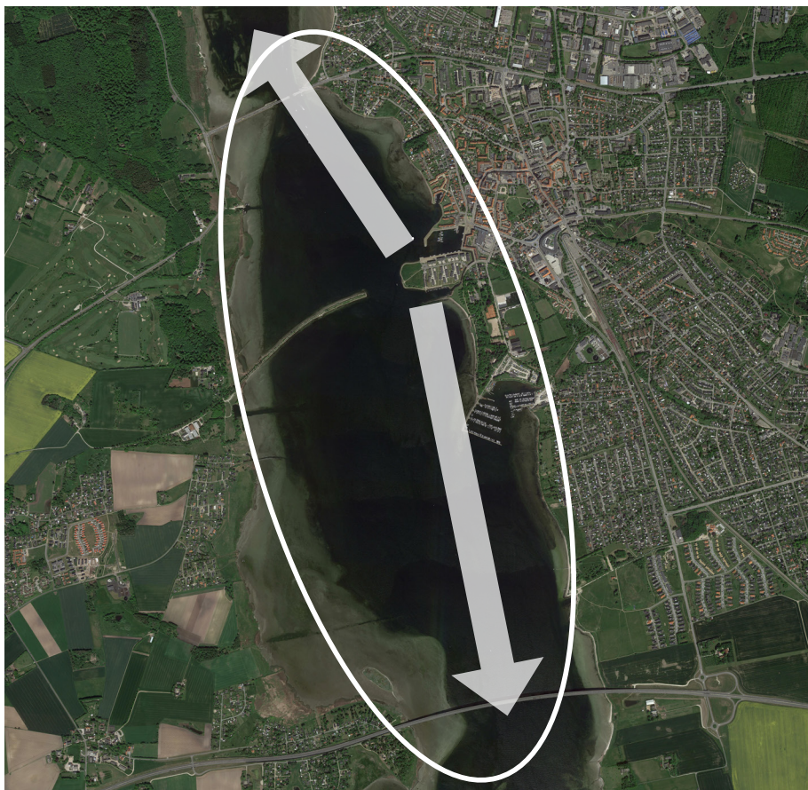
Tippen er synlig fra et stort område, både på Hornsherred-siden og på Frederikssund-siden