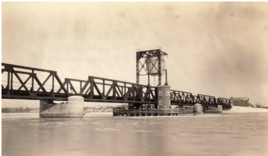
Jernbanebroens ståldel der nu anvendes som forbindelse over Limfjorden.

LYTT Architecture har udarbejdet nærværende uvildig rapport, der beskriver, hvilke udfordringer der er forbundet med dette anlægsarbejde i forhold til trafikforhold, jordhåndtering, kystdirektoratet mv.. Samtidig har vi lavet en vurdering af de landskabelige konsekvenser et sådant byggeri vil få på en kunstigt anlagt halvø.