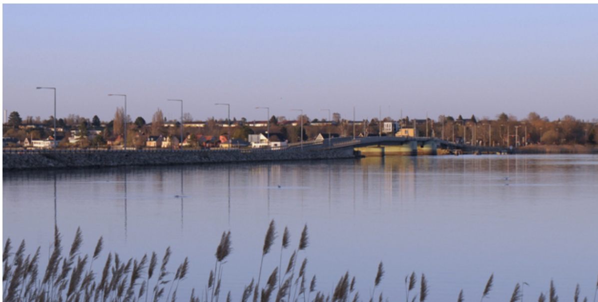
Kronprins Frederiks Bro.