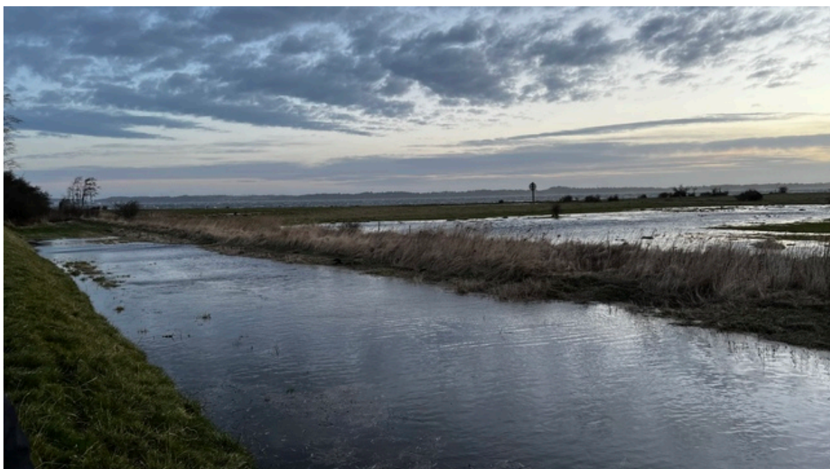
Vandet står højt ved Revelinen i Kulhuse søndag kl. 8.

På grund af stormen har beredskabet i nat haft 13 udkald til bl.a. væltede træer mv. Nattevagterne i hjemmeplejen har haft en rolig nat. Nu afventer beredskabet den maksimale vandstand. Alle watertubes er på plads.