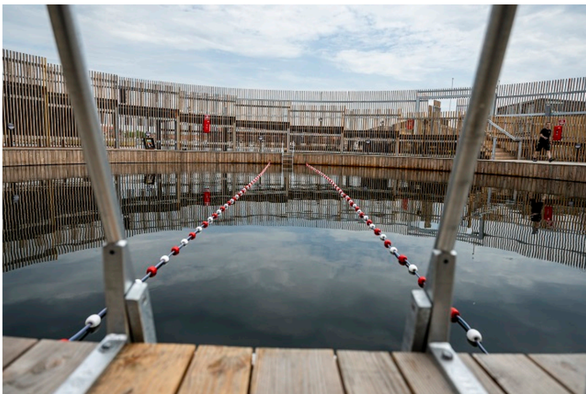
Kultur- og Havnebadets indvendige bassin.