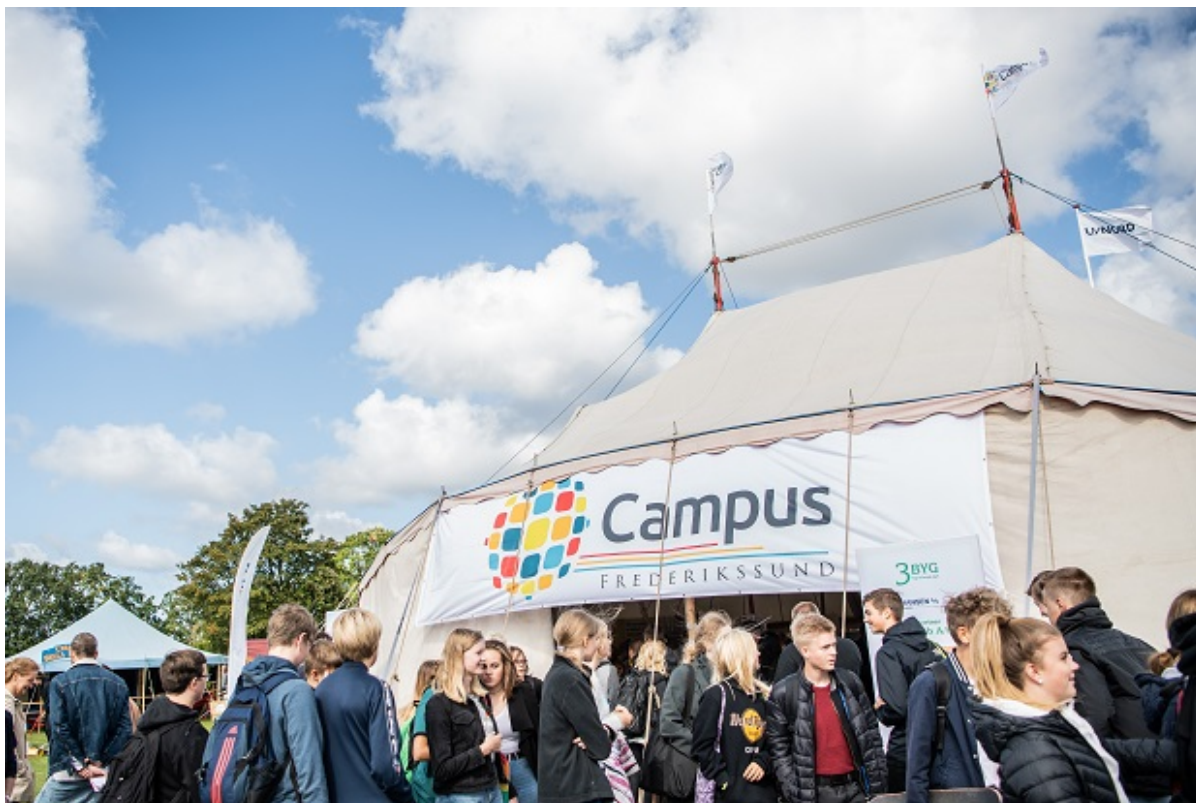
Unge mennesker samlet til Campusdag XL.