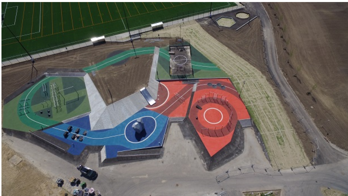
Den udendørs gymnastiksal ved den nye svømmehal set fra luften.