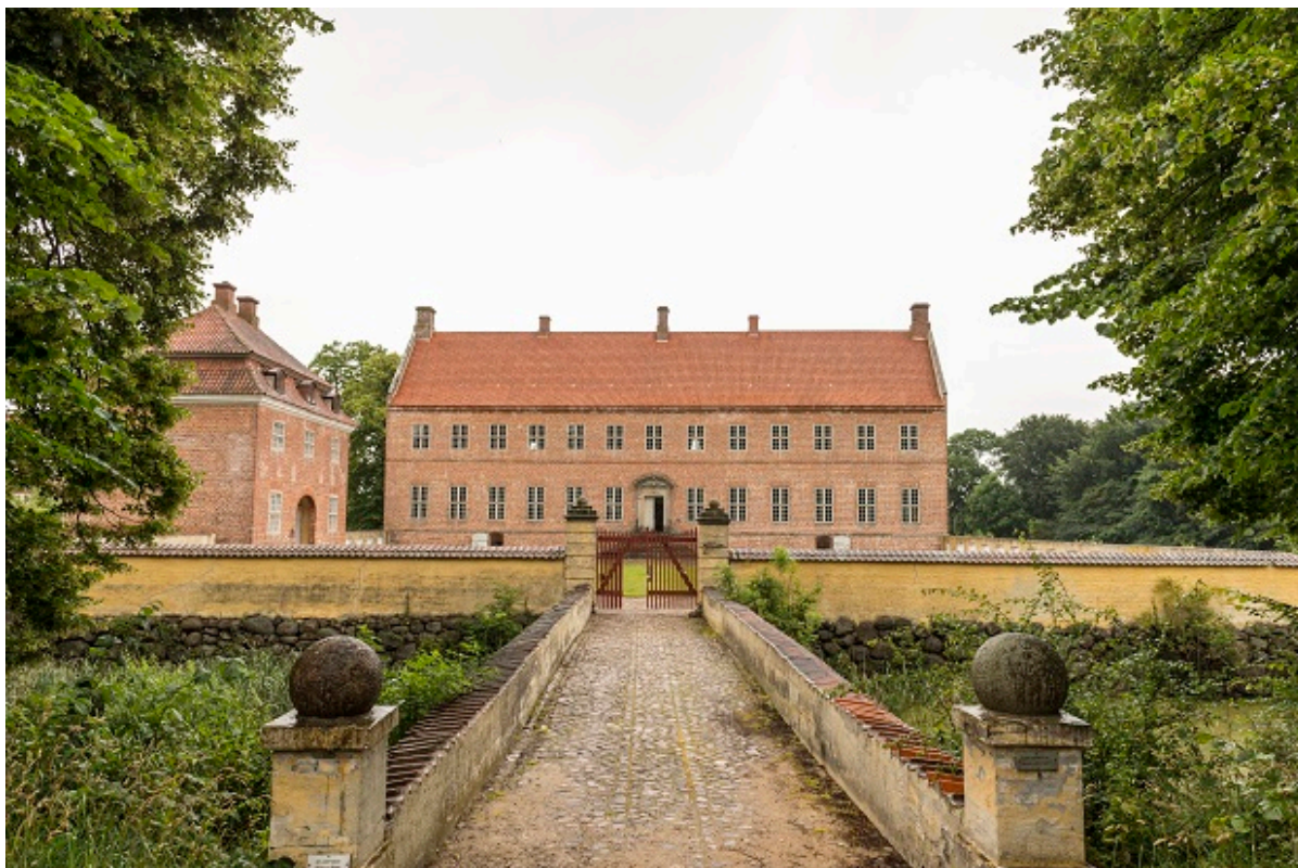
Broen over til Selsø Slot.

Måske kender du allerede Natureventyr fra nogle af vores nabokommuner? Og hvis du gør, ved du at ikke to eventyr er ens – og det er værd at opleve dem alle sammen.