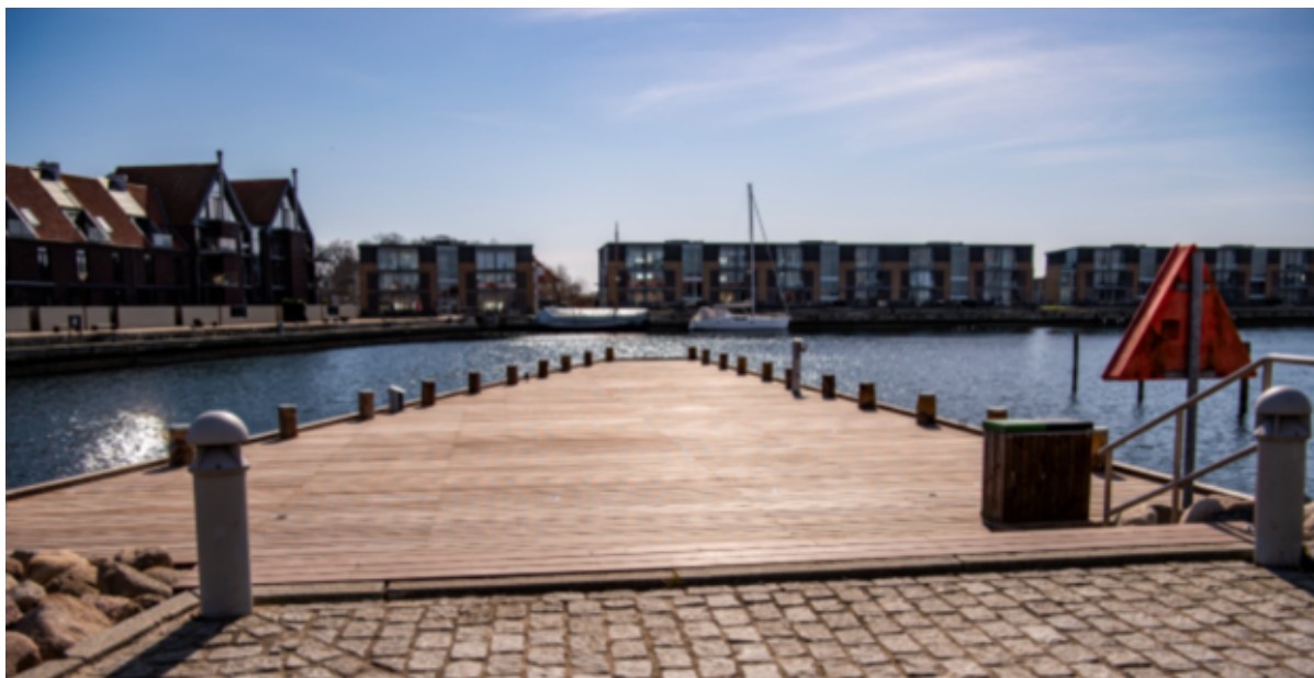
Havnen i Frederikssund på en solskinsdag.