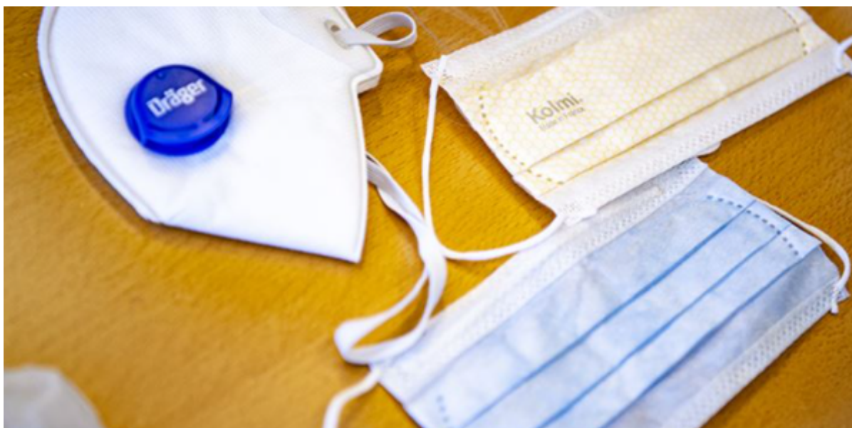
Mundbind og maske på et bord.

Med sidste uges genåbningsaftale slækkes der på en lang række retningslinjer, som har påvirket den kommunale hverdag. En af de mest markante er kravet om mundbind. Læs ugens coronastatus her.