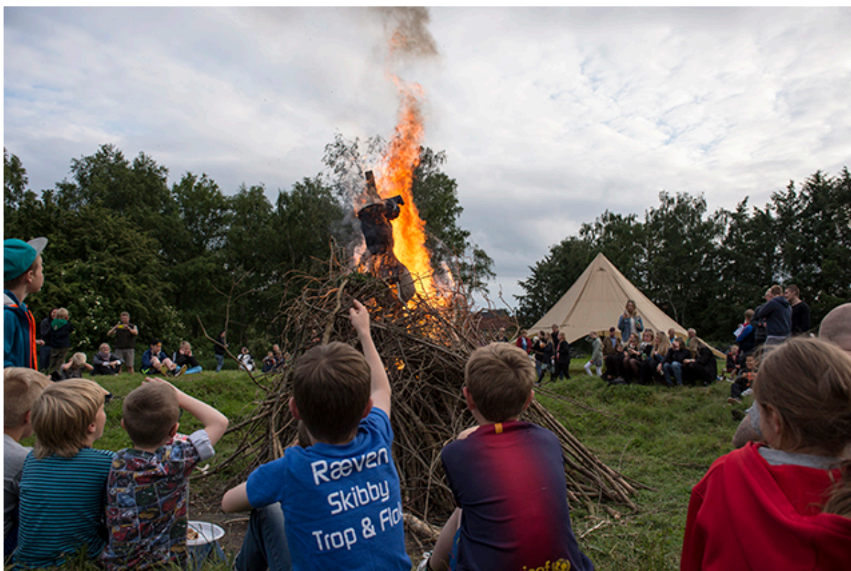
Spejderne har tændt ba let i Skibby.