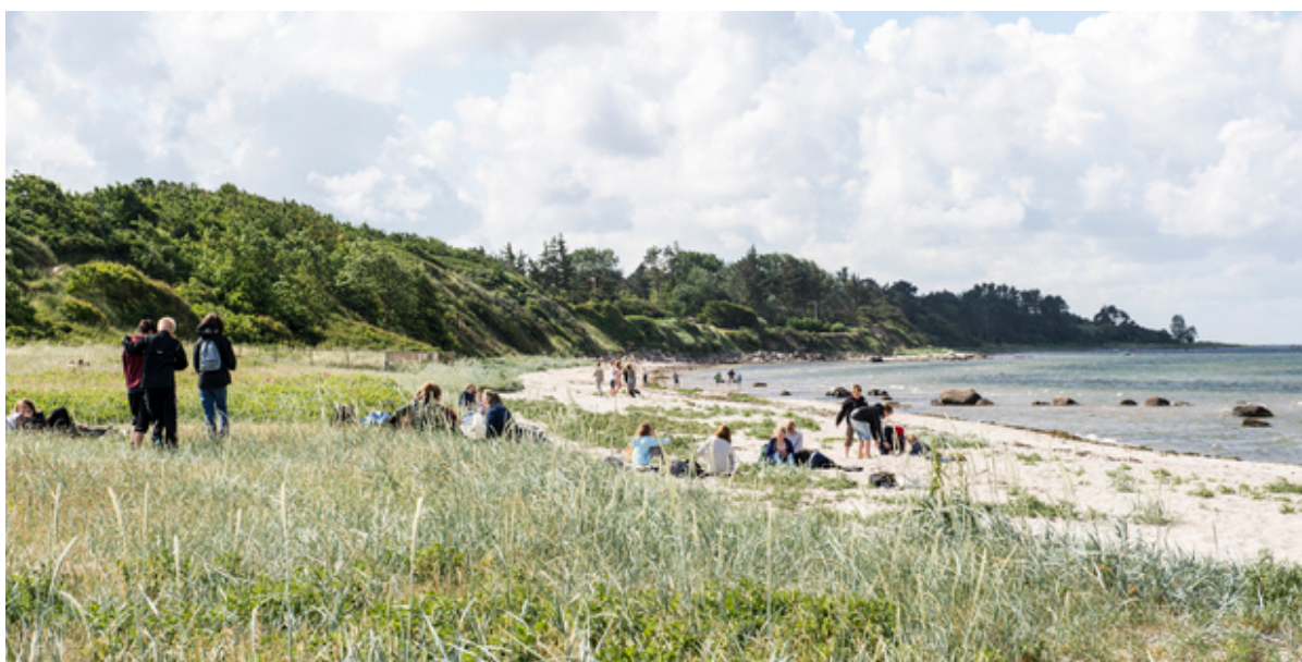
Kulhuse Strand.

Gennem sommeren kan du deltage i forskellige aktiviteter på Frederikssund Kommunes Blå Flag-strande i Kulhuse og Marbæk. Aktiviteterne er offentlige arrangementer uden tilmelding.