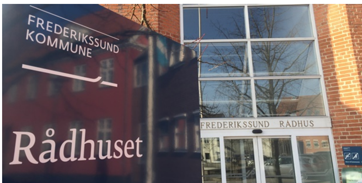
Frederikssund rådhus hovedindgang.

Byrådet har netop sendt kommunens årsregnskab for 2020 til revisionen. Regnskabet viser et overskud på 147 mio. kr., hvilket er godt 165 mio. kr. større end forventet. Kommunens kassebeholdning er steget gennem hele 2020, og var ved udgangen af året på 267,9 mio. kr. Regnskabet for 2020 viser dermed en sund og robust økonomi.