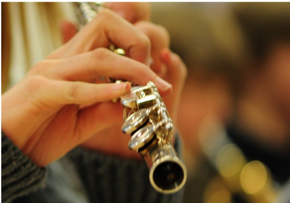
Pige med fløjte.