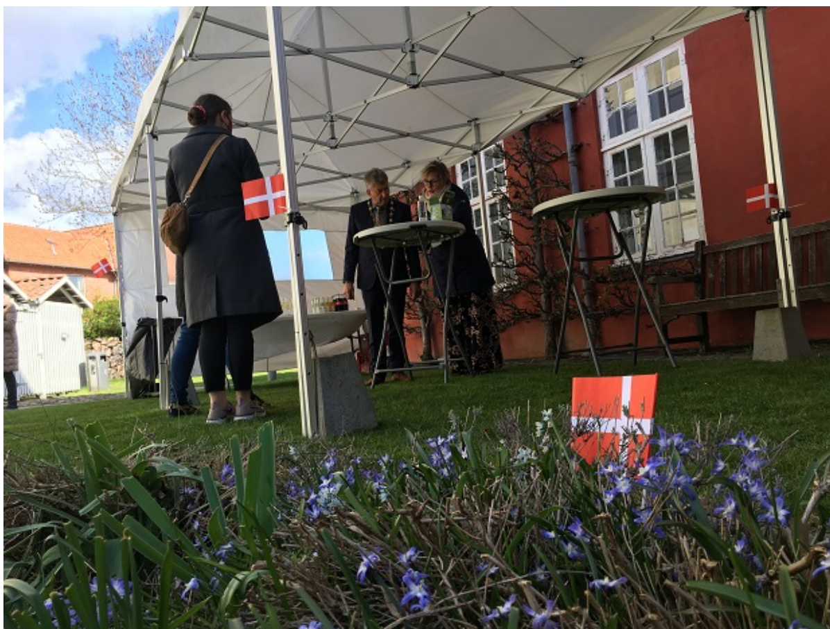
Flag og blomsterbed ved grundlovsceremoni.