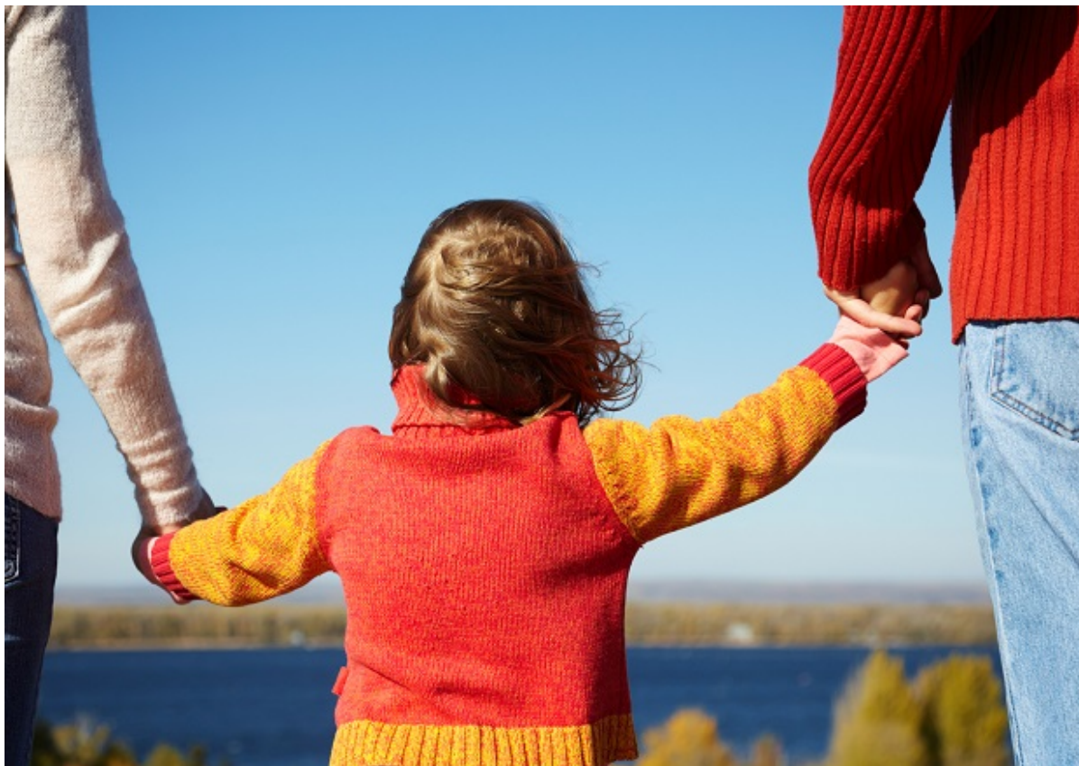
Pige holder i hånd med to voksne.

For nyligt kom det frem, at der på børnehandicapområdet i Frederikssund Kommune er en høj omgørelsesprocent på 81 procent på de sager, som er blevet indbragt for Ankestyrelsen. Men kun 21 ud af 350 sager har været forbi Ankestyrelsen i 2020.