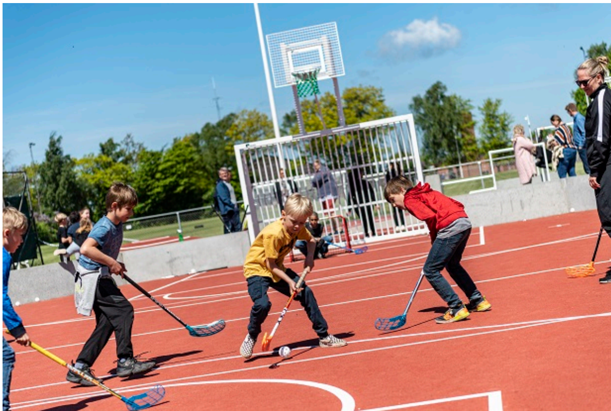
Børn spiller hockey.

Byrådet har godkendt en ny børne- og ungepolitik gældende for 2021 til 2024. Børne- og Ungepolitikken skal være med til at sætte retningen for arbejdet med området i de næste år og sikre, at Frederikssund Kommune er et godt sted at vokse op.