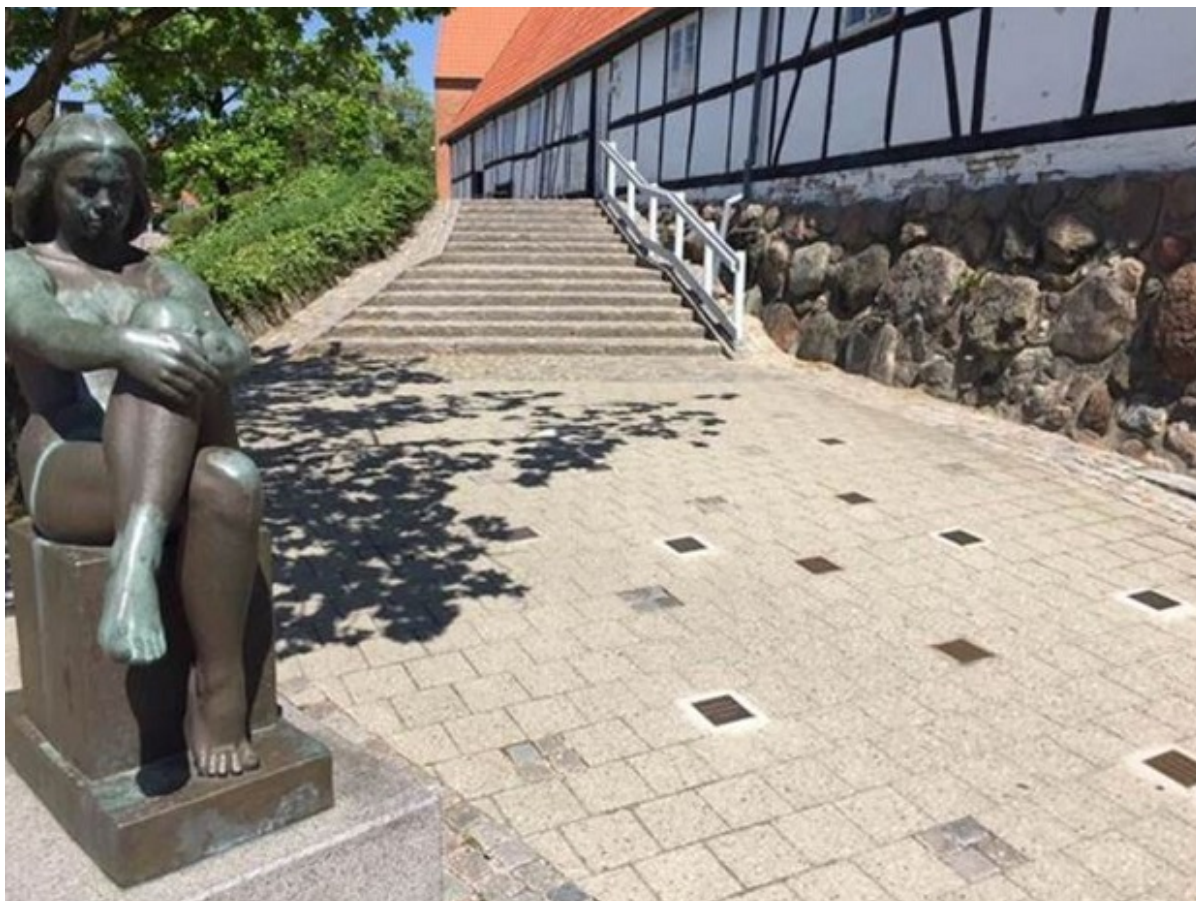
Torvet foran Langes Magasin, hvor der ligger plader med tidligere vindere af Kulturprisens navne er indgraveret.