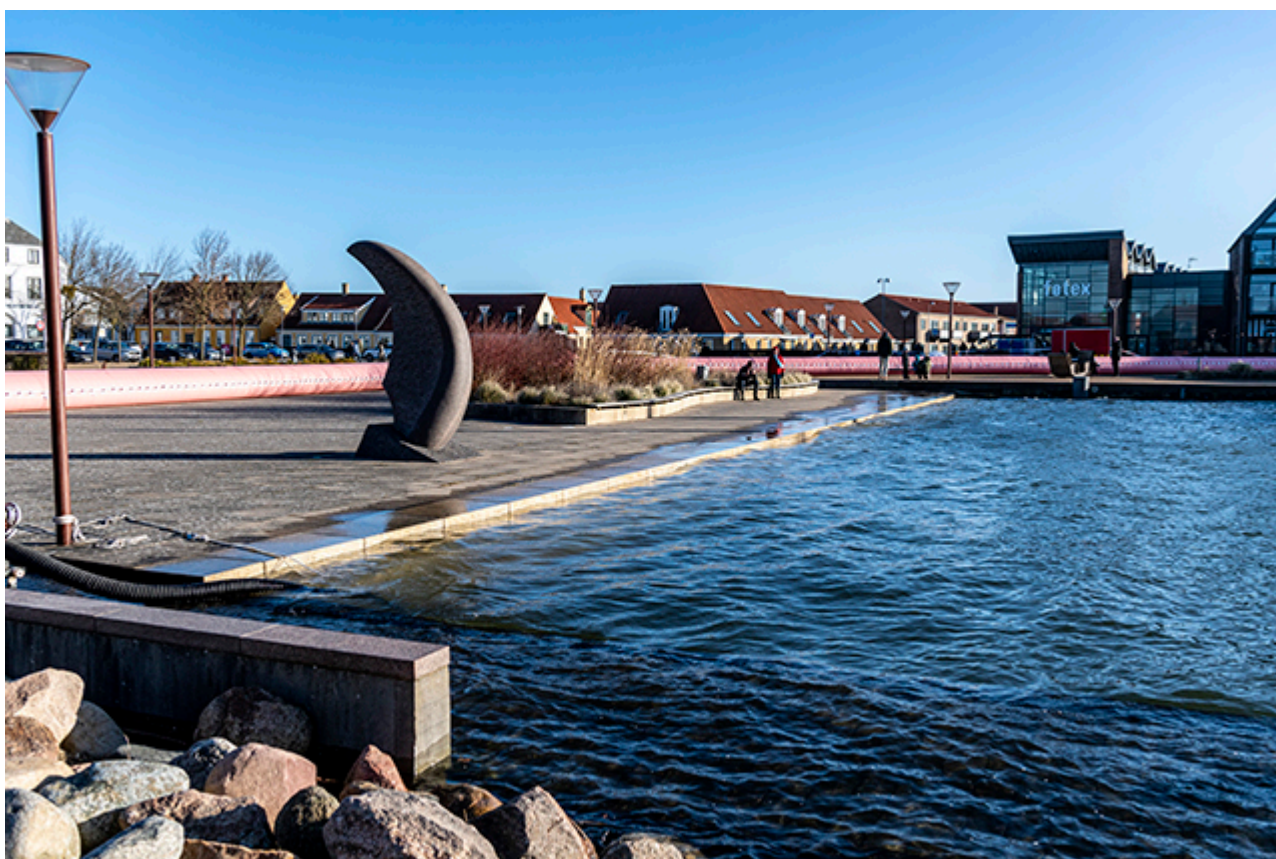
Frederikssund Havn med højvande og watertubes på havnefronten.