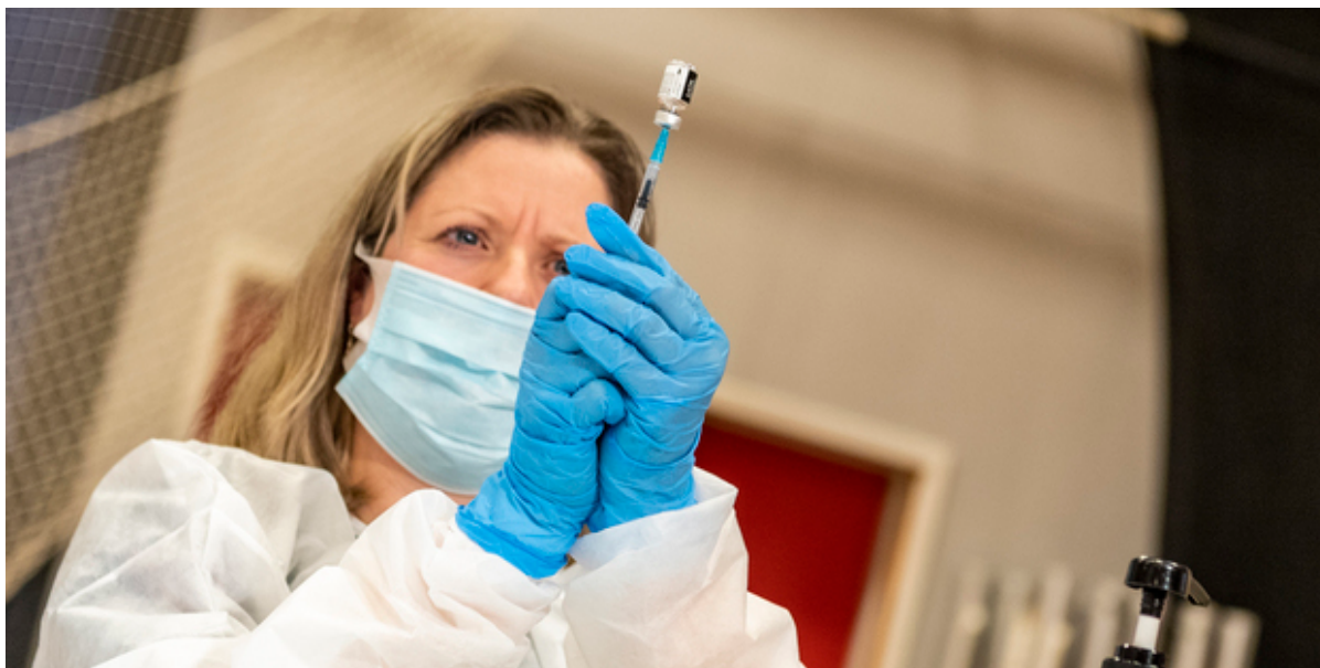
Sygeplejerske med kanyle.