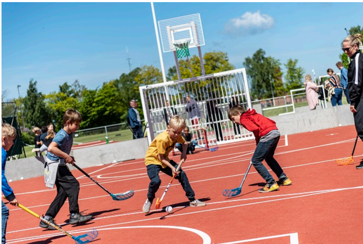
Børn spiller hockey.