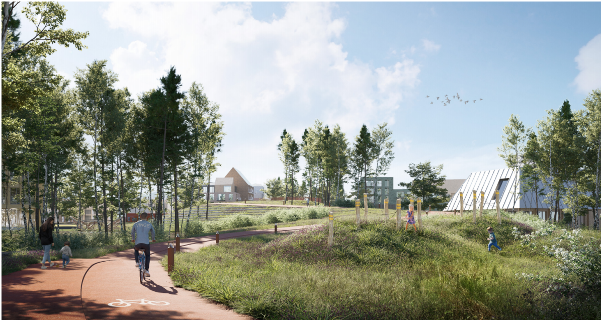
Illustration af natur og bebyggelse i Vinge. Illustration: Arkitema.

Frederikssund Byråd har netop vedtaget en ny udviklingsplan for byen Vinge. Dermed er retningen lagt for de næste mange års fysiske planlægning og udvikling af Vinge.