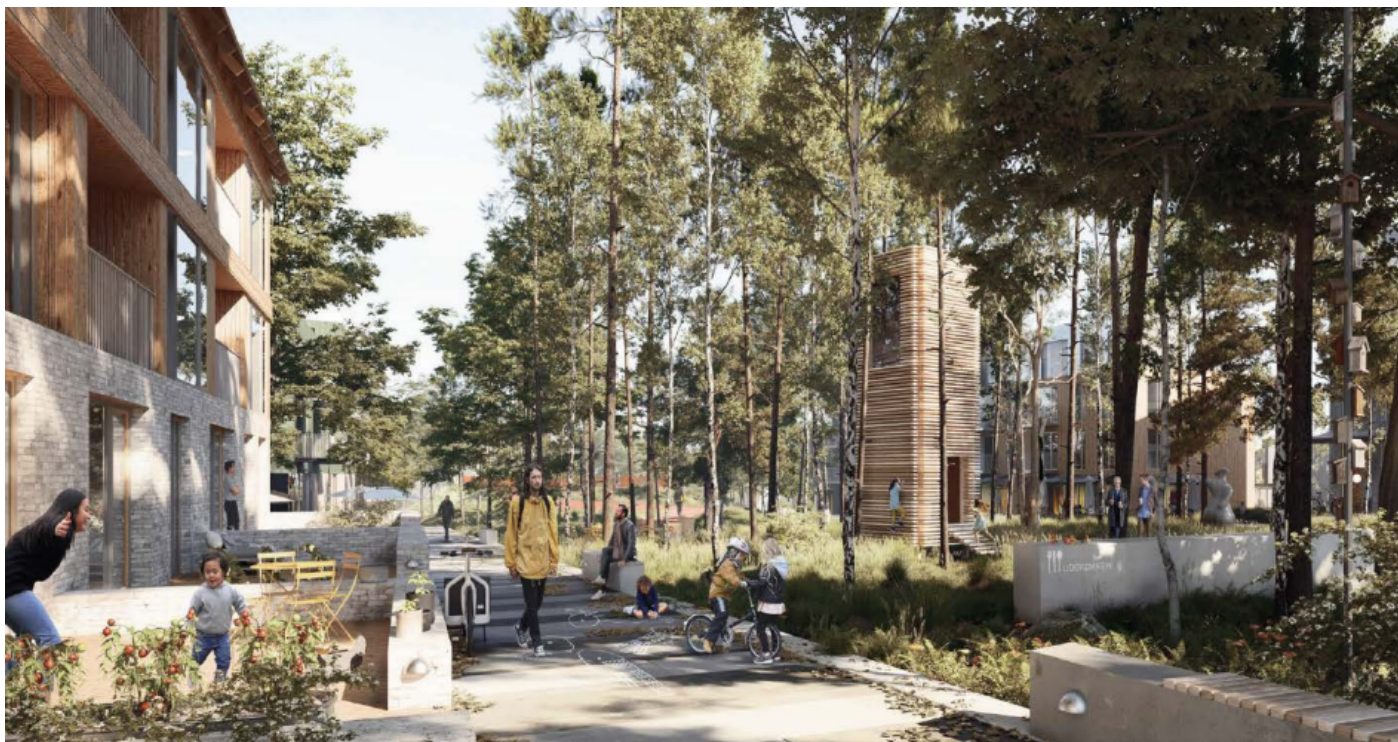
En del af det centrale Vinge ifølge udviklingsplanen.

etableringen af deres 100 grønne fællesskabsboliger, og til næste år begynder Innovater og Bærebo byggeri af flere hundrede boliger samt en dagligvarebutik, apotek og café.