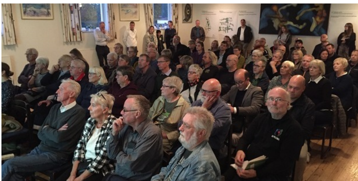
En fyldt sal i St. Rørbæk Forsamlingshus.

Der var fuld gang i nye ideer og forslag til, hvad byen Vinge skal kunne i fremtiden, da der tirsdag den 12. oktober blev holdt borgermøde i St. Rørbæk forsamlingshus. Og det var netop formålet med mødet.