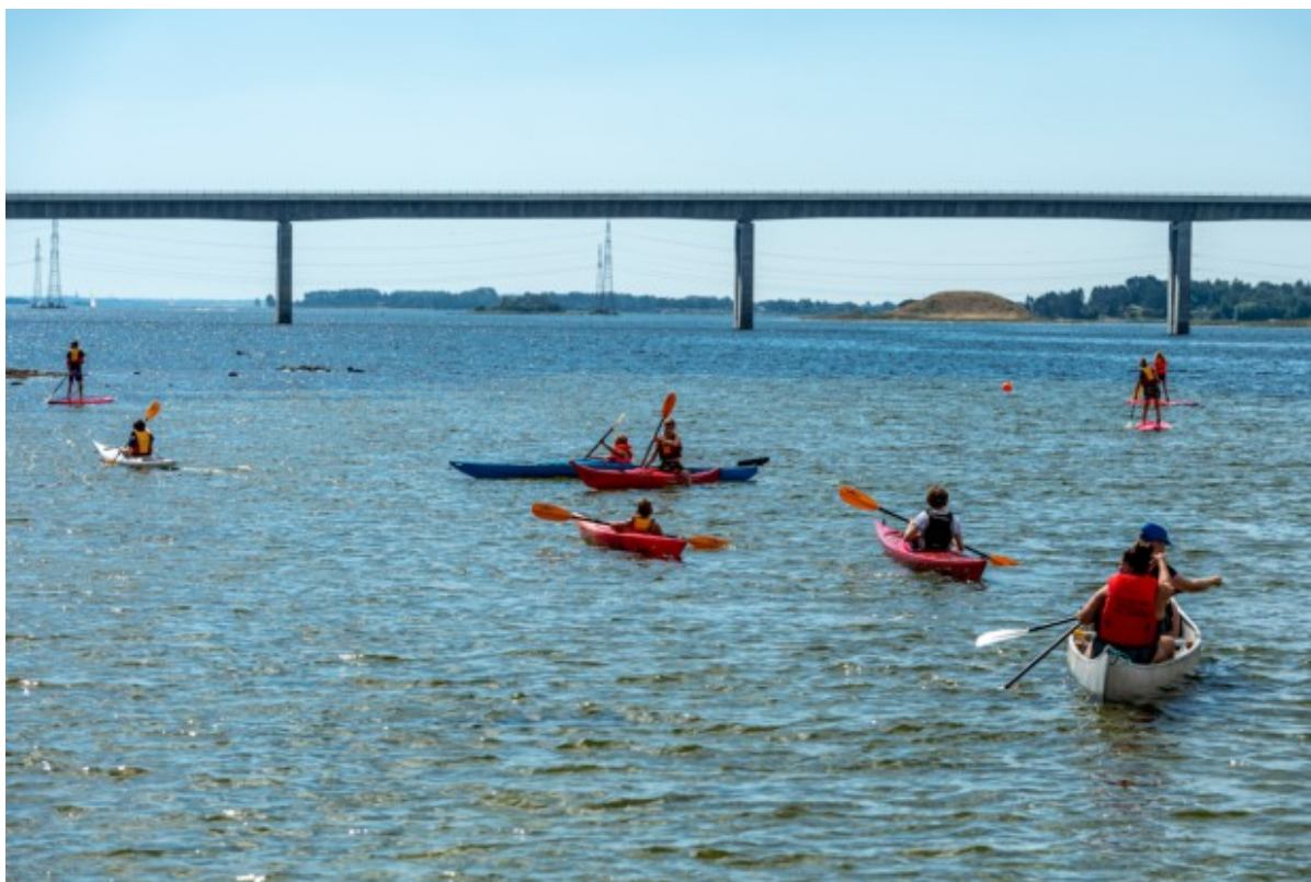
Kajaksejls på fjorden.

Frederikssund, Roskilde og Lejre kommuner arbejder på at styrke det tværgående turistsamarbejde i fjordlandet, og nu har de tre kommuner taget næste skridt til at forløse de store turismepolitiske potentialer ved at ansætte VisitFjordlandets nuværende projektchef som ny DMO direktør.