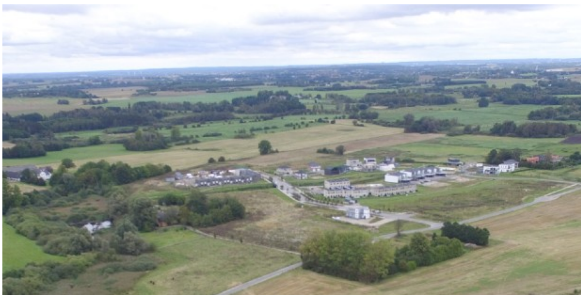
Luftfoto af Deltakvarteret i Vinge.

En lokalplan for de tre storparceller vest for Deltakvarteret er nu endeligt vedtaget. Dermed er plangrundlaget på plads for kommende byggeri på grundene, som i øjeblikket er i udbud.