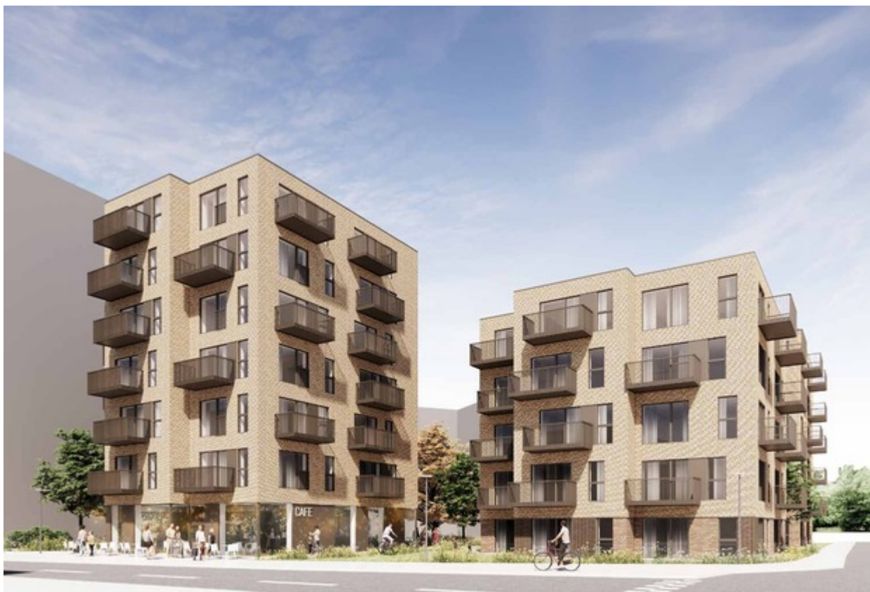
Visualisering af Innovaters kommende byggeri i op til syv etager i Vinge.

Med dette seneste købstilbud fra Innovater, som har en optionsperiode på seks måneder, tegner der sig nu en endnu større byggeaktivitet i Vinge end først antaget. Med købsaftalerne tidligere på året er der nu udsigt til i størrelsesordenen 550 nye boliger i Vinge over de kommende år. Noget af det første byggeri, der påbegyndes, er Domeas 198 almene boliger lige syd for stationen i Vinge.