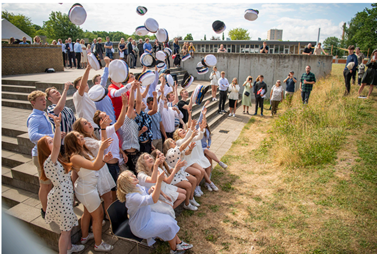
Huerne blev kastet klassesvis på Handelsgymnasiet lørdag.

Det har ikke været en helt normale studietid for dette års studenter. Næsten et helt år har været med hjemsendelse og fjernundervisning; for HF'er med kun to studieår i alt, har dét været ekstra hårdt. Alligevel kunne de alle fredag og lørdag – på næsten helt normal vis – springe ud og op på studentervognene, og køre ud i sommerlandet og feste – sådan som studenter har gjort det i umindelige tider.