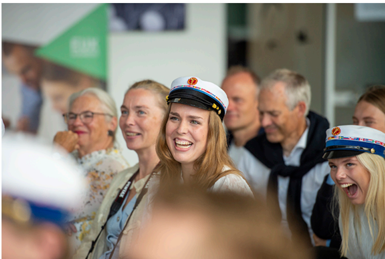
Talerne fik smil og glæde frem hos studenterne.