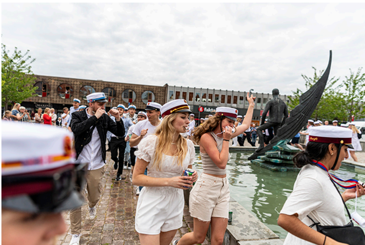
Der dances om springvandet.