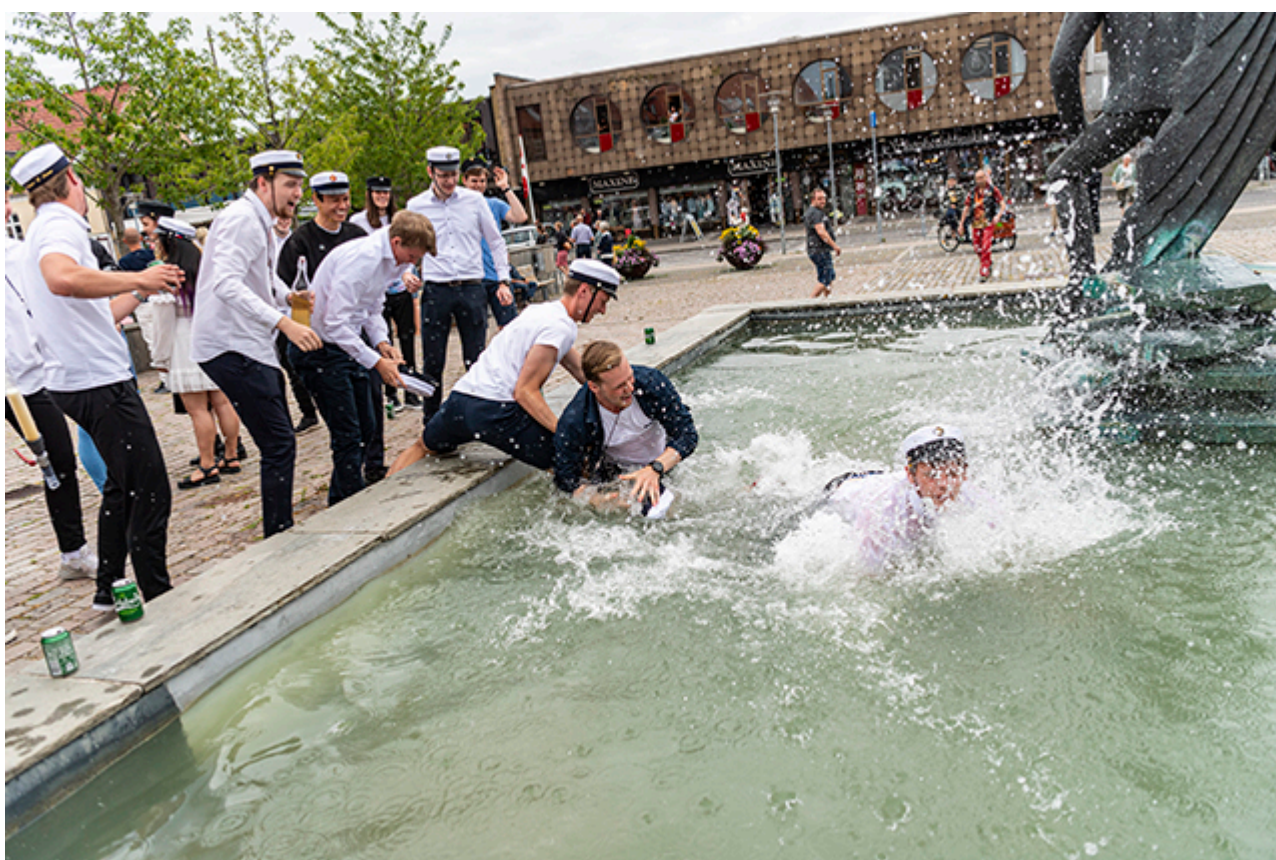
Traditionen tro ma tte nogle studenter en tur i springvandet pa Torvet.