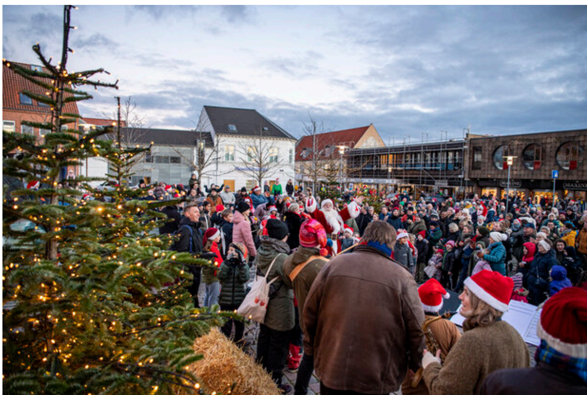
Mange mennesker forsamlet på Torvet i Frederikssund til juletræstændingen i 2022.

Fredag den 17. november kl. 16 – 18 vil borgmesteren og julemanden tænde juletræerne i Frederikssund. Der er lagt op til en hyggelig eftermiddag for børn og voksne med lys, julegodter og god julestemning i hele bymidten. Se juletræsarrangementer i byerne her.