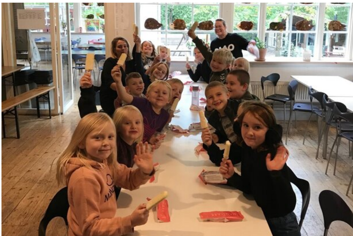
1. gult hold på Slotsparkens Friskole vandt is til hele klassen.