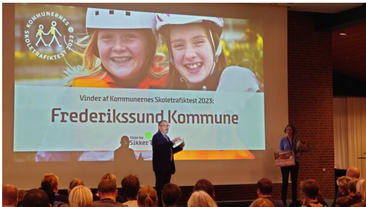
Frederikssund Kommune bliver kåret til vinder af kommunernes trafiktest 2023.