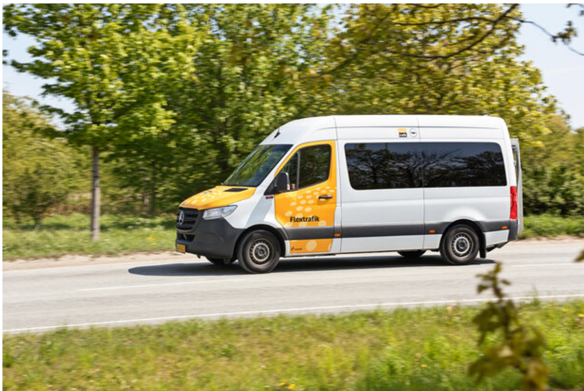
Flexbus kører hen ad vejen.