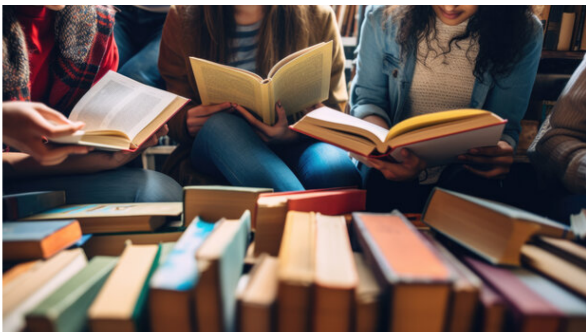
Unge mennesker læser bøger.

Slots- og Kulturstyrelsen har netop bevilget 225.000 kroner til Frederikssund Bibliotekerne til et nyt projekt, der skal styrke unges læselyst. Projektet skal gennemføres i samarbejde med Trekløverskolen, afd. Marienlyst og skal i fællesskab med lærere og elever i 7. - 9. klasse udforske og understøtte motivation og lyst til læsning blandt de unge.