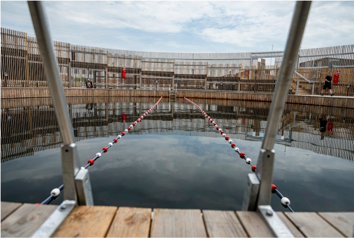
Kultur- og Havnebadets indvendige bassin.

Fra januar 2025 ændres Frederikssund Kommunes udbudsproces. Fremover udsender vi ikke længere udbud gennem nyhedsbrevet.