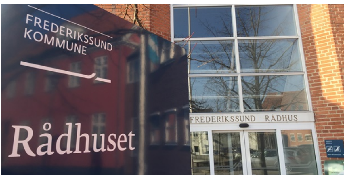
Rådhusets hovedindgang.

I februar 2022 indgav Attendo A/S en klage til Konkurrence- og Forbrugerstyrelsen over Frederikssund Kommunes beregning af afregningspriser for friplejehjemmet Attendo Lærkevej. Nu har Konkurrencerådet truffet afgørelse i sagen.