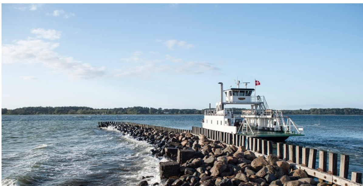
Færgen Columbus på vej ud af Kulhuse Havn.

Er du interesseret i at drive færgeoverfarten mellem Kulhuse og Sølager? Så har du nu mulighed for at blive prækvalificeret.