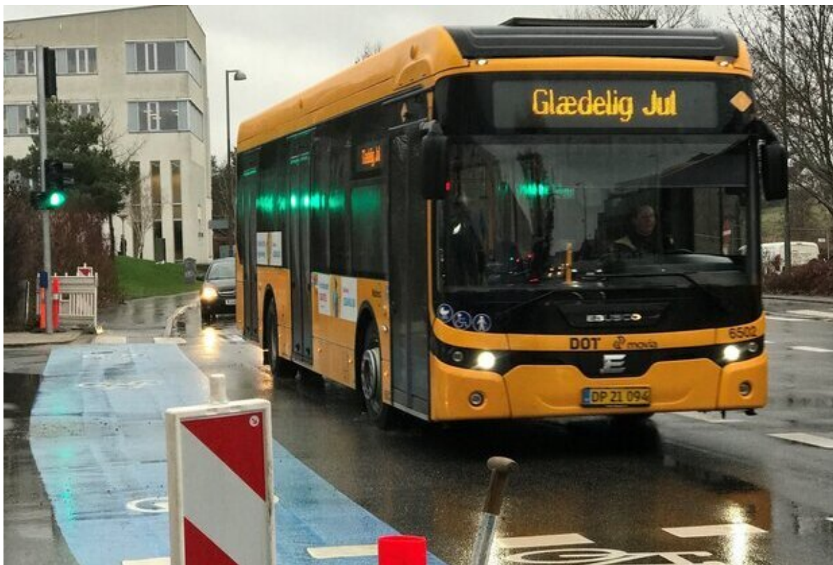
En bus kører gennem det nye lyskryds.