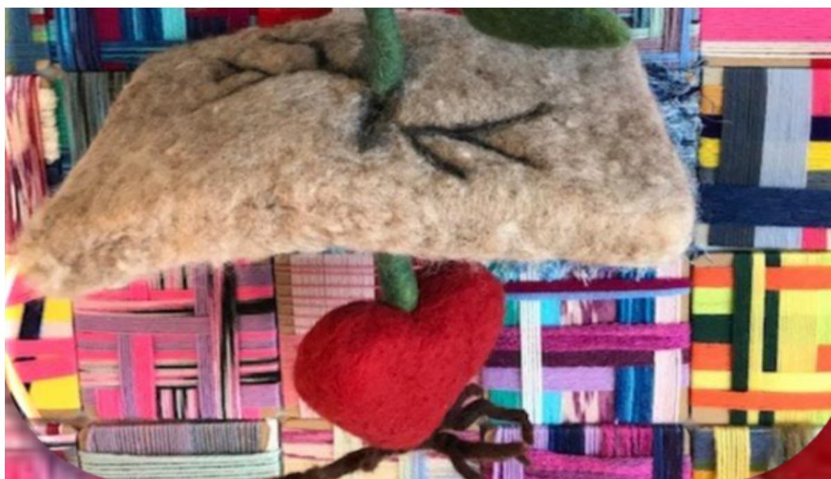
Et stykke kunsthåndværk med et filtet rødt hjerte på en pil.

I programmet for første halvår 2025 kan du finde kurser om hjerneskade, depression, selvudvikling og meget mere.